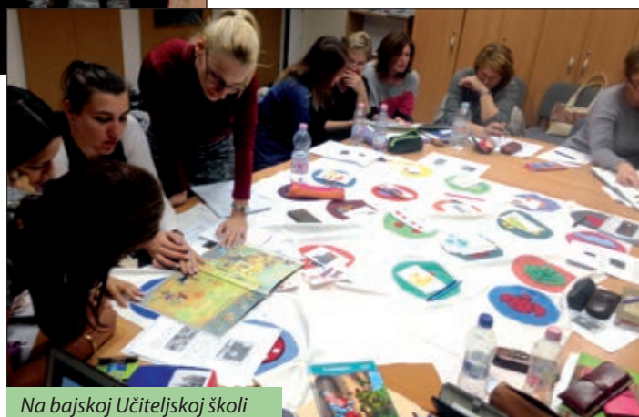
Na bajske Učiteljske škole

Ako se podsjetimo još jednom na činjenicu da su upravo nastavnici i odgojitelji ti koji, u većini, jedini još prenose hrvatski jezik djeci, onda svakako treba razmisliti o njihovim potrebama. Njihov se glas treba i mora čuti! U njih se treba ulagati i omogućiti im što kvalitetniji rad u odgojno-obrazovnim ustanovama, kako bi i znanje djece bilo bolje. Budući da su rezultati nedavnog istraživanja kompetencija učenika 8. razreda u po-