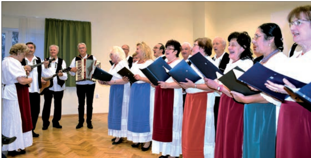
Pjevački zbor Duga – most s tamburašima sastava Hajnali

Na godišnjici predsjednik je sažeo dosadašnje djelovanje Samouprave. Na njezin je poticaj utemeljeno Zemaljsko društvo mađarsko-hrvatskoga prijateljstva poradi jačanja civilne sfere s jedne i druge strane granice. Tako su povezana mnoga naselja, udruge s obje strane granice, koje i danas surađuju. Samouprava je sudjelovala i u nekim prekograničnim europskim projektima, povezivali smo poduzetnike i obrazovne ustanove. Zahvaljujući tim vezama, u Kapošvaru godišnje više puta gostuju hrvatske udruge iz matične domovine, a dolaze i tamošnji svećenici održati mise na hrvatskom jeziku. Zajednicu je posjetio i bivši predsjednik Hrvatske Stjepan Mesić i drugi ugledni gosti matične domovine. Djelatnost je Samouprave razgranata, organizirala je predavanja s vrsnim predavačima kao što je dr. Dragutin Feletar o povijesti Zrinskih, Narodnosni dan, Hrvatski dan, a često se organiziraju i razni izleti u Hrvatsku, osim toga posjete i sudjeluju i u važnim programima Hrvatske državne samouprave. Zahvaljujući Samoupravi, već dugi niz godina djeluje i Mješoviti pjevački zbor Duga–most. Naziv je dobio po tome što okuplja Hrvate podrijetlom iz raznih hrvatskih