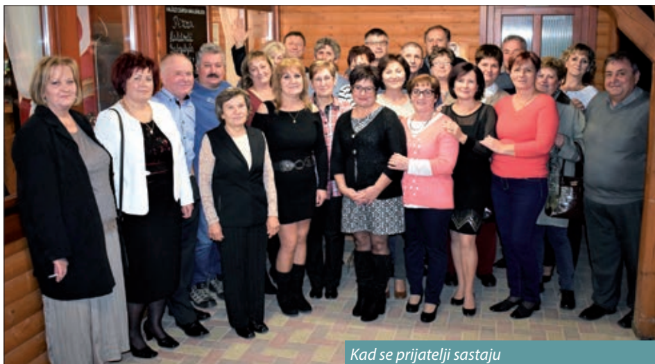
Kad se prijatelji sastaju

S jedne sam strane osjećala neku vrstu tuge, a s druge neizrecivu radost. Zašto tugu? Jer, evo, iza nas stoji niz godina... izgubili smo troje prijatelja i neke naše nastavnike. Ali ipak radost je prevagnula, bila jača jer se odazvao velik broj bivših razrednih drugova (27 osoba) i svatko se veselio ponovnom susretu.