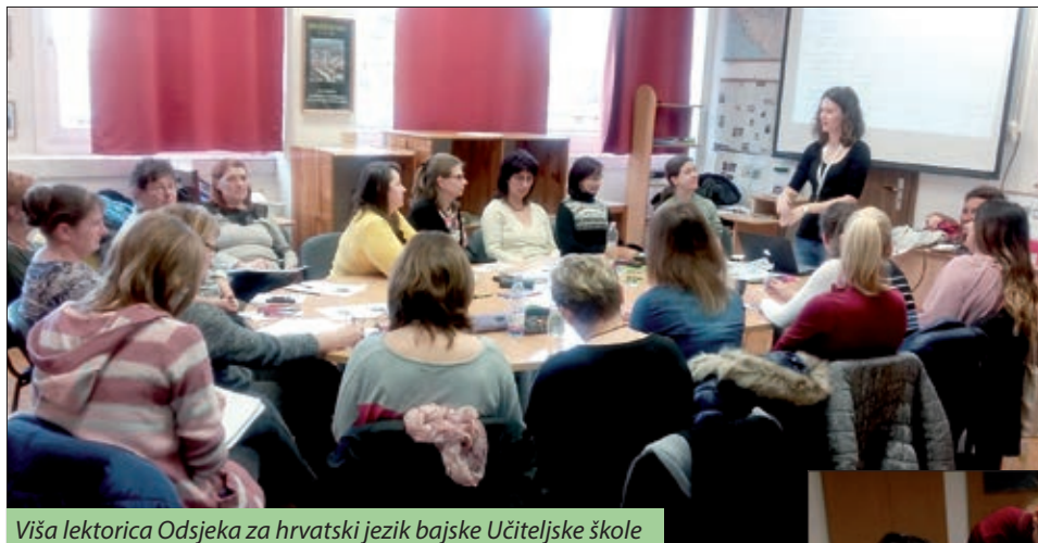
Viša lektorica Odsjeka za hrvatski jezik bajske Učiteljske škole

Ne oglašujmo se na glasove i potrebe nastavnika!