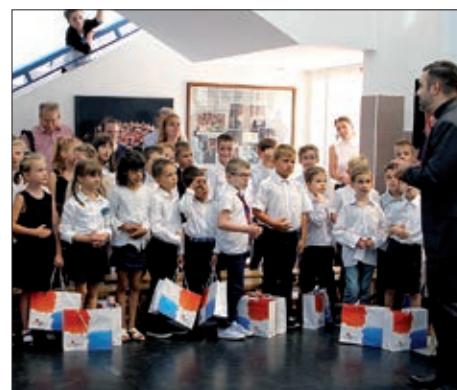
Otvorenje školske godine u HOŠIG-u