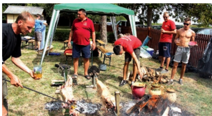
Uz kotliće vrtio se i ražanj.