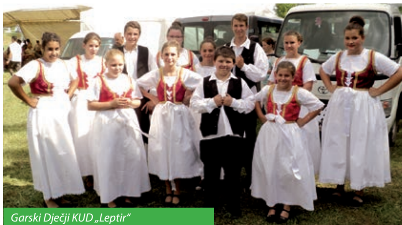
Garski Dječji KUD „Leptir“