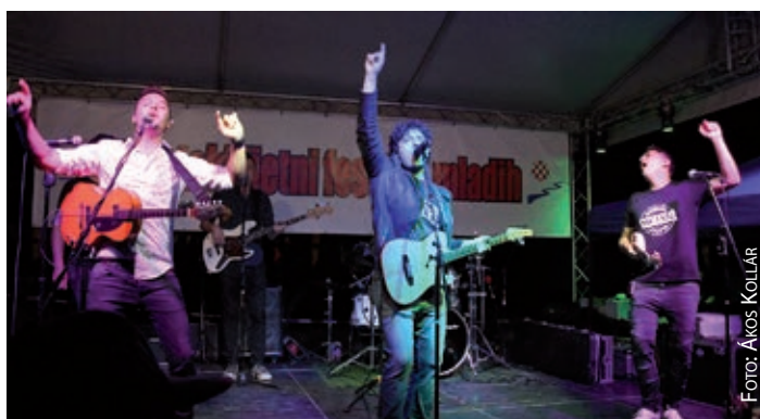
Tamburaški sastav Mejaši