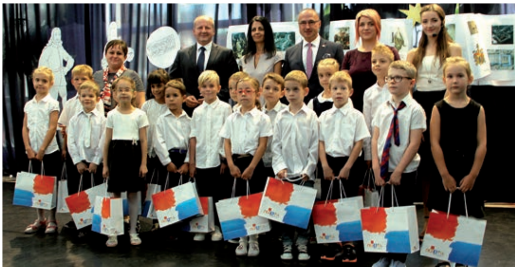
Prvašići u društvu ravnateljice, učiteljice i visokih uzvanika

Ministar István Simicskó čestitao je učenicima, nastavniciima za viđeno te ujedno i roditeljima što su odabrali ovu školu. Istaknuo je kako je izričito tijesna i dobra suradnja Ministarstva kojem je na čelu s hrvatskim veleposlanikom i Republikom Hrvatskom te njegovim partnerom Damirrom Krstičevićem. Istražujući obiteljsko stablo sve do 1200. godine, osim mađarskih, otkriveno je i mnoštvo slavenskih prezimena poput Babića ili Sanića. Nadovežući se na misli njemačkoga književnika Goethea, rekao je da ono što najviše možemo dati svojoj djeci jesu korijenje i krila. Korijenje, koje znači vrijednosti, pretke, po kojima će znati kamo pripadaju, krila kako bi imali snage ostvariti svoje snove i velike ciljeve. „Skloni smo pojedinim narodima pridodati pokoji pridjev i kada razmišljamo o tome što je karakteristično za Mađare i Hrvate, onda lako možemo doći do zaključka da je hrvatski narod gostoljubiv, ljubitelj prijateljstva i više puta sklapa doživotna prijateljstva, poštuje mater i golema je njegova ljubav prema djetetu“ – reče ministar Simicskó. Smatra da takva zajednica pru-