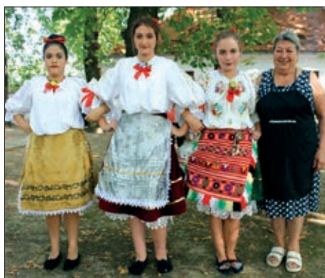
IV. Šokački piknik