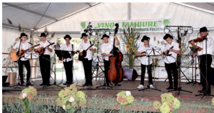
Tamburaši serdahelske škole