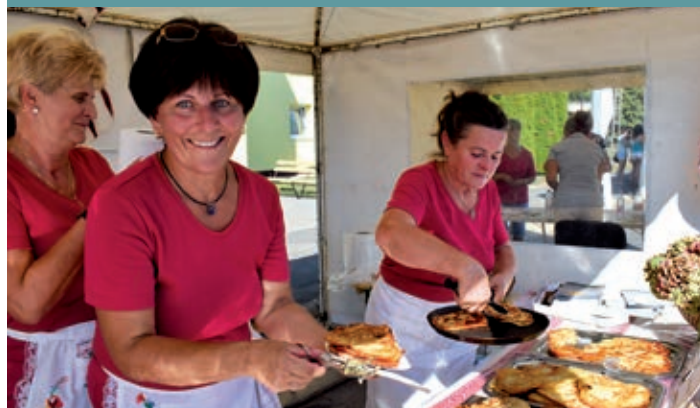
Zlevanka se radi s osmijehom.