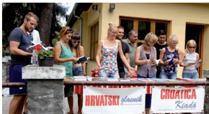
Izložba hrvatskih izdanja