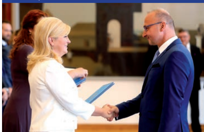
Predsjednica Grabar-Kitarović i novi veleposlanik Republike Hrvatske u Saveznoj Republici Njemačkoj Gordan Grlić Radman