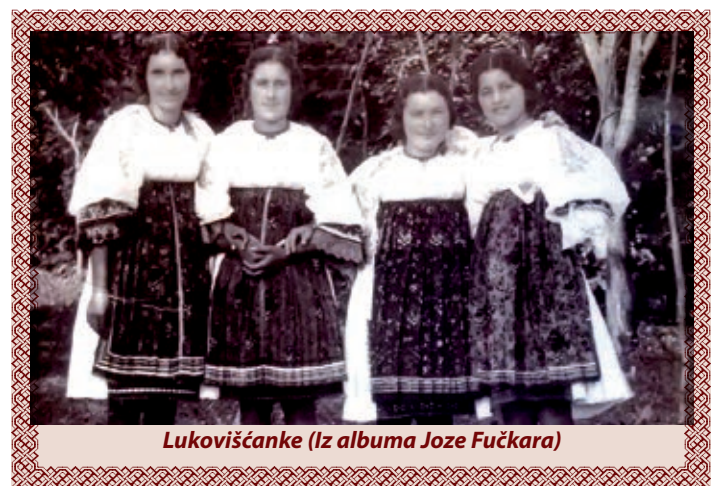
Lukovišćanke (Iz albuma Joze Fučkara)