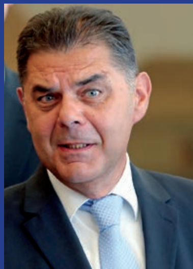
Veleposlanik Republike Hrvatske u Mađarskoj Mladen Andrić

ZAGREB, 24. kolovoza 2017. (Hina) – Predsjednica Kolinda Grabar-Kitarović uručila je vjerodajnice dvanaesterim novih hrvatskih veleposlanika, među njima i Mladenu Andriću, novom veleposlaniku Republike Hrvatske u Mađarskoj.