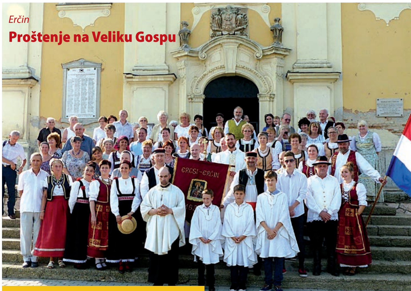
Fotografija za uspomenu na prelijepi običaj

U gradu Erčinu, gdje Hrvati žive od početka 17. stoljeća, i ove su se godine u lijepome broju okupili mještani, te gosti iz Bate i Tukulje na tradicijskome proštenju u čast Velike Gospe, 11. kolovoza 2017. u mjesnoj rimokatoličkoj crkvi, koju su djelomično iz dobrotvornih priloga podigli Hrvati Raci, te je posvetili u njezinu čast. O ovome prastarom običaju svjedoči i kanonska vizitacija iz 1747. godine.