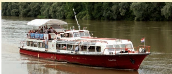
Brodom niz Dravu

Sutradan se pod šatorima kuhalo i predstavljali su se gastronomski specijaliteti hrvatskih regija u Mađarskoj. Zainteresirani ma je bila osigurana vožnja brodom „Jégmadár“ po Dravi.