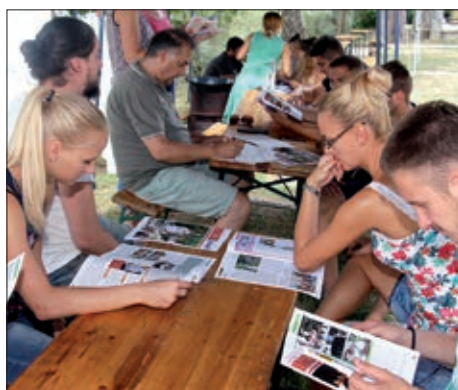
II. Hrvatski ljetni festival mladih