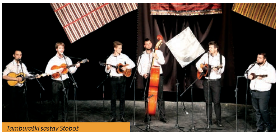
Tamburaški sastav Stoboš