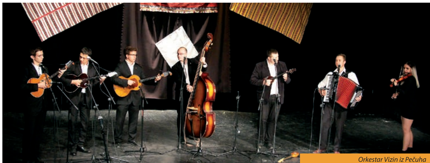
Orkestar Vizin iz Pečuha