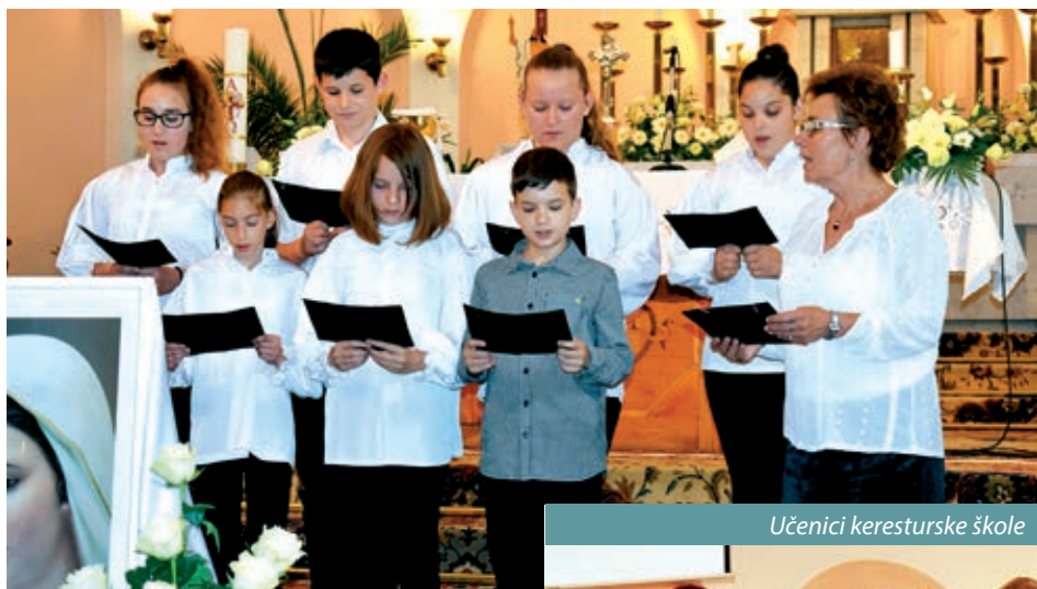
Učenici keresturske škole

Hrvatski narod slavi i časti Mariju kao svoju kraljicu. Tradicija svibanjskih pobožnosti seže u 16. stoljeće i veže se za štovanje Blažene Djevice Marije, najčešće sadrže marijanske pjesme. Upravo uz te pobožnosti veže se i Susret crkvenih zborova „Pozdravljamo Mariju“. Priredba je nastala na prijedlog pokojnog mons. Blaža Horvata, nekadašnjeg rektora Varaždinske katedrale, njega se prisjetila Marija Vargović, predsjednica kaniške Hrvatske samouprave, a zahvalila je i preloškom dekanu Antunu Hoblaju što nastavlja rad pokojnog rektora i pomaže malu hrvatsku pastoralu u Pomurju s redovitim potpomaganjem pri organiziranju hrvatskih