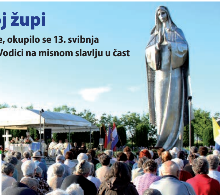
Podno Gospina kipa okupilo se tisuću vjernika.