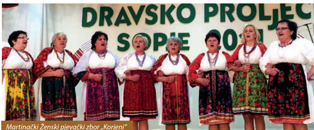
Martinački ženski pjevački zbor „Korjeni“

martinački ženski pjevački zbor „Korjeni“, KUD „Suopolje“ iz Suhopolja, KUD „Lipa“ iz Nove Bukovice, KUD „Usora“ iz Usore, KUD „Virovitica“ iz Virovitice, Udruga žena „Josipovo“ iz Josipova, KUD „Seljačka sloga“ iz Šljivoševaca, Klapa „Eufemija“ s otoka Raba, KUD „Mikleuš“ iz Mikleuša, KUD „Podravina“ iz Čađavice, KUD „Laz“ iz Laza i Klapa „Mela“ s Murtera.