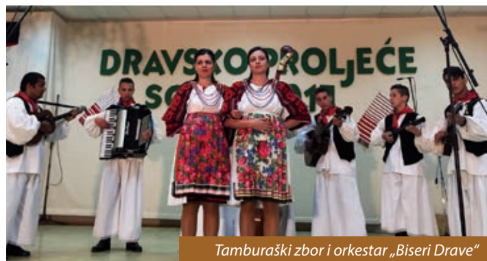
Tamburaški zbor i orkestar „Biseri Drave“

Prošlogodišnje jubilarno, deseto Dravsko proljeće održano je u Starinu, a ovo, jedanaesto, u Sopju 22. travnja. Jer svake se godine okupljaju Hrvati na dvjema obalama rijeke Drave, jedne godine u Starinu, druge u Sopju. I tako iz godine u godinu, jedne