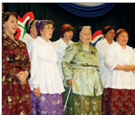
Hrvatski dan u Dušniku