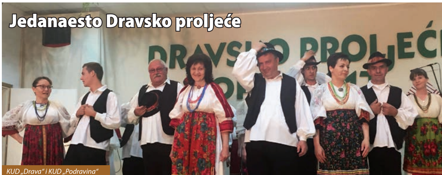
KUD „Drava“ i KUD „Podravina“