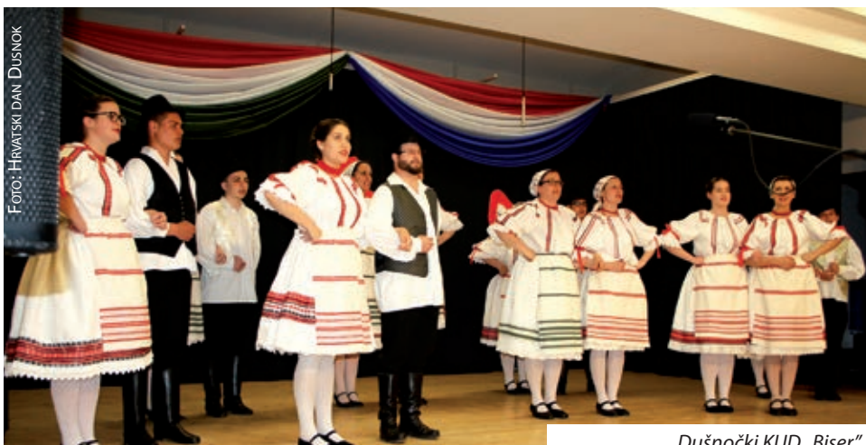
Dušnočki KUD „Biser“