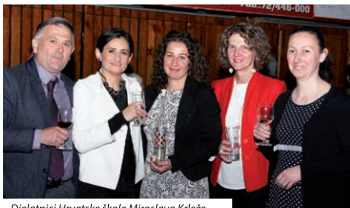
Djelatnici Hrvatske škole Miroslava Krleža