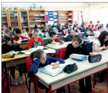
Koljnof – Buševac – Vukovina