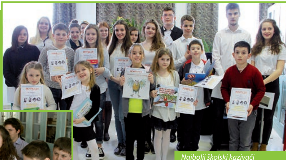
Najbolji školski kazivači

Na Svjetski dan pjesništva, 21. ožujka 2017., u knjižnici budimpeštanske Hrvatske škole recitacije umalo šezdeset kazivača popratili su prosudbeni odbor polaznici i pedagozi ustanove te nekoliko roditelja.