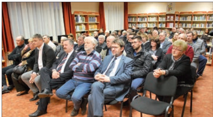
Okupila se brojna publika i mnogi uzvanici.

Kako uz ostalo reče dr. sc. Blažetin, rječnik sadrži više od dvadeset tisuća natuknica, od toga 2300 posuđenica, stranih riječi, dakle svega desetak posto cjelokupne građe. Sve ostalo govori o našem hrvatskom govoru koji odiše bogatstvom, bogatstvom koje, nažalost, nestaje pod utjecajem standardnog jezika, medija, suvremenog načina života.