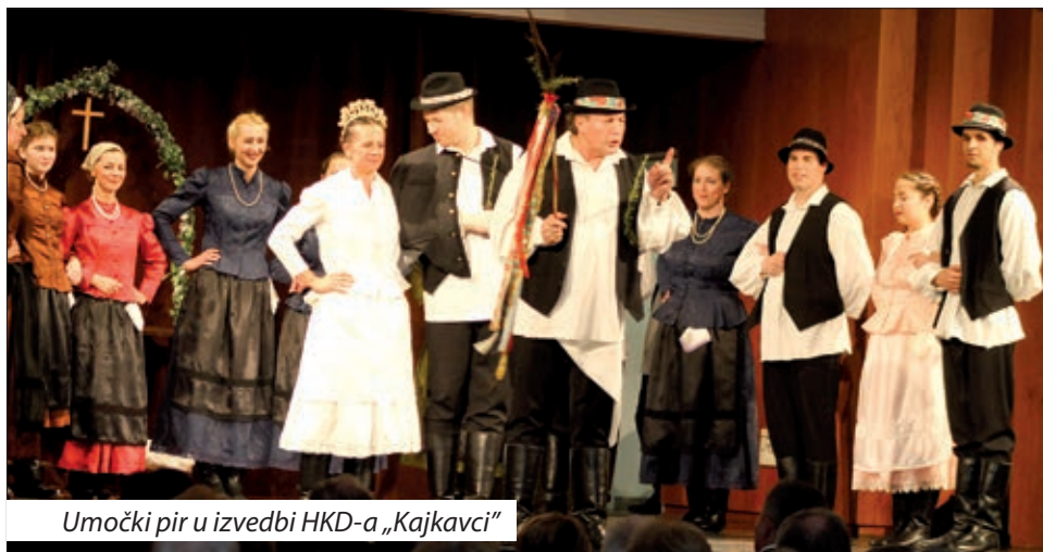
Umočki pir u izvedbi HKD-a „Kajkavci“

Po sambotelskom adventskom koncertu Gradišćanskih Hrvatov u Željeznoj županiji, predsjedništvo Društva Gradišćanskih Hrvatov u Ugarskoj se je dogovorilo da drugi gala program u Šopronu bit će malo proširen i da tamo dojdou uglavnom jačkarni zbori, tamburaši i folkloriši sjeverne županije Gradišća. Tako je došlo do toga gala programa velikog za generalnom sjednicom DGHU-a, 3. marcijusa, u petak, u Kulturnom centru „Ferenc Liszt“.