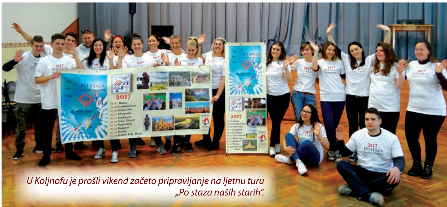
U Koljnofu je prošli vikend začeto pripravljanje na ljetnu turu „Po staza naših starih“.