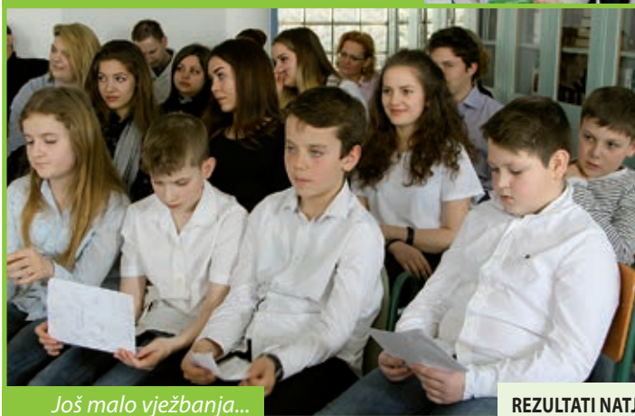
Još malo vježbanja...

Natjecanje u kazivanju pjesama i proze na hrvatskome jeziku posebna je osobitost u školskim odgojno-obrazovnim sadržajima budimpeštanskoga Hrvatskoga vrtića, osnovne škole, gimnazije i đačkoga doma, naime posljednjih godina osjetno je napredovanje, razvoj pri nastupima kazivača. Istinska je to svečanost hrvatske riječi, koja svima nama skreće pozornost kako ona i u ukoričenom obliku ima svoju budućnost jer za interpretaciju nije dovoljan hrabar, samouvjeren nastup osobe, odlično znanje hrvatskoga jezika, snalaženje u pojmovniku, nego načitanost, pomalo dublji pristup, kada se kod čitanja malo zastane pa se razmišlja. Ali osnova je znanje teksta. Kod polaznika nižih razreda još su uvijek prisutni rekviziti gestikulacije, što je i dobro jer je to poticaj na daljnji napredak kazivača. Možda kod izbora pisane riječi najviše dolazi u prvi plan dobro poznavanje sposobnosti interpretatora od strane nastavnika, profesora hrvatskoga jezika i književnosti. Ali trebam podvući kako je to i nadalje timski rad učenika i pedagoga, bez obzira na dob recitatora.