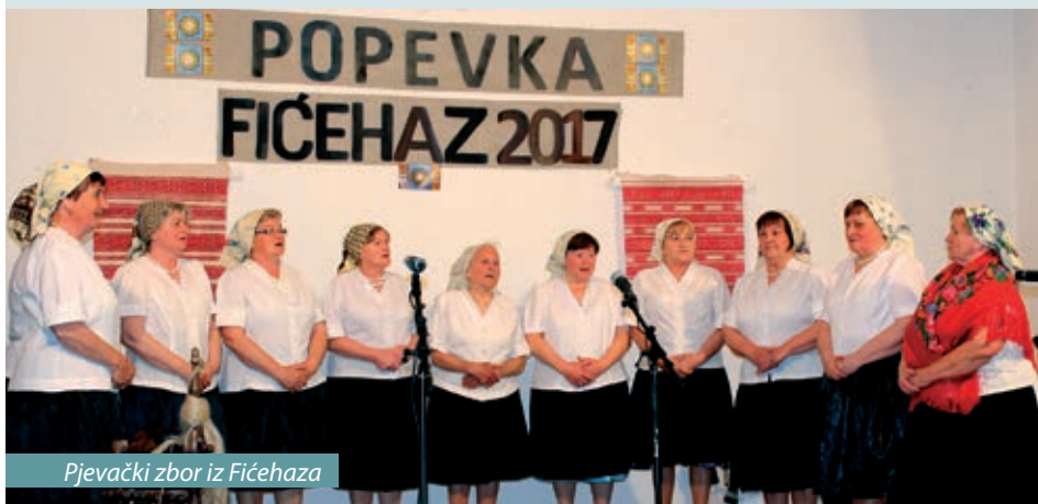
Pjevački zbor iz Fičehaza

Pošto su u Donjem Kraljevcu i Štrigovi održane predsmotre 33. Međimurske popevke, stigao je red i na Pomurje. Bila je to sedma predsmotra u pomurskoj regiji, 25. ožujka u Fičehazu, u organizaciji Društva Horvata kre Mure, KUD-a Sumarton, Udruženja hrvatskih pomurskih samouprava i nedelišćanskog KUU-a Seljačka sloga. Ovogodišnji je odaziv bio slabiji na odnosu na prošle godine, predstavilo se osam izvođača iz Fičehaza, Kerestura, Mlinaraca, Petribe, Serdahela i Sumartona. S predsmotre će biti izabrani najbolji izvođači koji će nastupiti na središnjoj smotri 10. lipnja 2017. u Nedelišču. Pomursku su priredbu i ove godine uveličali svojom nazočnošću dr. sc. Gordan Grlić Radman, veleposlanik Republike Hrvatske u Budimpešti i njegova supruga, te predstavnici raznih organizacija iz Međimurja i Pomurja.