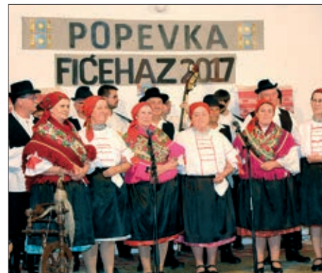
„Međimurska popevka” u Fičehazu