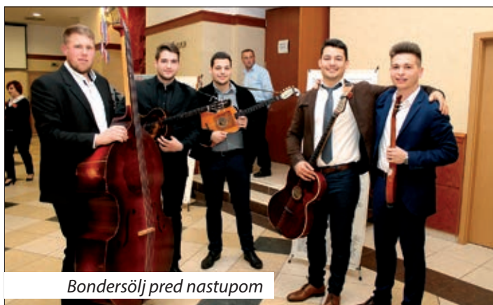
Bondersölj pred nastupom