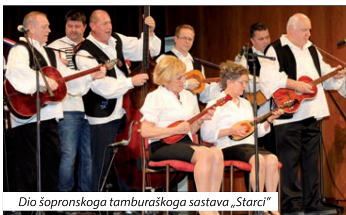
Dio šopronskoga tamburaškoga sastava „Starci“