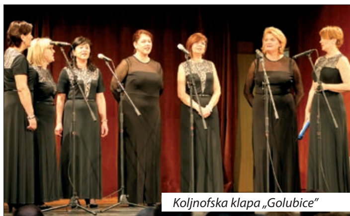
Koljnofska klapa „Golubice“