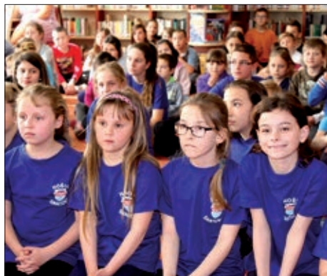
Santovo - Natjecanje u kazivanju stihova 6. stranica