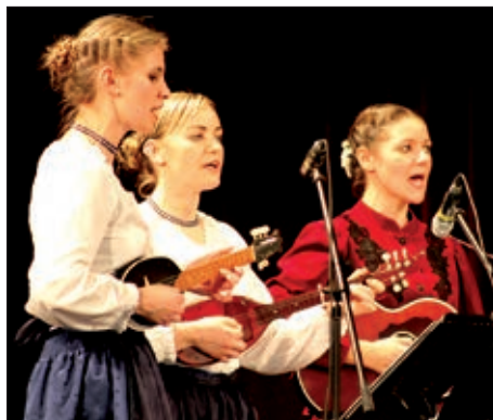
Gala program u Šopronu