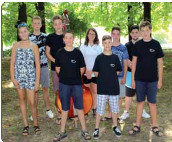
„Mladi tamburaši“ iz Mohača, među njima unuci vršendskih Hrvata Šokaca

Revija kuhanja bila je uspješna. Svi su natjecatelji priredili ukusne kotlice sarme. Treće su mjesto podijelile kuharske družine iz Olasa i Vršende, drugo mjesto je pripalo Sajki, a Kozarci su, po mišljenju ocjenjivačkog suda, skuhalo najbolju sarmu III. Šokačkog piknika.