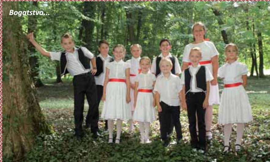
Židanska dica peldodavno čuvaju hrvatske tradicije u svojem slobodnom vrimenu