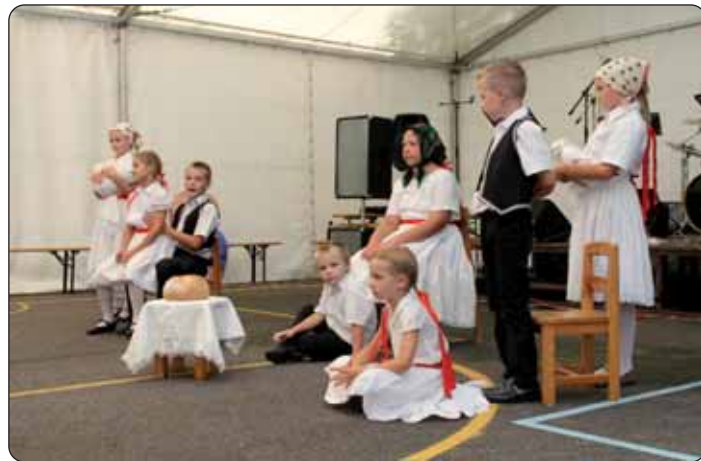
Nastup u susjednoj Prisiki

jako rado dojdou. To se nije zgodalo da nisu došli, jedino zbog betega su ostala doma, ali svaku subotu su na probi, ku imamo od 9 do 10 uri. Roditelji se jako veselu ovomu, još i ti ki su se doselili u Hrvatski Židan i još i jezik ne znadu, ali jako čuda nam pomažu zaistinu – dodala je još peljačica, i kako se je približavalo vrime nastupa, čim veća je oko nje nastala gužva. Svaki mali folkloraj je imao kakovo pitanje u jednostavnoj svečanoj nošnji za ku smo doznali: „Jako čuda smo gledali ča more biti židan-