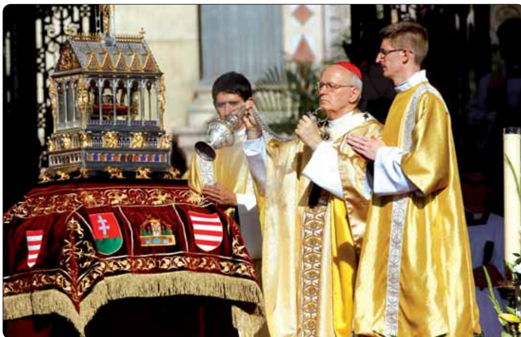
Središnje euharistijsko slavlje predvodio je ostrogonsko-budimpeštanski nadbiskup i mađarski primas kardinal Péter Erdő.

Središnje euharistijsko slavlje o svetkovini sv. Stjepana, zaštitnika Mađarske, na trgu ispred budimpeštanske bazilike, posvećenog tomu svetcu, 20. kolovoza 2016. predvodio je ostrogonsko-budimpeštanski nadbiskup i mađarski primas kardinal Péter Erdő, a propovijedao zagrebački nadbiskup kardinal Josip Bozanić.