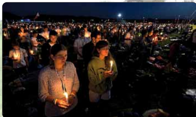
Svi zajedno na livadi