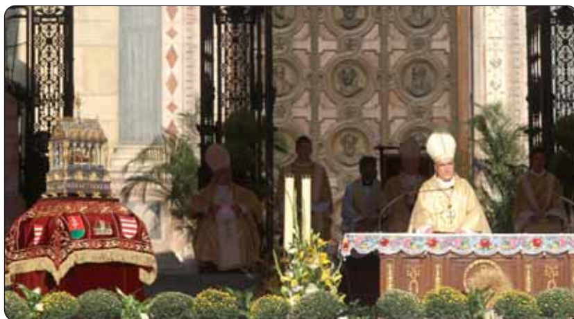
Propovijed je održao zagrebački nadbiskup kardinal Josip Bozanić.