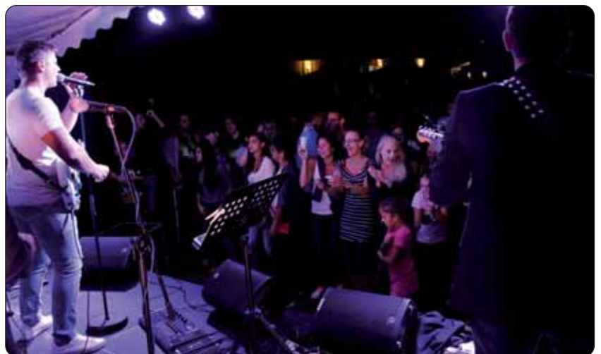
Sastav „Begini“ zabavljao je publiku do kasnih sati.