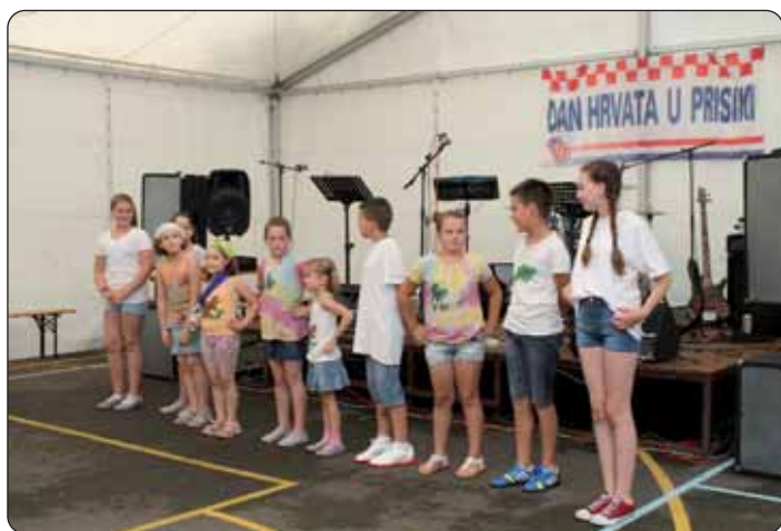
Domaća dica su se naučila u taboru po hrvatski igrati