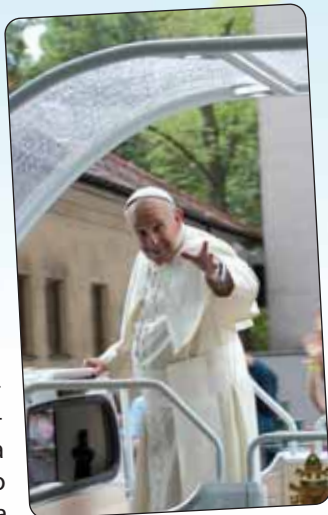
Papa Franjo izbliza

Papa Franjo na početku također je govorio o milosrđu i ulozi mladeži u današnjemu svijetu. Tada sam ga prvi put uživo čula. Bila sam vrlo iznenađena koliko ima nježan i miran glas.