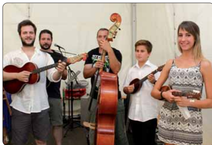
Židanski i prisički svirači