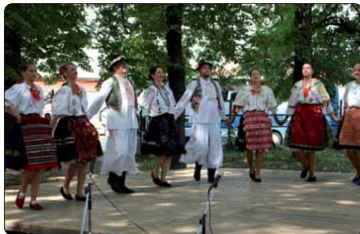
Mohački KUD Zora