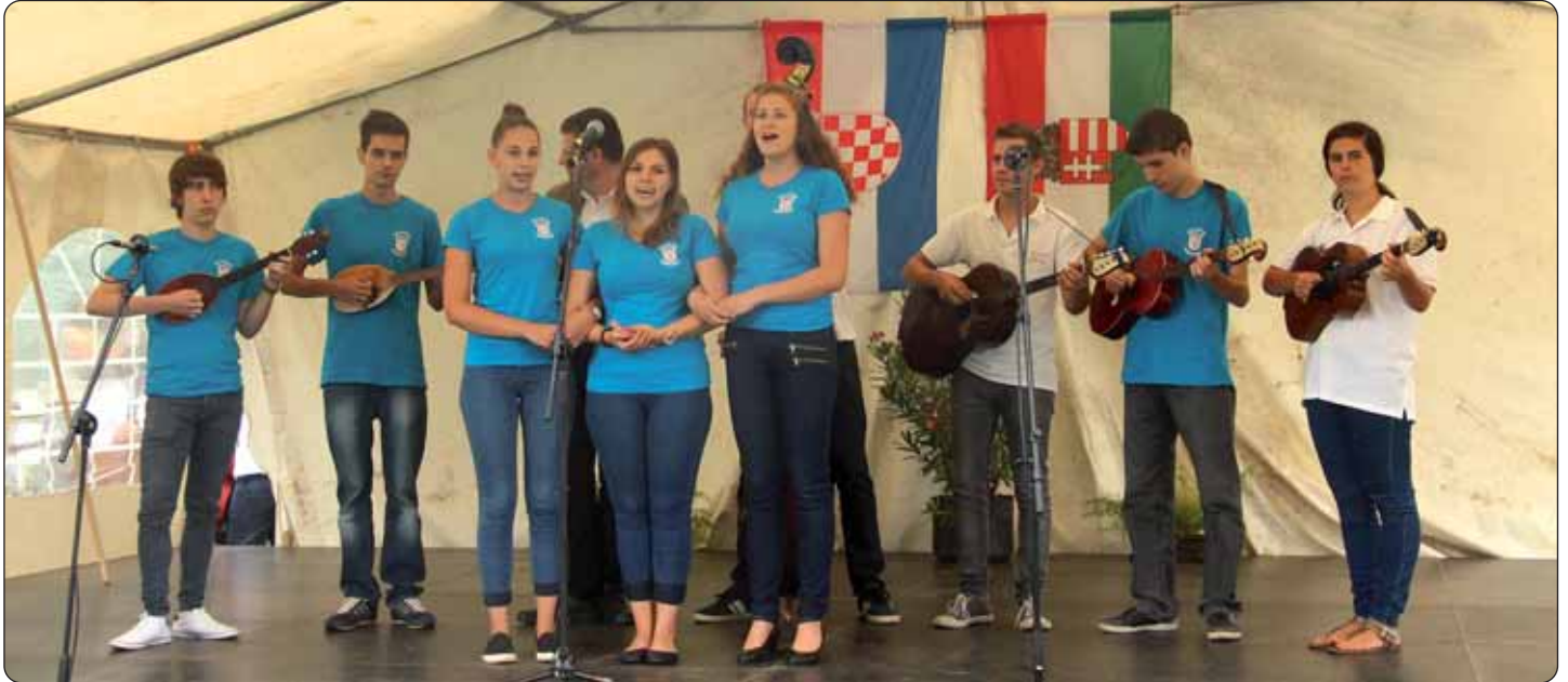
Tamburaši na brlobaškoj pozornici

U organizaciji Hrvatske državne samouprave te Hrvatskoga kulturnog i sportskog centra „Josip Gujaš Džuretin“, I. Hrvatski ljetni festival mladih ustrojen je 5. i 6. kolovoza 2016. godine kod postaje Nacionalnog parka Dunav – Drava u Brlobašu. Ova je priredba novoizmišljena organizacija koja je imala cilj okupiti hrvatsku mladež iz svake regije gdje žive Hrvati.