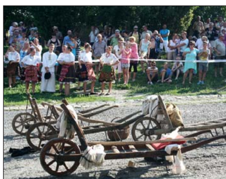
Pranje na Dunavu