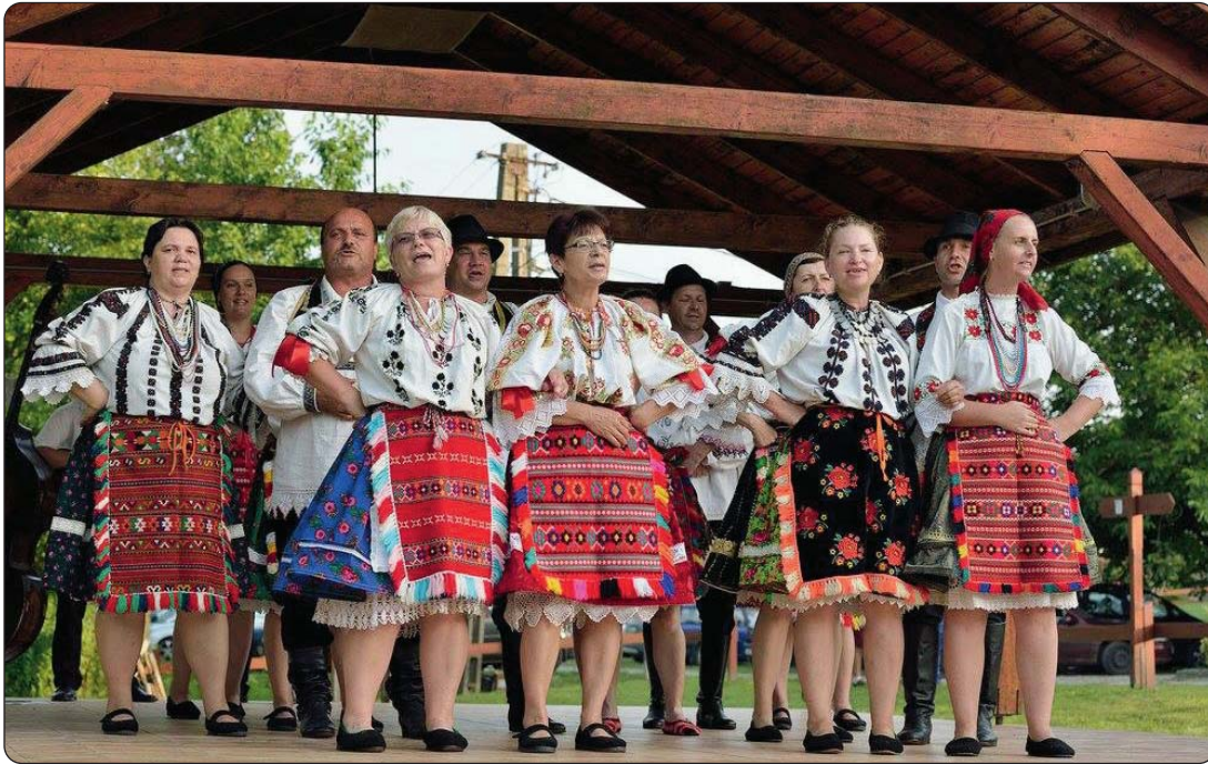
Salantski KUD Marica prvi put u Novom Selu

U organizaciji Hrvatske samouprave Novoga Sela i Hrvatske samouprave Šomođske županije, 24. srpnja u tom naselju prikazana je priredba pod naslovom Hrvatski narodnosni dan 2016.