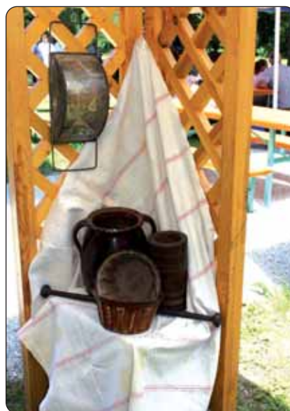
Dio s prigodne izložbe

jednica grada. U prekrasnome letinjskom parku od jutarnjih sati kuhale su družine iz Mlinaraca, Serdahela, Sumartona, Goričana, Novigrada Podravskog, te one predstavnika letinjskih civilnih udruga. Posjetitelji su mogli kušati pečene kobasice, čevapčice,