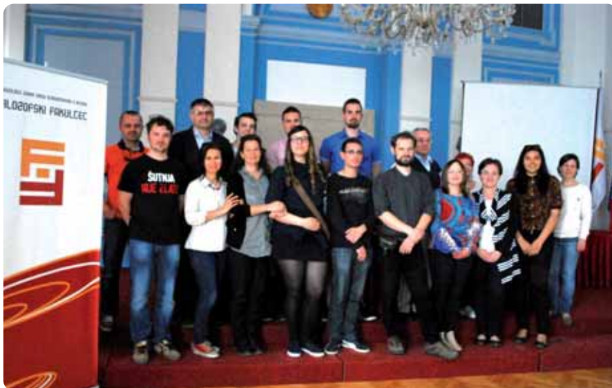
Studenti pečuške kroatistike posjetili su Filozofski fakultet Osječkoga sveučilišta.

Drugi dan ujutro krenuli smo u Vukovar, gdje smo posjetili Vučedolski arheološki muzej, koji je jedan od najmodernijih muzeja što sam ih sam ikada posjetila, organiziran je na vrlo interesantan i interaktivan način, prema tome mislim da može biti zanimljiv i iz kulturoloških, znanstvenih, ali i didaktičkih razloga. Mislim da smo svi mi – profesori i studenti istodobno – uživali u upoznavanju vučedolske kulture. Nakon muzejskog posjeta kre-