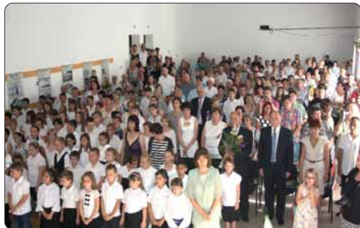
Prepuna dvorana učenika, nastavnika i roditelja

– Svi vi imate nekoliko uspomena iz prošlih dana, godina, prijetite se razreda gdje ste zajednički usvajali mnoštvo znanja ili na dvorište gdje ste se bezbrižno igrali na odmorima i popodnevnim zanimanjima gdje su se stvarala prijateljstva, ali sve su to samo mjesta. Zašto će vam ipak ostati u trajnom sjećanju? Zato što nikada niste bili sami, uvijek su bili s vama prijatelji, cijeli razred. Zbog njih i samo s njima se mogu spominjati sva ta mjesta i događaji. Jer ste zajednički dijelili uspjehe i neuspjehe, brige i radosti, jednom riječju, u svemu ste bili jedinstveni. Sad sve ovo