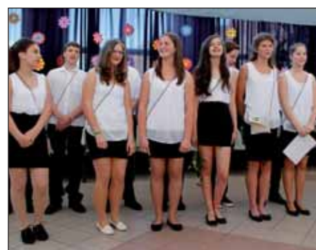
Opraštanje u Budimpešti