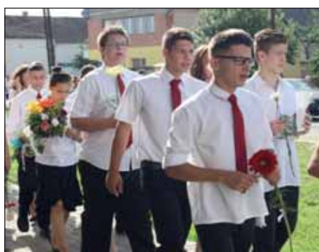
Opraštanje u Santovu