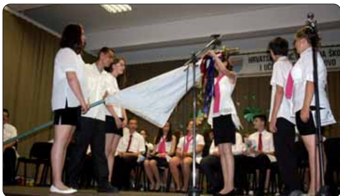
Školska je zastava predana na čuvanje učenicima sedmog razreda.

Oproštajna je svečanost uljepšana prigodnim programom, oproštajnim riječima učenika sedmog i osmog razreda, pjesmama i kazivanjem stihova na hrvatskom i mađarskom jeziku. Ispračaj osmaša i završnicu školske godine nadalje uljepšali su