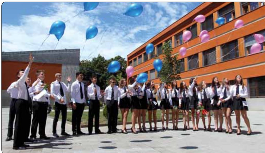
Baloni su pušteni da ih nosi vjetar.

Završila je još jedna školska godina i u Hrvatskom vrtiću, osnovnoj školi, gimnaziji i učeničkom domu Miroslava Krleže, ustanovi koju je školske godine 2015./2016. pohađalo 404 učenika. U vrtiću njih 63, u osnovnoj školi 214, a u gimnaziji 127.