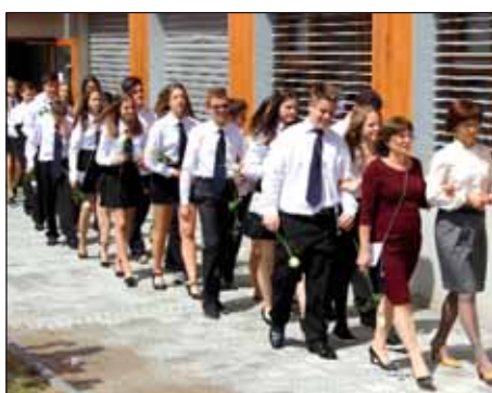
Opraštanje u Pečuhu