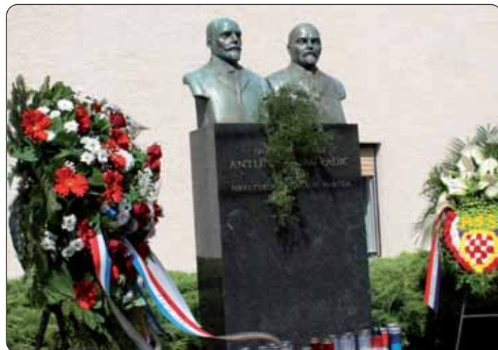
Spomenik hrvatskim velikanom, braći Antunu i Stjepanu Radiću