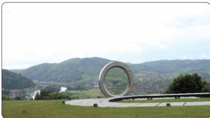
Spomen-obilježje na brdu Čukur ubijenom snimatelju Hrvatske televizije, Gordanu Ledereru

posebnim toplim tonom u glasu kot stare poznanike pred crkvom Sv. Martina. A to bi bila još jedna kopča, pokidob Sv. Martin je rođen u našem gradu Sambotelu, a u brojni naselji Hrvatske je poštovan i je zaštitnik, obrambenik crkav i mjest. Svečana sjednica, povodom Dana Sisačko-moslavačke županije je održana u Rafinerijskom domu u gradu hrvatskih pobjedov, pri koj su po prvi put mogli tamošnji zastupniki, političari i gosti u ruke zeti i prelistati i Tajednik Hrvatov u Ugarskoj, Hrvatski glasnik. Minuta šutnje je spominak pri uvodu svečane sjednice na poginule hrvatske branitelje u Domovinskom boju i na prvoga predsjednika Hrvatske, dr. Franju Tuđmana. Uz brojne svečane govore i govorača, uručene su i županijske nagrade i priznanja. Iz vinarije i atraktivnoga restorana Tušek u Gaborčini kod Popovače otvara se pogled na jedinstveni krajolik s terase u kom ne moremo dugo uživati jer godina nas tira pod krov na vrime domjenka. Uz prigodnu muziku i skupa otpjevanih dobro poznatih melodijov mi njaju se i riči med predstavniki gradišćanske delegacije i peljači