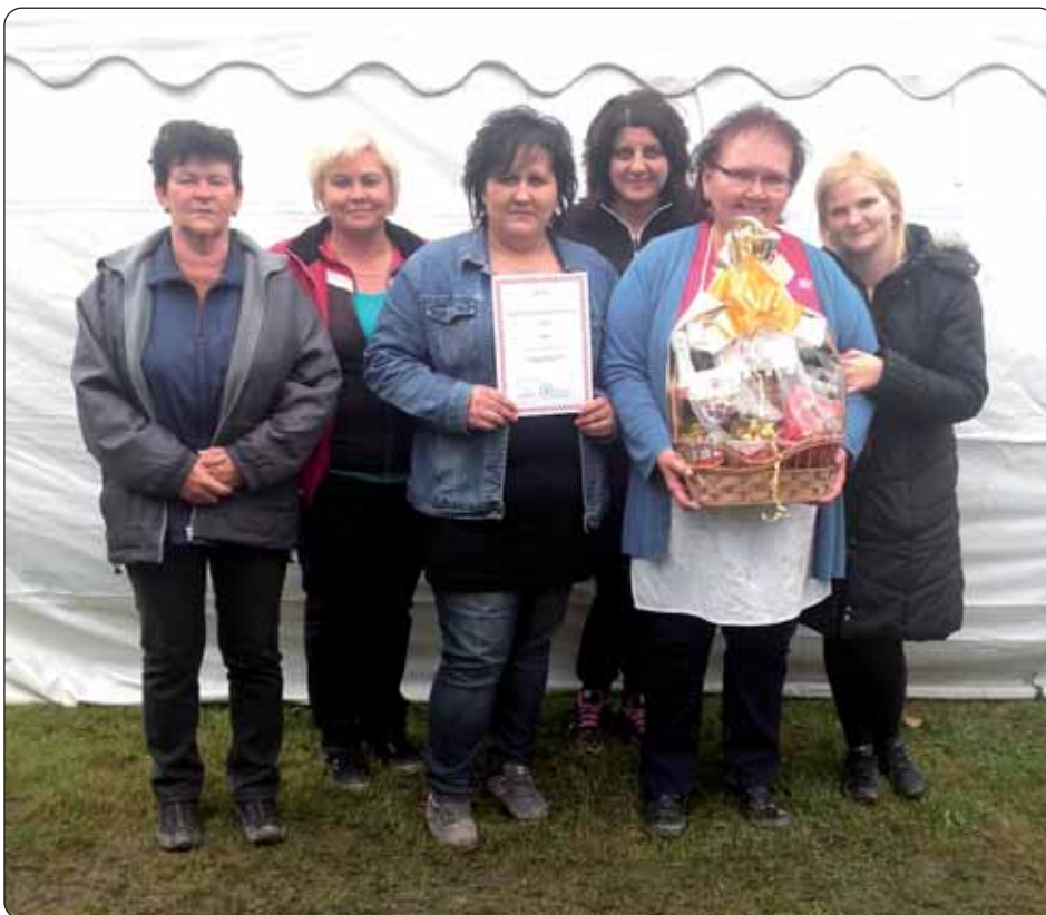
Prvo je mjesto osvojila družina „Martinčanke“.

BRLOBAŠ – U organizaciji mjesne Hrvatske samouprave, u nedjelju, 17. srpnja, priređuje se Hrvatski narodnosni susret u tome podravskom naselju. Program počinje svetom misom u 16 sati, a zatim je povorka kroza sela. Kulturni program počinje u 18 sati u kojem sudjeluju barčanski KUD Podravina, lukoviški KUD Drava, martinački Ženski pjevački zbor „Korjani“, starinski orkestar Biseri Drave, martinački Mladi tamburaši, Šeljinski tamburaši te pečuški tamburaški Orkestar Vizin. Na kraju je dana, od 20 sati plesačnica uz „Vizinovu“ i „Podravkinu“ svirku. Organizatori svakoga srdačno očekuju.