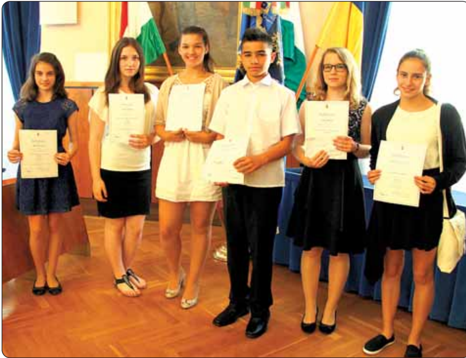
Najbolji na Državnom natjecanju osnovnoškolaca iz narodnosnoga jezika i književnosti te narodopisa školske godine 2015./16.

U Kossuthovoj dvorani Vladina ureda grada Budimpešte 8. lipnja svečano su uručene povelje i nagrade najboljim natjecateljima, prva tri mjesta po kategorijama, Državnoga natjecanja osnovnoškolaca iz narodnosnoga jezika i književnosti te narodopisa školske godine 2015./16. Povelje je preuzelo 59 učenika nadmetanja iz narečenih kategorija na grčkom, hrvatskom, njemačkom, romskom, rumunjskom, slovačkom, slovenskom i srpskom jeziku te i njihovi nastavnici.