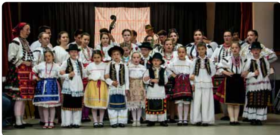
Najmlađi sudionici bala

Vrativši se u 2016., ovu „robu” sa starim vrijednostima 24. travnja predstavili su plesači KUD-a Marica i KUD-a Tanac, a posebno je bilo drago vidjeti mnoštvo mališana, dječjih skupina ovih društava, obučeni u nošnju bošnjačkih Hrvata koji su izveli dječje igre, na radost publike, posebno roditelja. Njihov veliki broj predstavlja tračak nade za hrvatsku zajednicu u Mađarskoj, koja unatoč velikim deficitima, ipak ima nadolazeće naraštaje na koje može temeljiti svoju budućnost.