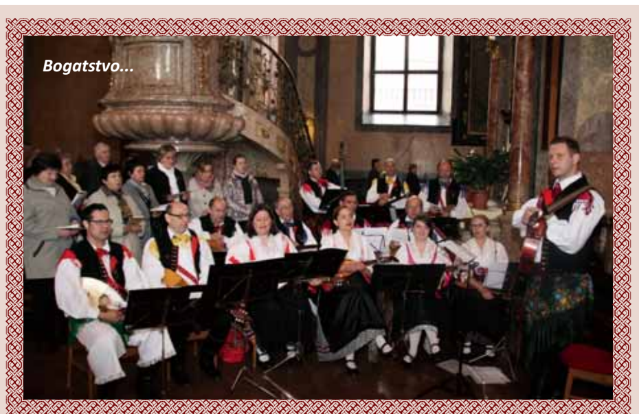
Tamburica Uzlop muzički je oblikovala mašu