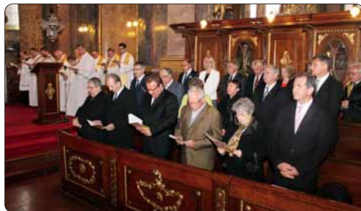
Zastupnici hrvatskoga društvenoga i političkoga žitka na svečanoj maši