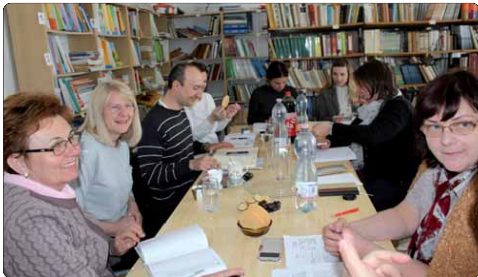
Prvi sastanak budućih partnera u projektu obrazovne suradnje

Hrvatska samouprava Zalske županije priprema prijavu europskog projekta u Interreg programu u suradnji s golskom Osnovnom školom u tematici suradnja obrazovnih ustanova. Radi pripreme projekta predstavnici Županijske samouprave sastali su se u Keresturu s izaslanstvom golske Osnovne škole te s predstavnicima Razvojne agencije Podravine i Prigorja. Usuglašavanjem zajedničkih interesa dogovoreno je da će Zalska hrvatska samouprava biti glavni korisnik projekta, naime ona već ima neka iskustva u svezi s europskim projektima, a s hrvatske će strane partner biti Osnovna škola naselja Gole.