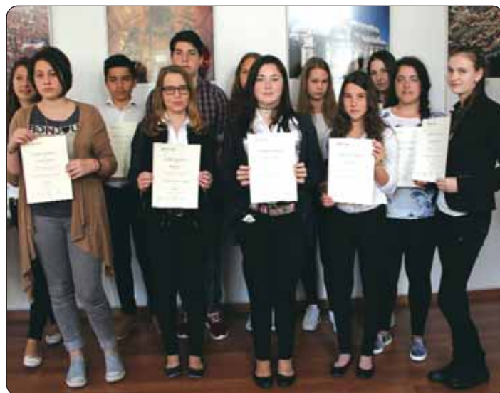
Svi sudionici završnice

„Svima vama čestitam, jer je ipak to jedno državno natjecanje, i to je finala toga državnoga natjecanja, tako da ste svi vi najbolji, svi ste vi među pobjednicima... To što smo se dosta dugo vijećali, također govori o tomu da je bilo diskusije, vezano za bodovanje, za koje bodovanje trebamo reći da je vrlo teško jasno mjeriti nečiji stil ili komunikaciju bez obzira na to da se to mora i da se trudimo. Zato vam se i nude raznoliki zadatci...“; reče uz ostalo nazočnima u ime prosudbenog odbora predsjednica Timea Bockovac. Potom je priopćila rezultate i svim natjecateljima uručila pohvalnice. Po odluci