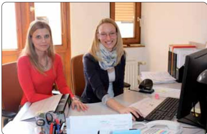
Djelatnice javnog rada za kulturu u pečuskoj podružnici ureda HDS-a

– Nedavno smo se uselili u nove prostorije, naime u Klubu je bilo već tijesno, tamo je radio i Znanstveni zavod i HDS-ov ured, i neke druge civilne udruge. Za znanstveni rad i za administrativne poslove treba mir, a djelatnicima prostor. Prošle smo godine odlučili da ćemo tražiti poseban ured, željeli smo da to bude bliže centru, jer tako je lakše dostupan. – rekao je g. Solga dok je pokazivao prostorije ureda.