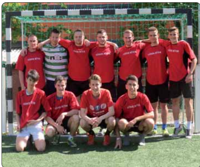
Momčad Šomođske županije (2. mjesto)