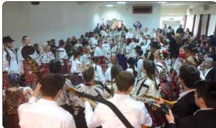
U velikom kolu

Odrasli su osim kupovanja poklona imali i druge izdatke. Obvezatno je bilo posjetiti krčmu ili restoran, popiti nešto uza živu glazbu najčešće romskih svirača. Većina je muškaraca zatim otišla na nogometno igralište, paju , gdje je održana utakmica između domaće i gostujuće momčadi. Povoljan ili nepovoljan rezultat se odražavao na kasniji tijek dana, premda su ugostitelji mogli biti zadovoljni i nakon pobjede i poraza domaće momčadi. Obvezatan je događaj ovog dana bio i bal koji se u zadnjih nekoliko desetljeća također temeljito promijenio. Bal je bio završna zabava proštenja, koje je nekada trajalo i više dana. Kako piše i enciklopedija Leksi-