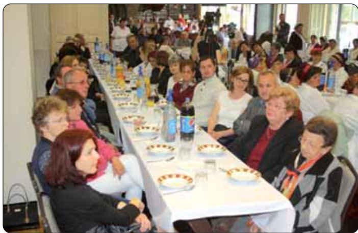
Za zajedničkim stolom

Kako je naglašeno prigodom prvog okupljanja, cilj je susreta podunavskih Hrvata Raca da dade mogućnost amaterskim folklornim ansamblima, plesnim skupinama i pjevačkim zborovima da se predstave te u okviru nevezanog razgovora vježbaju svoj hrvatski materinski jezik, a sa željom da to ubuduće postane tradicijom, svake godine u drugome rackohrvatskome naselju, te da na taj način sve bolje upoznaju jedni druge.