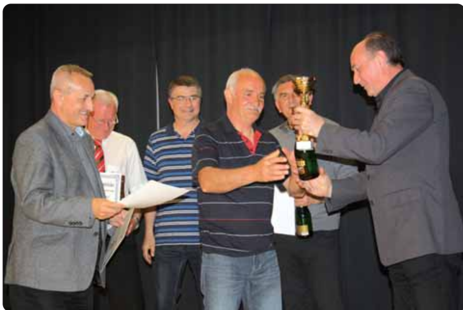
Nagrađeni su sudionici malonogometnog turnira.

U ranim popodnevним satima program je počeo misnim slavljen na hrvatskom jeziku koje je predvodio prečasni Imre Polyák, santovački župnik i biskupski vikar Kalačke nadbiskupije za narodnosti, a svojim pjevanjem uljepšali su santovački crkveni pjevački zbor i kantor-orguljaš Zsolt Sirok. Uz pjesmu, misa je uljepšana i narodnom nošnjom sudionika.