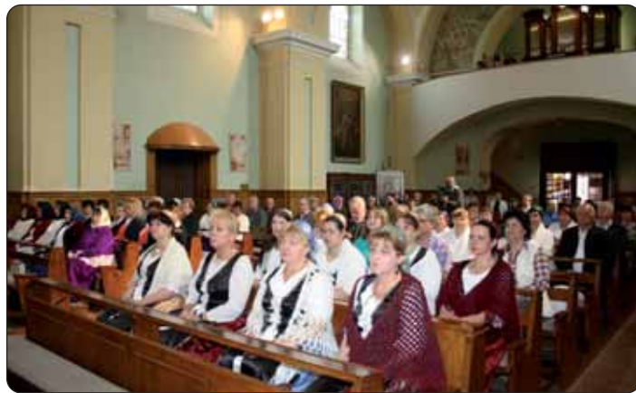
Na svetoj misi u crkvi prepunoj vjernika