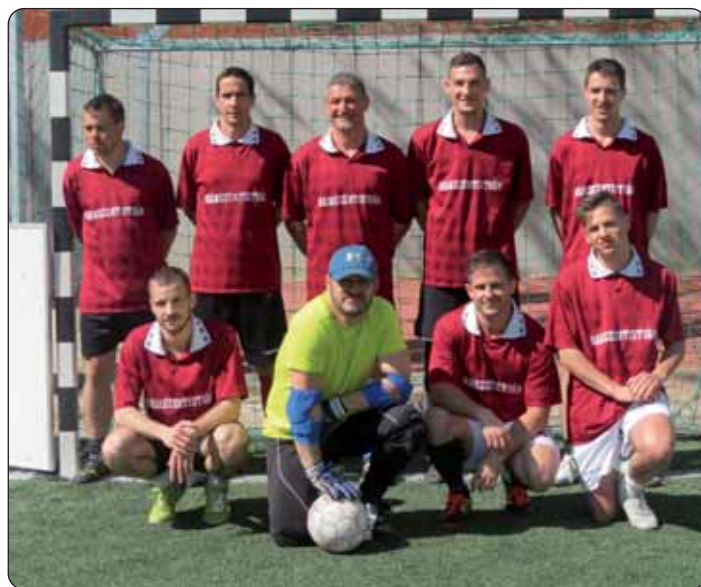
Momčad iz Bačke (3. mjesto)