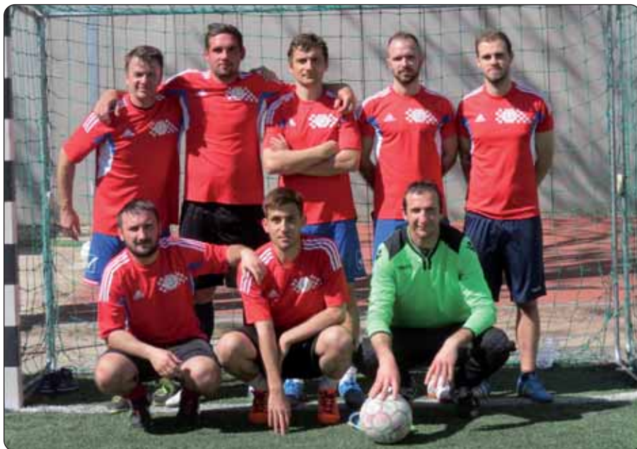
Momčad Baranjske županije (1. mjesto)