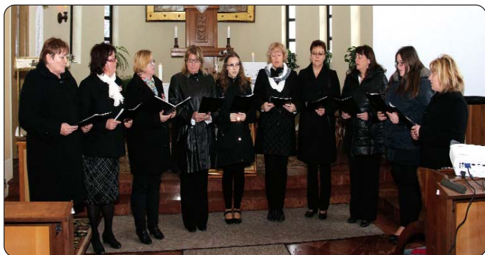
Pjevački zbor iz Pogana

U suorganizaciji Seoske i Hrvatske samouprave, u jubilarnoj Godini Božjeg milosrđa i Godini svetog Martina, a uz 1700 godina rođenja toga svetca, u poganskoj crkvi posvećenoj međugorskoj Kraljici Mira 12. ožujka priređena je svečanost posvete moći svetoga Martina i susret crkvenih zborova. Samboteljska biskupija s nizom programa slavi Godinu svetoga Martina, a jedne od moći svetog Martina 12. ožujka dospjele su iz Sambotela u Pogan.