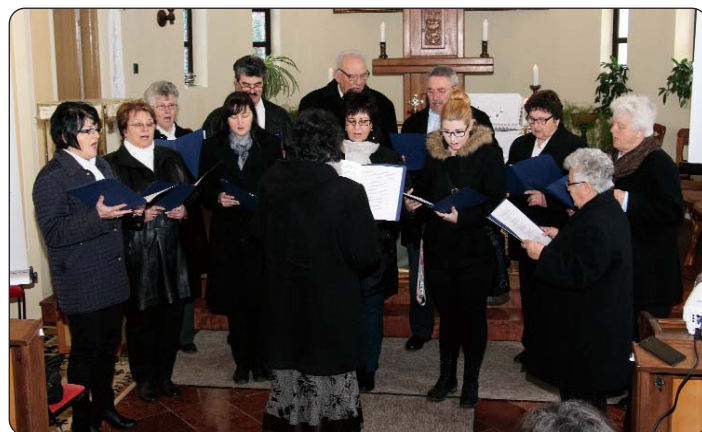
Pjevački zbor iz Harkanja

koji su bili izloženi velikoj hladnoći. Sv. Martin prvi je svetac koji nije bio mučenik te je prvi zapadnoeuropski redovnik koji se proslavio i svojom iznimnom osobnošću i svojom vinogradarskom vještinom, a zaštitnik je Francuske, templara, vinara, vinogradara,