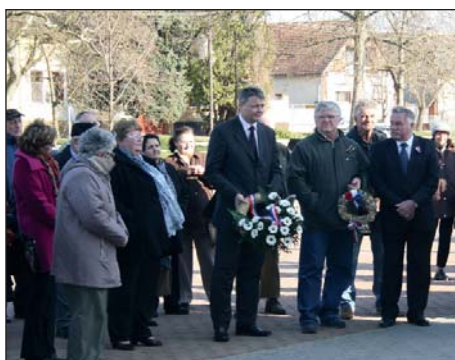
Književna tribina u Gari