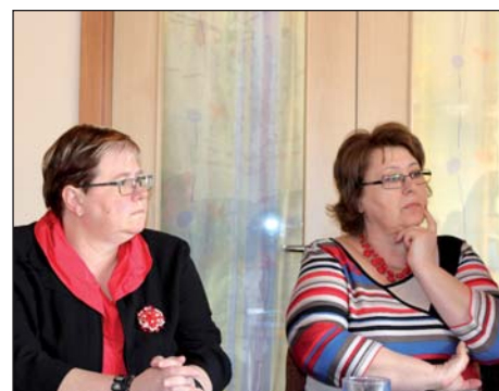
Forum o školstvu