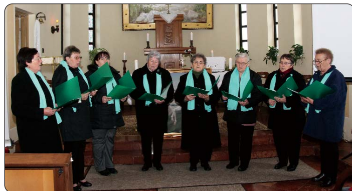
Pjevački zbor iz Vršende