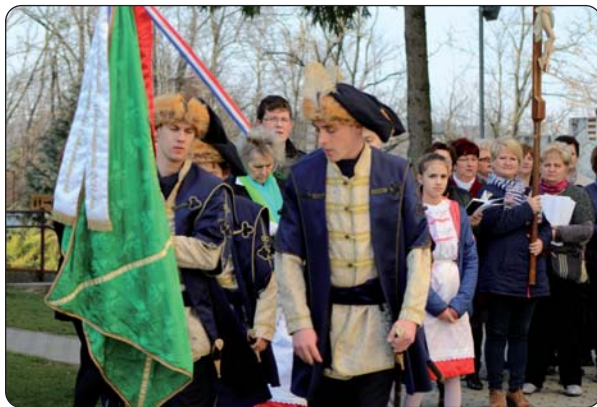
Križni su put predvodili Zrinski kadeti i keresturska djeca.

Križni je put pobožnost na spomen Isusove muke, od trenutka kada Isusa osuđuju na smrt do polaganja Isusova tijela u grob. U Komaru od prve do zadnje postaje molili su se pomurski vjernici s pomoću Imrea Szűcsa, župnika kaniške crkve Srca Isusova, i mnogih pripadnika hrvatske zajednice, koji su čitali molitve kod svake postaje iz molitvenika „Ruža nebesa“. Članovi Povijesne postrojbe Zrinskih kadeta i učenici keresturske Osnovne škole Nikole Zrinskog u narodnoj nošnji predvodili su hodočasnike. Neki od vjernika krenuli su već u 13 sati od križanja glavne ceste za Jegersek i pješčili 5 – 6 kilometara s križem sve do svetišta, podno