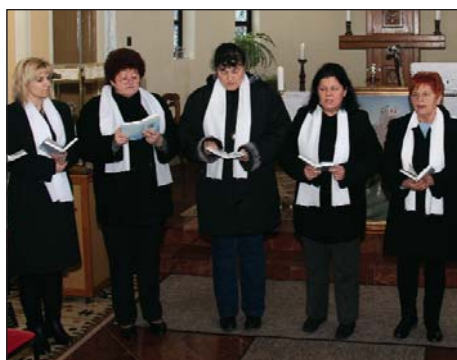
Sv. Martin, zaštitnik sela Pogana 7. stranica