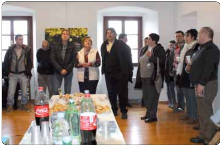
U grobničkom kaštelu s predstavnicima Čakavske katedre

Kad človik ljeta dugo obećuje sebi i prijateljem da će konačno doći na karneval u Rijeku, koji je poznat po tom da sve je u njemu toliko gigantično, početo od broja ljudi do mjere maškarantov i figurov ke se vliču na kamioni, s toliko idejov, toliko raspoložen