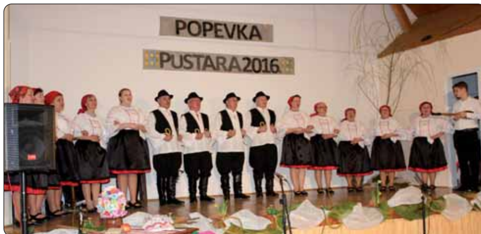
Pjevačka skupina iz Serdahela

predsmotri želeći i svojom nazočnošću poduprijeti izrazito fantastičnu zamisao u svezi s organiziranjem predsmotre s jedne i druge strane granice, te središnje smotre u matičnoj domovini. Dodao je: „...ono što pripada zajedno, mora i zajedno rasti”, tradicionalne su vrijednosti uvijek najvažnije, te se obratio pomurskim Hrvatima da odgajaju svoju djecu tako da budu ponosni na ono što su stvorili njihovi djedovi, a