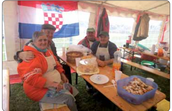
U hrvatskom šatoru

U subotu, 13. veljače, u ranim jutarnjim satima u Daranju se okupilo društvo da sudjeluje u djelatnosti koja se sve rjeđe viđa, ali je u prošlosti imala velik utjecaj u životu seoskih ljudi. Podravsko kolinje u Daranj je privuklo mnogo posjetitelja, ali i sudionika. Festival je počeo svinjokoljem, a od 8.30 čekali su se gosti s tzv. krvavim doručkom. Zainteresirani koji su tamo počeli dan već od početka su mogli osjećati miris čvaraka, pečenice, kobasica i drugih svinjokoljskih specijaliteta, a tko je htio, mogao je sve to i kušati uz razne rakije i kuhana vina. U 11 sati počelo je predstavljanje svih družina. Na ovogodišnjem natjecanju sudjelovalo je 15 družina, među njima zastupnici kapošvarske, daranjske i izvarske Hrvatske samouprave. Hrvatska skupna družina, pod nazivom Podravci sastojala se od predsjednika i zastupnika podravnih hrvatskih samouprava, iz Potonje, Brlobaša, Dombola, Novoga Sela, Martinaca itd. Na priredbi se natjecalo u izradbi svinjokoljskih specijaliteta, i to u raznim kategorijama, od sarme, koba-