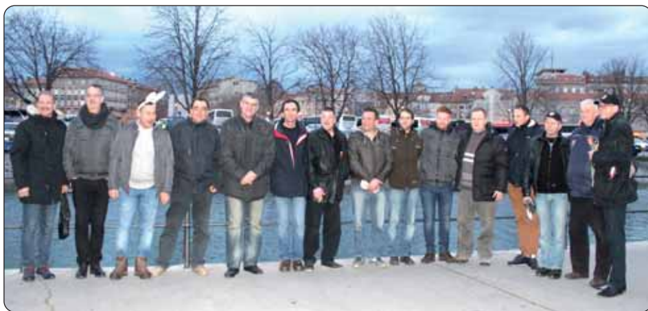
Koljnofski muški krug s prijatelji iz Rijeke