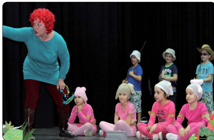
Učenici 2. razreda u glumi gljiste i ribiča

LETINJA – Hrvatska zajednica toga grada 4. veljače održat će tradicionalni običaj „Lekovnog četrtka“ na Julijanskoj gori. Ženski članovi obući će prikladnu odjeću, pripremiti kolače i ukusna jela te se skupa veseliti uz dobru kapljicu.