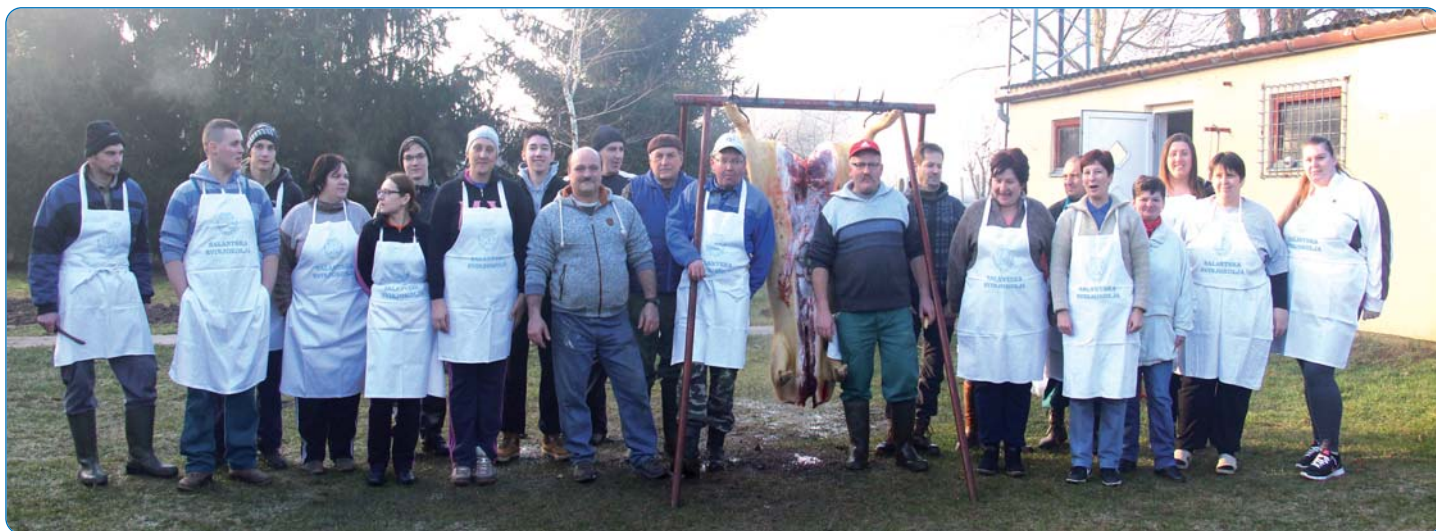
Vrijedna družina, uz brojne pomagače, radila je cijeli dan.