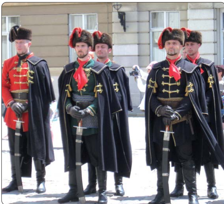
Smjena straže. Vojnici ispriopovijedaju priču o kravati.

znatih ličnosti, kod kule Lotrščak doživljavamo duh banice Manduše. Za vrijeme obilaska susrećemo još Neru i Sinišu iz Zagorkinih romana, ali i Petricu Kerempuha i njegovu glumačku družinu koja nam kroz predstavu priča priču o seljačkoj buni i Matiji Gupcu. Tu su još i našigač i noćobdija, pokoja prava vještica kao i razni drugi likovi i događaji iz udžbenika i romana, isprepleteni u zavodljivu i tajanstvenu priču o Gornjem gradu. Budući da ovoga puta većinu publike sačinjavaju strani novinari, specijalno za njih/nas ove večeri predstava ide na engleskom jeziku. Ali se neki znameniti Krležini stihovi neizostavno kazuju i na hrvatskome. Tako i čuveni Krležini redci iz Balade Petrice Kerempuha: