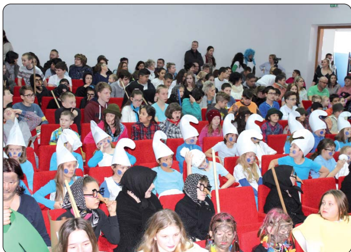
Dom kulture napunjen maškarama

Dječja pokladna povorka krenula je u 13 sati po seoskim uli-