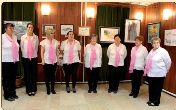
Ženski pjevački zbor Augusta Šenoae

U Galeriji Hrvatskoga kluba Augusta Šenoae 29. siječnja otvorena je izložba Likovne kolonije „Šarlota Lavanda“ pod nazivom „Luka“. Kolonija se već desetak godina održava u srednjoj Dalmaciji, u