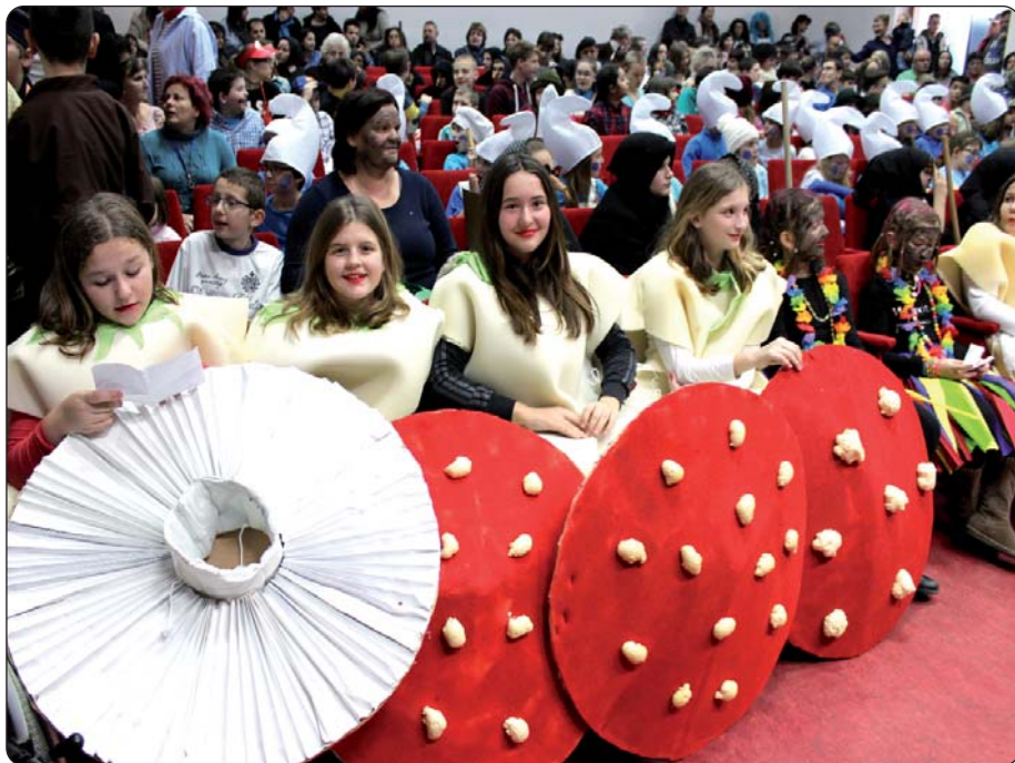
Muhare iz Hrvatske nagrađene su posjetom bazenu.

Štrumfovići, kukci, leptiri, ribiči, vještice, gljive, plesačice i razne zvijeri „preplavili“ su keresturske ulice 29. siječnja na III. Dječjem fašniku. Za organizaciju se pobrinula mjesna Hrvatska samouprava i Osnovna škola Nikole Zrinskog te razne udruge mjesta. Sudjelovalo je umalo 180 djece, obučenih u razne krinke, maske.