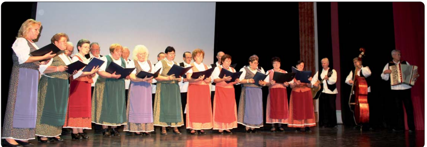
Pjevački zbor „Most-duga“