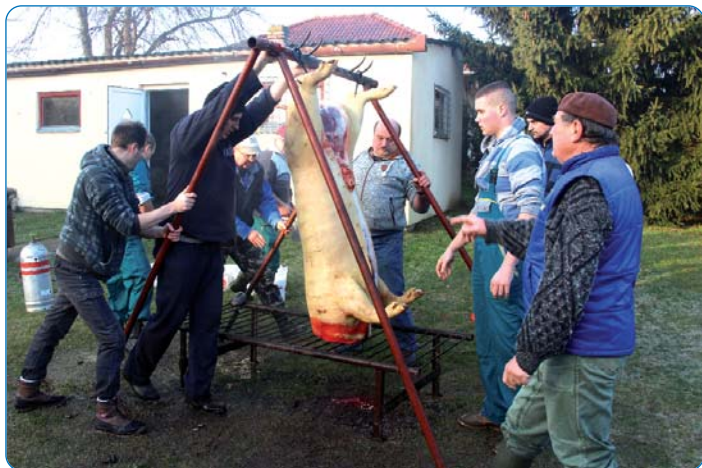
Svinju je KUD-u Marica poklonila salantska zadruga (Szalántai Zrt.).

U organizaciji salantskoga KUD-a Marica, 30. siječnja, treću godinu zaredom, održana je cjelodnevna i večernja priredba pod nazivom III. Salantska svinjokolja, u tamošnjem domu kulture. Već u ranim jutarnjim satima počele su pripreme za kolinje. Znatiželjnici su od šest sati preko cijelog dana mogli pratiti trenutke svinjokolje i sve ono što prati taj događaj koji je nekada obilježavao život na selu. Danas je sve manje kolinja kod kuća. Ovo salantsko okupilo nas je oko tradicijskog kolinja i kolinjskih jela, druženja i zabave na dobrobit KUD-a Marica.