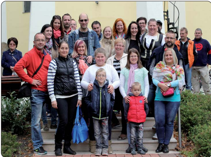
Dio sudionika kod tukuljske crkve

Na nesvakidašnju šetnju povela je svoje goste tukuljska Hrvatska samouprava 12. rujna 2015., u okviru koje posjećeni su sakralni spomenici, Zavičajna kuća i pojedine zgrade, trгови koji su od velikoga značenja bili i jesu u životu tukuljskih Hrvata. Pri organiziranju toga dana Samoupravi se pridružilo društvo Balkan Calling, koje pripadnike većinskoga naroda želi upoznati kulturu pojedinih narodnosti u Mađarskoj, posebice onih koji su se doselili s balkanskoga područja.