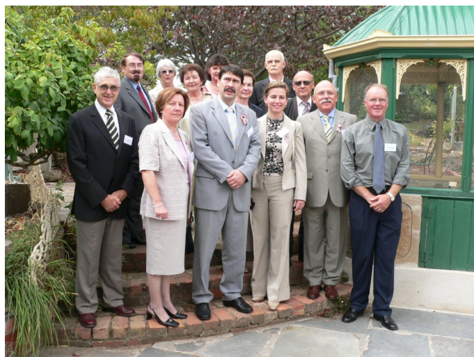
A Castlemaine-i „Budán”