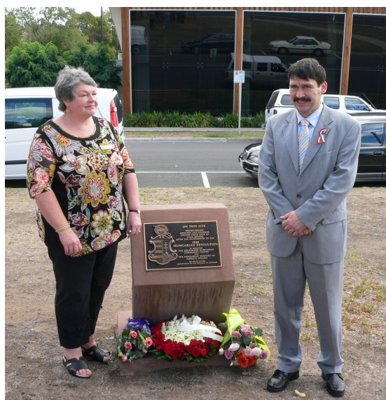
Áder János a bendigoi polgármesterrel