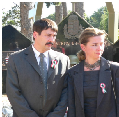
dr Áder János és felesége Anita

Kedves olvasóink! A Híradó ingyenes, de adományokat köszönettel fogadunk.