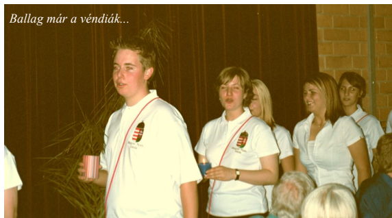
Ballag már a vendiák...