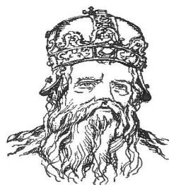
Szent István király.