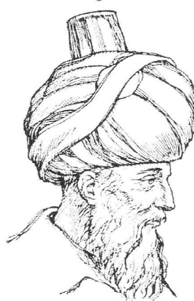
II. Szulejmán szultán.

Szép derült nyári reggelen a harcot türelmetlenül váró magyar had csatarendbe állíttatott. Báthory István a sánta nádor, az egész seregben körülvezette a királyt. „Ime itt van a király ő fölsége közöttünk, kész meghalni a hazáért, Krisztus sz. vallásáért, hitveseitekért, gyermekeitekért. Emlékezzetek meg tehát ti is, hogy magyarok vagytok, utódai azon hősöknek, kik annyiszor fényes diadalt nyertek az ellenség. Kezetekben van nemcsak hazátoknak, hanem az egész kereszténységnek is sorsa.” A magyar vezérek nagy hibát követtek el, hogy a sereggel szemközt a délnyugati határon elnyúló dombokat el nem foglalták. Itt jelent meg Szulejman d.u. 3 órakor, s kezeit égfelé emelve imádkozott: „Istenem nálad az erő és hatalom, a védelem és segély! Segítsd meg Mahomed hû népét!” Vitézei lovaikról leszállván, homlokaikkal a földet érintették. A janicsároktól környezett szultán a 3-dik harcsorban foglalt helyet, előttük 400 összeláncolt ágyú. Balibeg basa 50,000 lovassal a magyar sereg jobb szárnya megkerülésére küldetett. A kürtök megriadásakor Lajos király harcsisakot tétette fejére, miközben mint vilámfergeteg rohant a törökökre, kiknek sorai két felé nyíltak, s e pillanatban 400