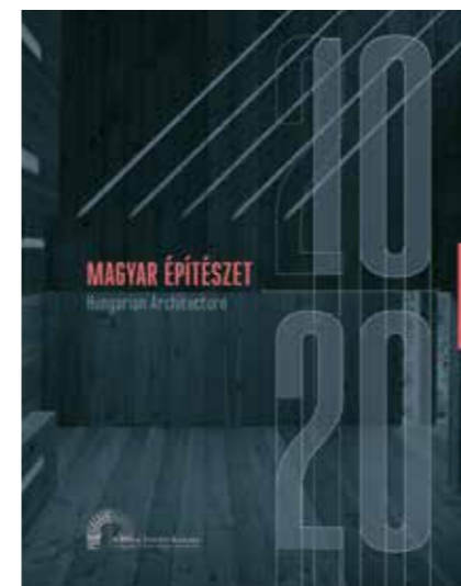
Magyar Építészeti Művészet 10–20

A kétszázéves hiánypótló sorozat nyitódarabja egy évtizedet felölelve, valamennyi épülettípusra kiterjedően igyekszik átfogó képet adni – határon innen és túl – a kortárs magyar építészeti alkotásokról és