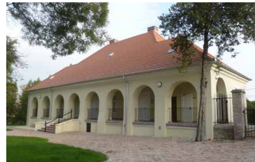
▲ Felújítás előtt és után, Nemes-kúria, 2013