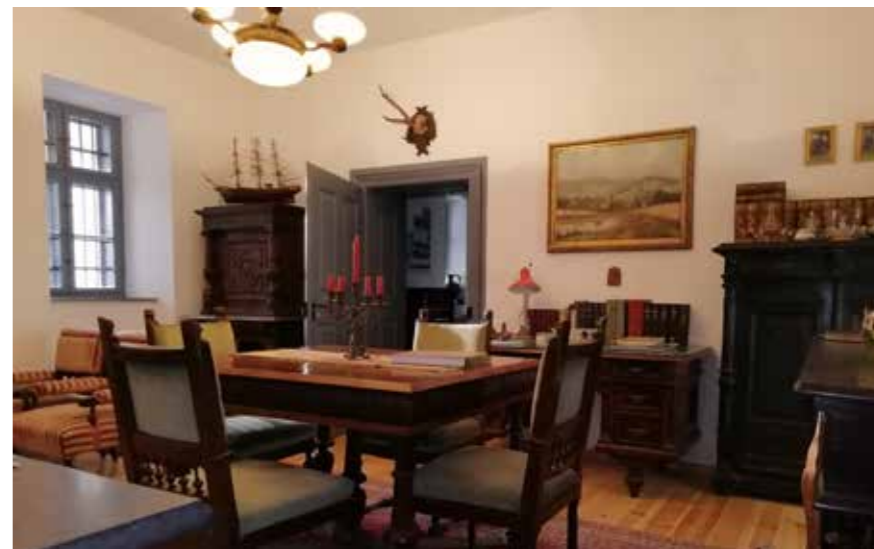
▲ A felújított belső tér. Gombay-Dinnyés-kúria, 2014

Úgy látjuk, hogy a mai építésztársadalom nagy része az elmúlt néhány évtized, illetve a kortárs építészet épületeit értékesebbnek tekinti, mint a 19. vagy a 20. század első felében épült építészeti értékeket. Ez számunkra értelmetlen, hiszen egy korábbi korszakban épült épületen az iparművészet is képviselteti magát, minden egyes elemében értéket képvisel. A Budavári Vilamos Teherelosztó épülete egy vérző seb a Várnegyedben. Az alapvető gond, hogy abba a történelmi környezetbe, településképebe nem illett bele. Ez ilyen egyszerű. Emiatt fölöslegesnek tartjuk a szóban forgó épület részleteinek tárgyalgatását. Bontandónak tekintettük. Ha belegondolunk vidéki nagyvárosaink központjaiba, szinte nem találunk olyan városmagot, ahová a szocializmusban nem építettek volna a környezetre érzéketlen épületeket, örökre megsebezve az adott történelmi városmagot. A régmúlt épületei olyan arányrendszert, építészeti tagozatokat alkalmaztak, amelyek örök érvényűek, hiszen az építészet alapjait reprezentálják. Sajnos ma öt-tíz évig divatosnak tekinthető épületek létesülnek, értéktöbblet nélkül. Fenntarthatatlanok és cserélendő épületeknek tekinthetők. Sok esetben a minőség nyomokban sem fedezhető fel sem