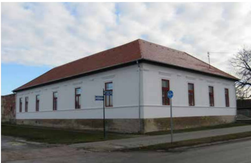
▲ Halász Béni polgári ház a felújítás után, 2019

A Halász Béni polgári ház esetében visszaállítottuk a tornácot, rekonstruáltuk a homlokzati vakolatdíszeket, valamint újragyártottuk a nyílászárókat. Minta alapján a rézkilincsek is le lettek öntve. Mindkét esetben jó volt a tulajdonos szemlélete, partnerként kezelt minket, és volt elegendő pénz arra, hogy mindez megvalósulhasson. Volt olyan helyreállított épület (Múltidéző lakópont), aminek a felújítása során azt mondogatták a helyiek, miért nem bontjuk inkább le. Amikor elkészült, a vezetőséghez számtalan