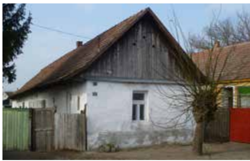
▲ ► Felújítás előtt és után, Bannárik-ház, 2020

ban álló épületet le szeretnénk védeni, a tél közepén napok alatt lebontatta. Ez a történet lesújtott minket. Ezután a település polgármesterével leültünk tárgyalni arról, hogy ilyen a jövőben ne következessen be. Ennek eredményeképpen az FME együttműködést kötött Dabas Város Önkormányzatával. Az elsődlegesen kitűzött cél az építészeti értékleltár készítése és a helyi védelem alá helyezések elindítása volt. Megállapodtunk abban is, hogy a település egyedülálló építészeti örökségét, azaz a dabasi kúriákat makettek formájában láthatóvá fogjuk tenni. A helyi védelem alá helyezések elindultak, és kezdeményezésünkre mára már a helyi védett értékek száma meghaladja a százat. Jelenleg is dolgozunk azon, hogy további épületek is védelmet kaphassanak. A dabasi örökségvédelmi lépéseket az önkormányzat a kezdeményezésünkre Halász-program néven iktatta. A program tartalmazza a műemlékek (kúriák, templomok) és a helyi védettségű értékek (polgári házak, parasztházak) folyamatos és szakszerű felújítását.