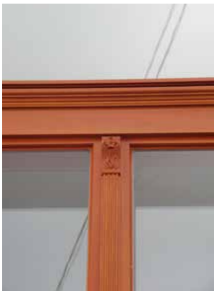
▲ ▼ Homlokzati nyílászárók részleteképzése