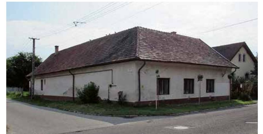
▲ ▼ Egykori iskolaépület a felújítás előtt és után, Dabas, 2021

Nem csupán népi épületekkel, hanem polgári házakkal, kastélyokkal, kúriákkal is foglalkozunk. Fontos leszögezni, hogy a magyar kultúra elsősorban a népi építészetben gyökerezik. Évtizedekig elhanyagolt területről beszélünk, számtalan paraszti, vidéki porta vagy ház nincs felmérve, levédve. A vidéki nagygazda- és polgári házak többsége rossz állapotban, elhanyagoltan áll a településeken, miközben legszebb, legértékesebb épületeink közé tartoznak. Sajnos szakmai szempontból is elhanyagolt területről beszélünk. 2020-ban ezért elhatároztuk, hogy igyekszünk ezen a területen is tevékenykedni. Ellátogattunk Mezőberénybe, Jánosalmára és Kunszentmártonba, jelenleg pedig védelmi csomagokon dolgozunk mindhárom település számára. Persze egy épület védelem alá helyezése nem feltétlenül jelenti a megmenekülését, hiszen a megfelelő tulajdonosi és önkormányzati szemlélet, valamint szakmaiság és jelentős anyagi forrás is szükséges hozzá. Op-