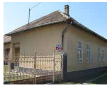
▲ ▼ Felújítás előtt és után, Zöld ház, 2020

Az örökségvédelem legnagyobb kihívása a megfelelő szakember felkutatása. Ma már nehéz feladat egy olyan asztalost találni, aki váztaablázatos kontra profilos ajtót, gerébtokos ablakot el tud készíteni, rögzíteni tud egy bevesőpántot. A hagyományos munkák korunk tömegtermékei miatt háttérbe szorultak. Ami régen általános volt, az mára már luxuscikk lett. Ma egy nádtetőt vagy korhűen készült faablakot csak gazdag ember engedhet meg magának. Ezért látjuk országszerte, hogy a palló- vagy gerébtokos ablakokat felváltja a silány minőségű műanyag nyílászáró, amihez a lakosság néhány tízezer forintért hozzájut. Gondoljunk bele, hogy egy ma épülő háznál már nem használnak habarcsot. A téglát ragasztják, kívülről történik a hőszigetelés, belül gipszkarton. Vajon ki fog vakolni tíz év múlva? Nagy a gond, hiszen egy régi épület felújítása odafigyelést és szaktudást igényel. Elődeink tudása már feledésbe merült. Az építészet jelenleg hullámvölgyben van. Hiszek abban, hogy korunk igényte-