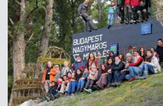
▲ Csoportkép a kész alkotások előtt

hiszen a tájak a természet és az ember együttműködéséből születnek, folyamatosan alakulnak. A születés és az elmúlás egybefoglaltatik. Sokszor hívnak telefonon, hogy eltűnt egy általunk megépített fürdő. Azok a történetek azonban nem múltak el nyomtalanul, amelyeket a kalákában részt vevők átéltek. A kalákások életútját követve azt látom, hogy a tapasztalataikat magukkal viszik a saját életvitelükbe, életfelfogásukba. A kaláka kialakulása legalább annyira kapcsolódik a Kós Károly Egyesüléshez, mint a mi szakmai ambícióinkhoz, hiszen egy térségfejlesztési munkából indult. Bebizonyosodott számomra, hogy hiába készültünk térségekre tanulmányokat, arculati terveket, csak az érvényesül a tájban, ami az ott élő közösség tudatába is beépül. Ezt a látom a táj, a természeti örökség egyetlen lehetséges útjának, mely folyamat sok esetben, és a mai sikerorientált világban nehezen felfogható, lassú folyamat. Az Ertsey Attila által felvázolt jelen- és jövőkép is ezt támasztja alá. Mégis azt gondolom, hogy ha beszélhetünk paradigmaváltásról, akkor ezeken a kalákákon ez megtörténik. A kalákában részt vevő tájépítésszek, építészhallgatók, vándorok segítségével és