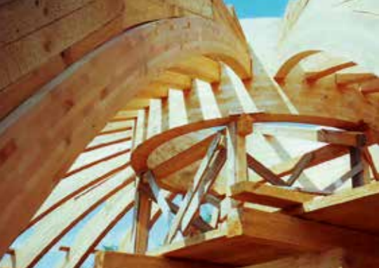
▲ Opeion, görögkatolikus templom, Csenger