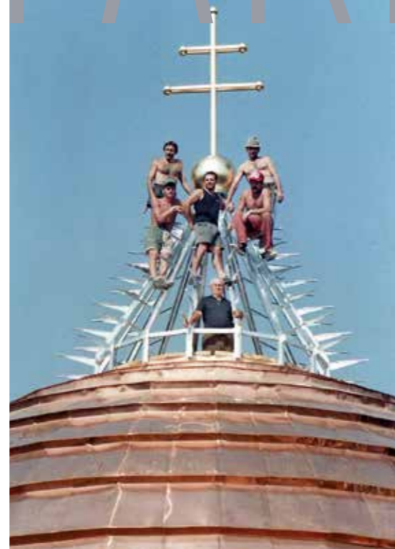
▲ A csengeri görögkatolikus templom töviskoszorús tetőbevilágítóján Szabó László bácsi gondnok és az ácsok