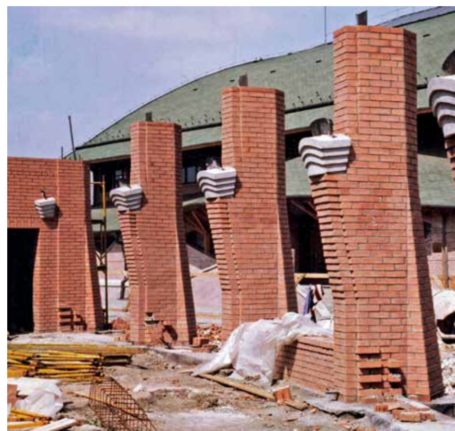
▲ A csengeri közétkezdő épületének pillérei

Megismert, és amikor a csengeri munkákról kezdett mesélni, maga mellé hívott a pulpitusra. „Folytasd, fiacskám – mondta –, te ezt jobban ismered, mint én.” Megszólított és lehetőséget adott, mert így nevelt és emelt ő mindannyiunkat. Elmeséltem néhány építés közben megélt élményt. Azt, ahogyan megtanultunk gondolkodni, a sikereket és kudarcokat átélve érett személyiségekké váltunk. Arról is beszéltem, mennyi mindenre képes egy jól összekovácsolódott csapat. Ezek a házak nem összehordott építőanyagok halmazai, hanem születnek, a gondolat erejétől jönnek a világra. Persze kell hozzá cement, téglák és fa, valamint a gépek ereje, a mesteremberek szaktudása, pénz, de legfőképpen a termékenyítő gondolat. Makovecz ezt így fogalmazta meg: „...kézzelfoghatóvá vált, hogy a szellem építi az anyagot, és nem megfordítva. A szellemet nem pótolhatja sem a pénz, sem történelem. Ahol a szellem nem épít, a kövek elnémulnak.”