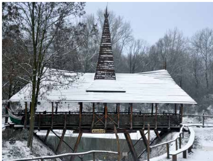
▼ Fedeles híd, Farkas-tanya, Szamos-part