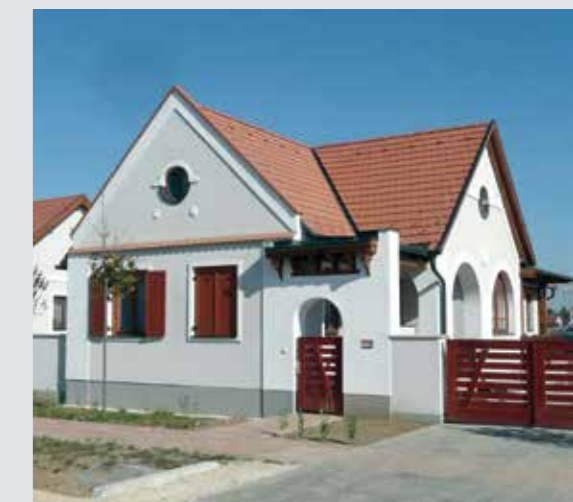
▼ A devecseri újjáépítés egyik megvalósult típus-terve

építkezés is szinte elképzelhetetlenné vált. A Kós Károly Egyesülés tagjainak többsége törvényszerűen az önkormányzati beruházások felé terelődött, ami az utóbbi években már olyan volumenű munkákat eredményez, hogy egyszerűen sem erő, sem idő nem jut családi házak tervezésére. Ráadásul a válságból minimális átmenettel a konjunktúrába átszökő lakásépítési kedvvel – törvényszerűen – nem tudott lépést tartani a korábban legatyásodott építőipari háttér, így az egyediség, a különleges szerkezetek használata gyakorlatilag kikopott erről a területről. A jól megszokott sémák, a gazdasági szemlélet, az állandó időhiány, illetve a mindenáron történő leegyszerűsítés jellemzi a – döntően spekulációs háttérű – lakásépítést.