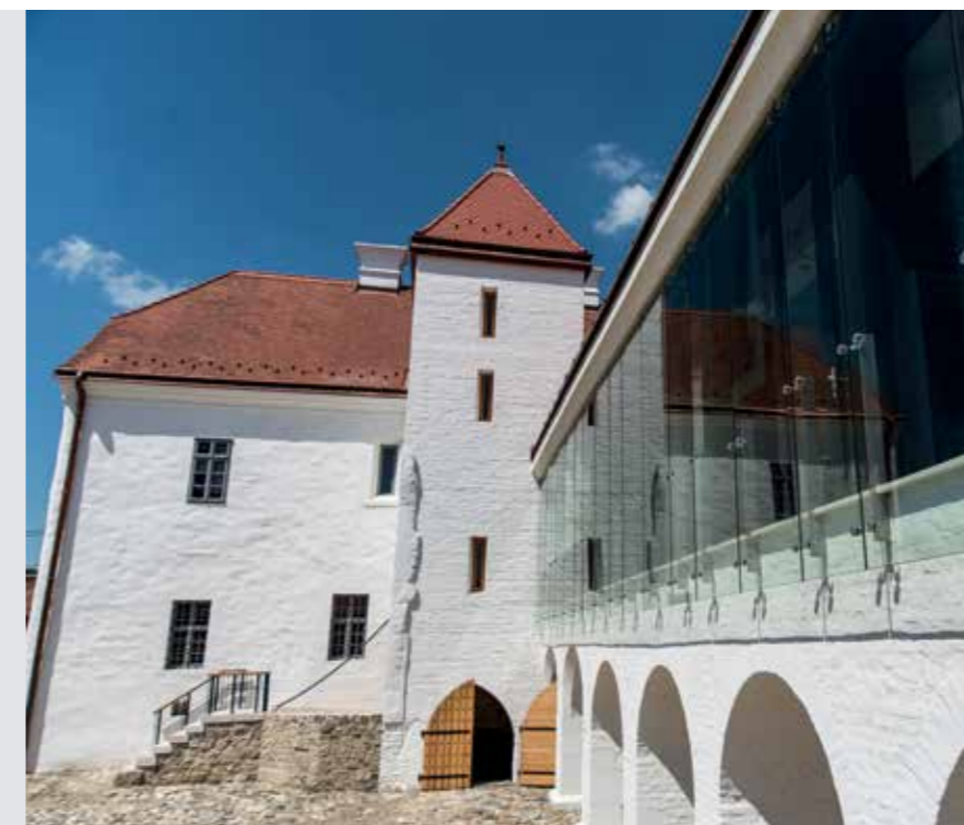
▲ A vár a rekonstrukció után. Udvari nézet keletről

ták. Az északi szárny csak alapfalaiban volt ismert, tömege azonban rekonstruálható volt, amelyet mai anyag- és eszközhasználattal valósítottak meg a tervezők. Az emeleti reneszánsz ablakkereteket a feltételezett helyükön, mintegy idézőjelbe téve, üveghomlokzat mögött mutatták be. A középkori kaputornyot csak egy szint magasságig építették vissza, ezért az eredeti formára hajazó tetőszerkezet ráépítése vitatható. Ez a kivitelezés közben született kompromisszum a torony megmagasításával még korrigálható. Ugyancsak várat magára a keleti épületszárny feltárása, lehetséges rekonstrukciós terveinek elkészítése, és megépítése annak érdekében, hogy Alsáni Bálint pécsi püspök egykori, várra erősített udvarháza a ma építészetének eszköztárát felhasználva teljessé válhasson.