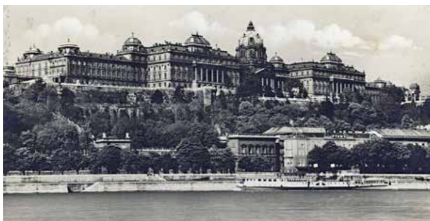
▲ Budavári Királyi Palota, 1935.