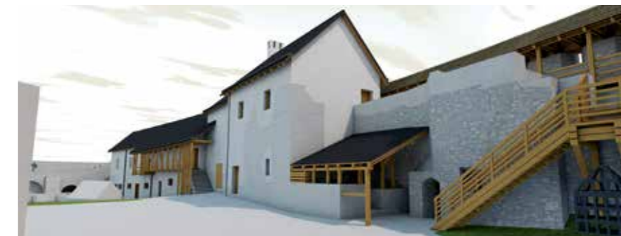
Sümege, várudvar, keleti épületek rekonstrukciója

Csak a várudvar keleti oldalán állott egykori melléképületek felújítására, kiegészítésére, újraépítésére szorítkozik a terv. Itt azonban teljes tömegrekonstrukcióval bizonyítja a szenzibilis kiegészítés módszerének létjogosultságát.