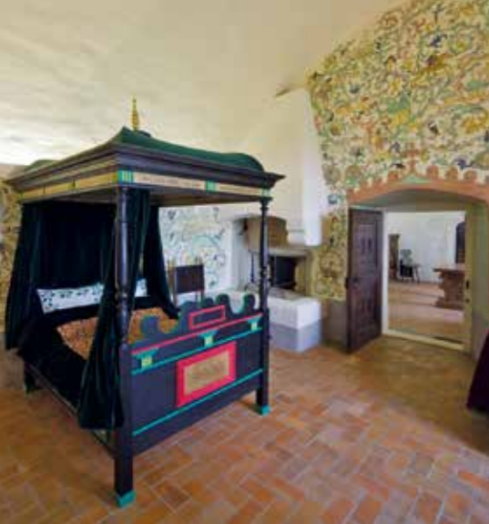
◀ Füzer, felsővár, Zöld ház, nádori szárny