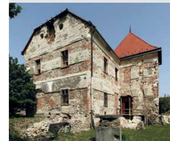
▲ A vár a rekonstrukció előtt. Udvari nézet délről