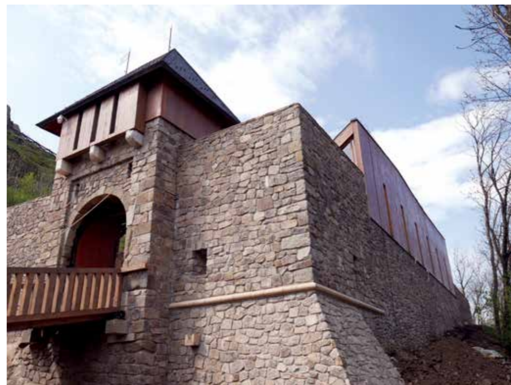
▲ Füzer, alsóvári kaputorony-rekonstrukció