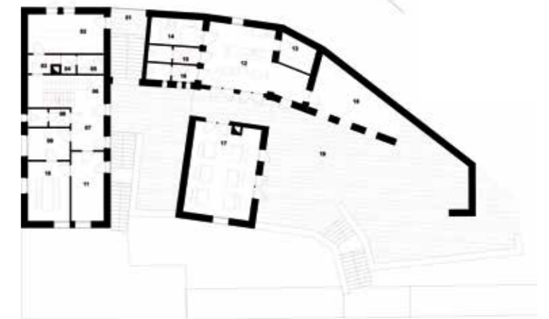
Földszinti alaprajz ▲

felismerve született meg Takács Ferenc kertészmérnök-tanár, gomba- és gyógynövényszakértő gondolataiban a Gyógynövény-völgy elképzelése, miközben az általa vezetett családi gazdaság egyre több gyógynövény termesztését, szárítását, feldolgozását végezte már a környé-