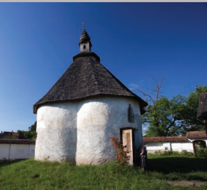
2. kép • A kápolna délnyugatról.