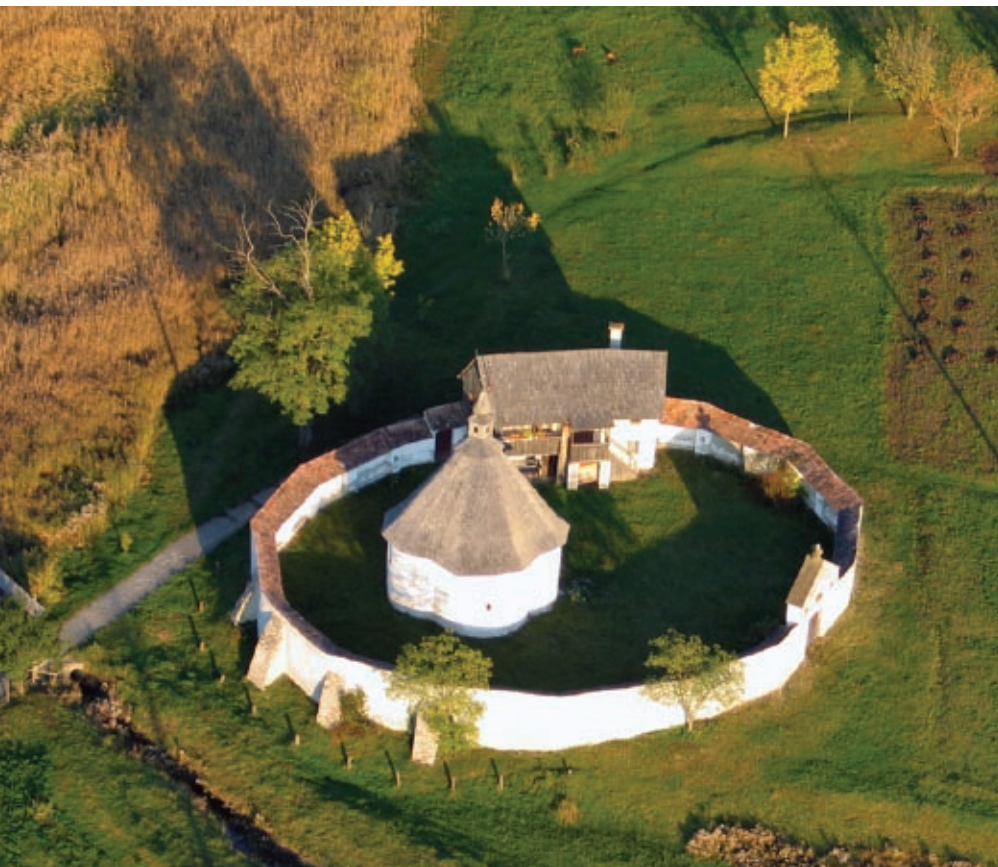
1. kép • A Jézus-kápolna a levegőből.

Székelyudvarhely határában, a Segesvár felé vezető út mellett áll a Jézus-kápolna (1. kép). A kis négykaréjos rotundát elliptikus alaprajzú kései kőfal övezi, melyen belül a templom excentrikus helyzetet foglal el (1. ábra). Eredeti bejárata nyugatról nyílt, ami ma már be van falazva. A jelenlegi bejárat a déli oldalon van (2. kép), hogy az északi karéjba (át)helyezett oltárral szemben lépjen be a templomba térő. A középkorban az oltár ilyen elhelyezése szóba sem jöhetett volna: akkor még tudták a főpapok, hogy egy templom szentélyének az épület keleti végében kell lennie, mert onnan érkezik a teremtő fény. A veleméri templom keleti szentélyab-