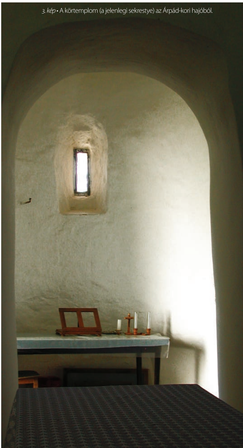
3. kép • A körtemplom (a jelenlegi sekrestye) az Árpád-kori hajóból.

A Somló oldalában álló körtemplom kis belméretével nem áll elszigetelten a Kárpát-medencében. Egyik legközelebbi „rokona” a Vésztő-Mágorhalmon feltárt Csolt-monostor területén lévő