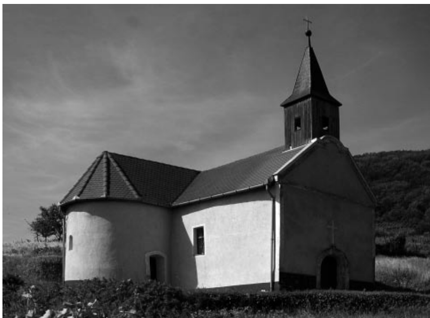
2. kép • A templom északkeletről