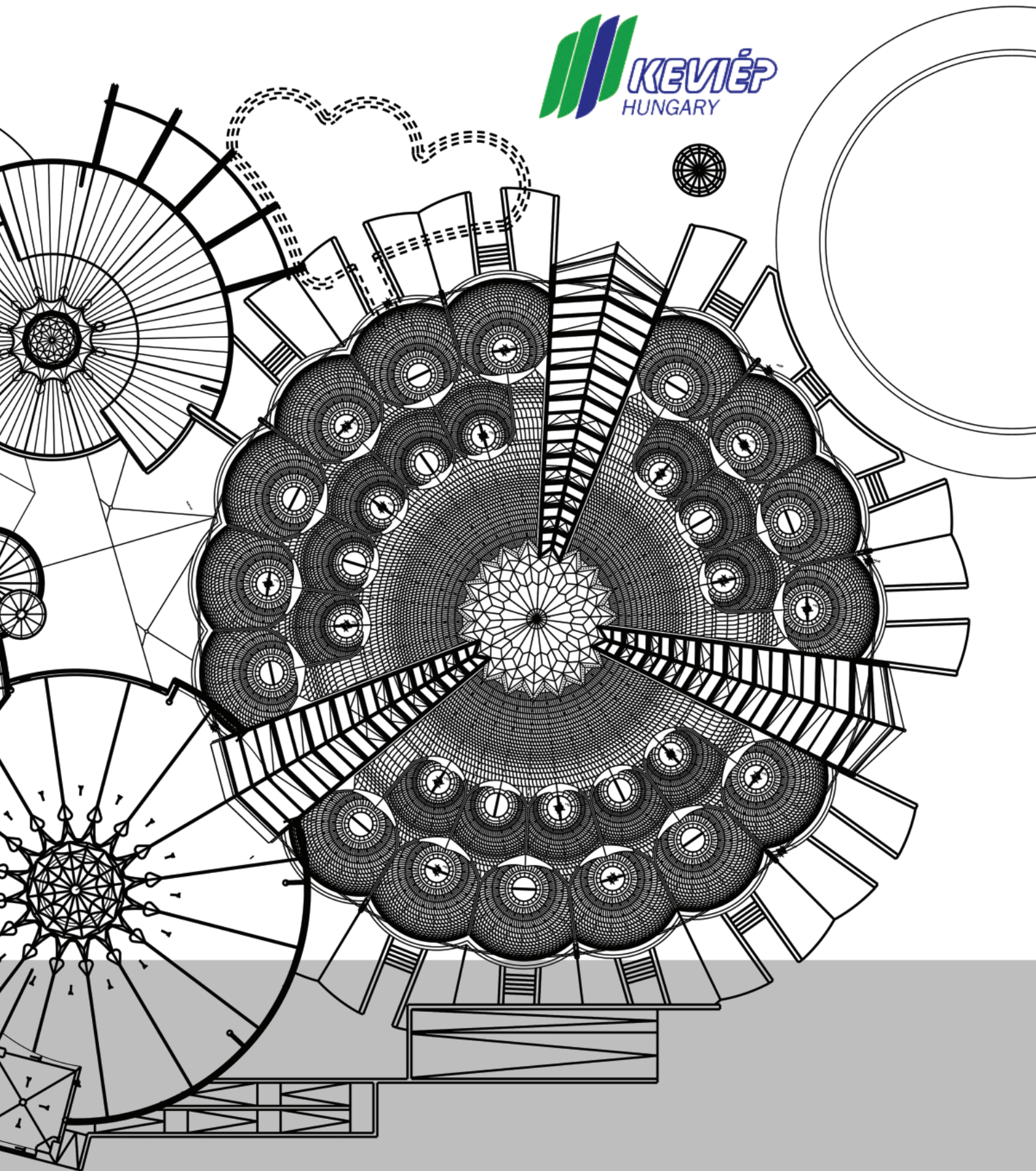
Makó, Termál- és Gyógyfürdő • szerkezetépítés; felülnézeti és belső képek, tetőalaprész • Számítógépes látványterv: Gyetvai Attila