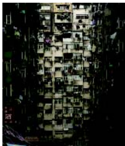
Hong kongi lakóépületek homlokzatrészletei