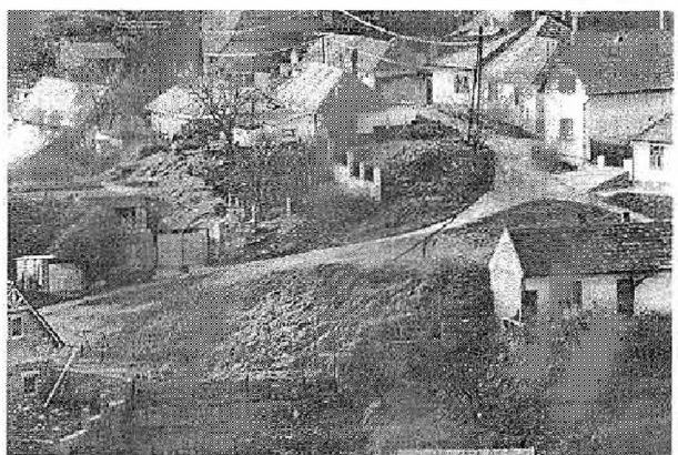
Szent Tamás hegyi részlet