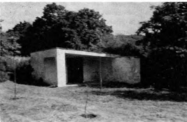
Az eredeti állapot