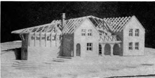
A pinceátalakítás modellje

falubéli tulajdonban van, visszafordíthatatlan az a folyamat, hogy bortárolás helyett részben vagy egészben nyaralónak használják. Rendeletekkel ezt vissza-csinálni nem lehet. Úgy gondoltam, inkább elébe kell menni ennek a valós igénynek; számomra ebben a feladatban az volt az izgalmas, hogy példát adjak egy lehetséges jó megoldásra.