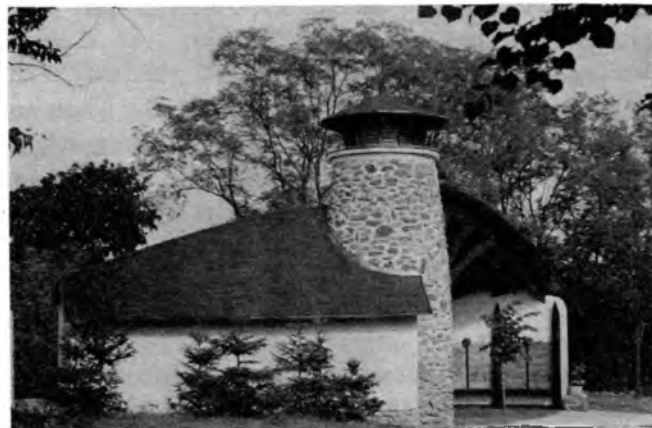
Az új temetőkápolna

Mikor készen lett az épület, amit végül szabadtéri misézésre is alkalmassá tettünk, legalább tíz községből érkeztek plébánosok, hogy jelen legyenek a szentelésen. A szertartást a balatonfüredi apát úr végezte. Nagyon különös, hogy mostanában soha nem múlt el úgy tél, hogy el ne vitt volna valakit az öregek közül Pulán, de a ravatalozóra most nem volt szükség, amíg el nem készült. Egy hétre rá már onnan temettünk egy idős asszonyt, aki még ott volt a szentelésen.