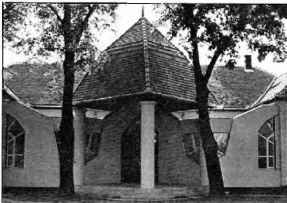
Balatonszemes, tanácsháza átalakítás és bővítés. Lőrincz Ferenc