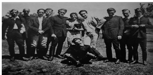
A Györfy István Kollégium kulturális csoportja, 1942 17

feltáró kutatói munka kategóriájában is. 15 Megjegyzem azonban, hogy Molnár ebben az időszakban nem tájegységben rögzített színpadi táncban, hanem csak figurákban és koreográfiai-formai közlésben gondolkodik, ahogyan ez az 1942-ben kiadott Élő Népballadák kötetében nyomon követhető. 16 Molnár István ebben az időszakban tanulja meg a magyar néptáncot és válik vezéralakjává a népi kollégiumokban szerveződő táncsoportoknak Muharay Elemér mellett. Muharay Elemér is a falukutatásnak köszönhetően hozza létre a Fóti faluszínpadot 1938-ban Volly István és az 1939-ben hozzájuk kapcsolódó Szabó Iván közreműködésével. Ez pedig követi a városban működő mozgásművészek által kialakított népballadás stílust. A balladázás pedig az 1940-ben megalakuló Muharay Együttes sajátosságává válik. Mielőtt erre rátérnék, bemutatom a népi kollégiumok megalakulását, tevékenységét és táncművészetére gyakorolt hatását.