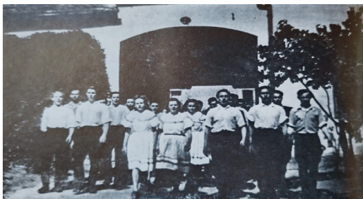
A Pápai kollégisták falujárása 40