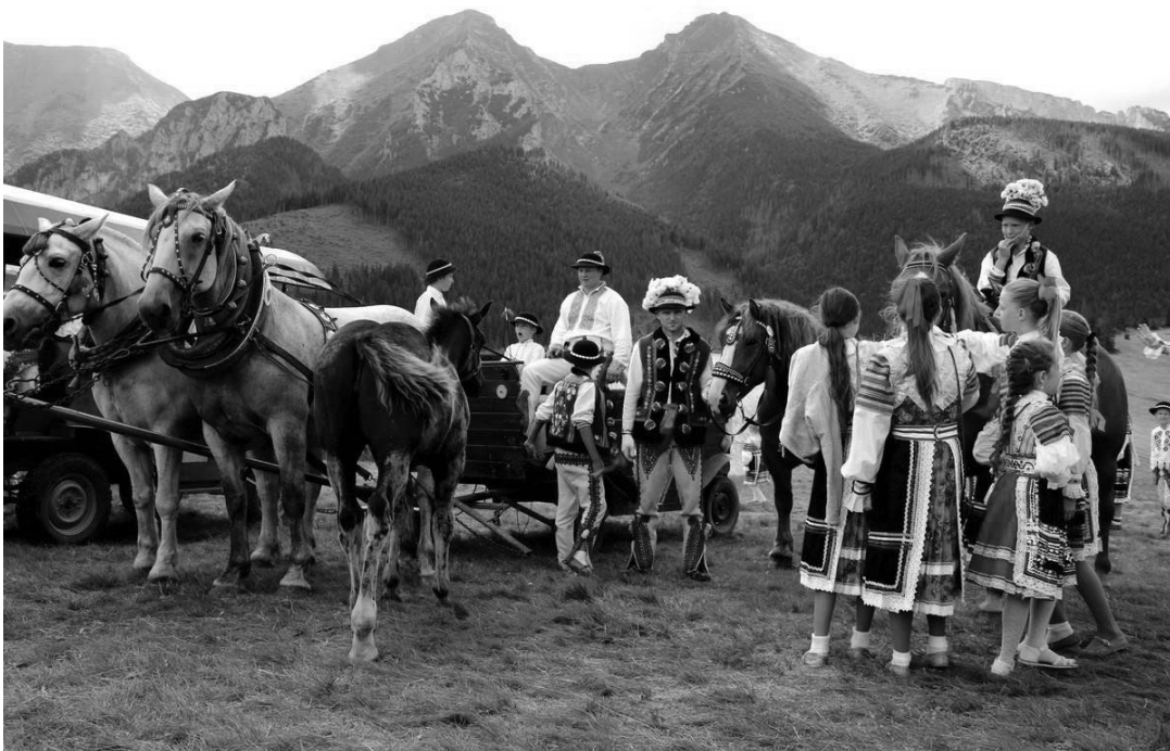
6. ábra. Készülődés a Gorál Fesztiválra