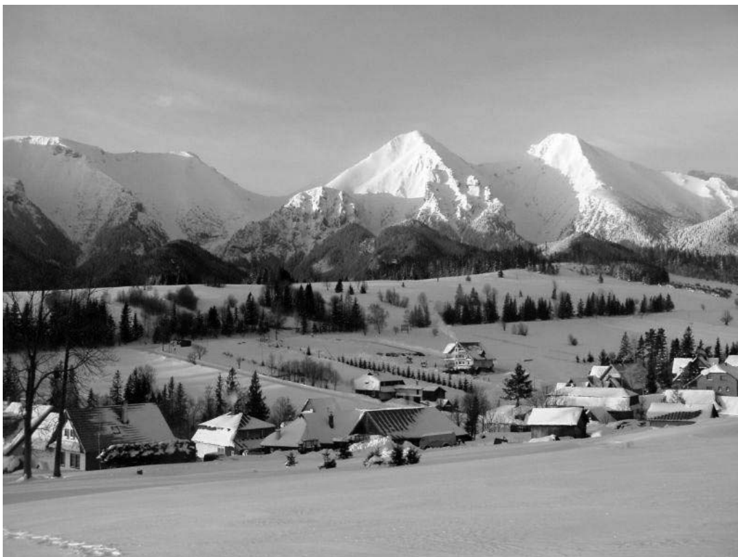
2. ábra. Ždiar téli látképe a Magura felől