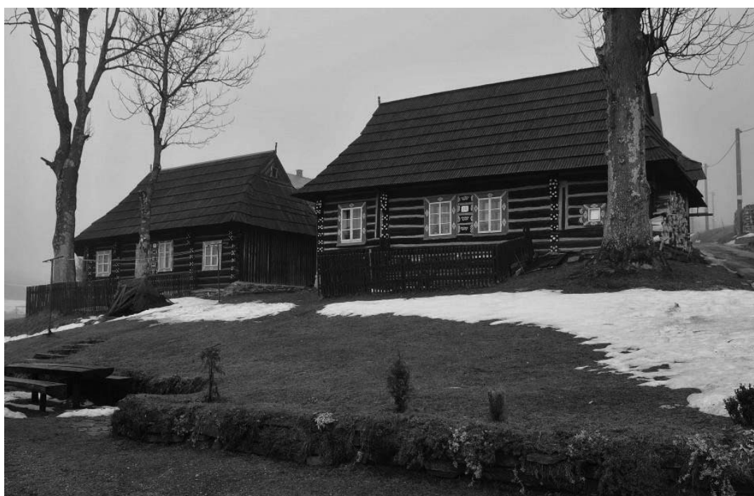
4. ábra Jellegetes ždiari házak