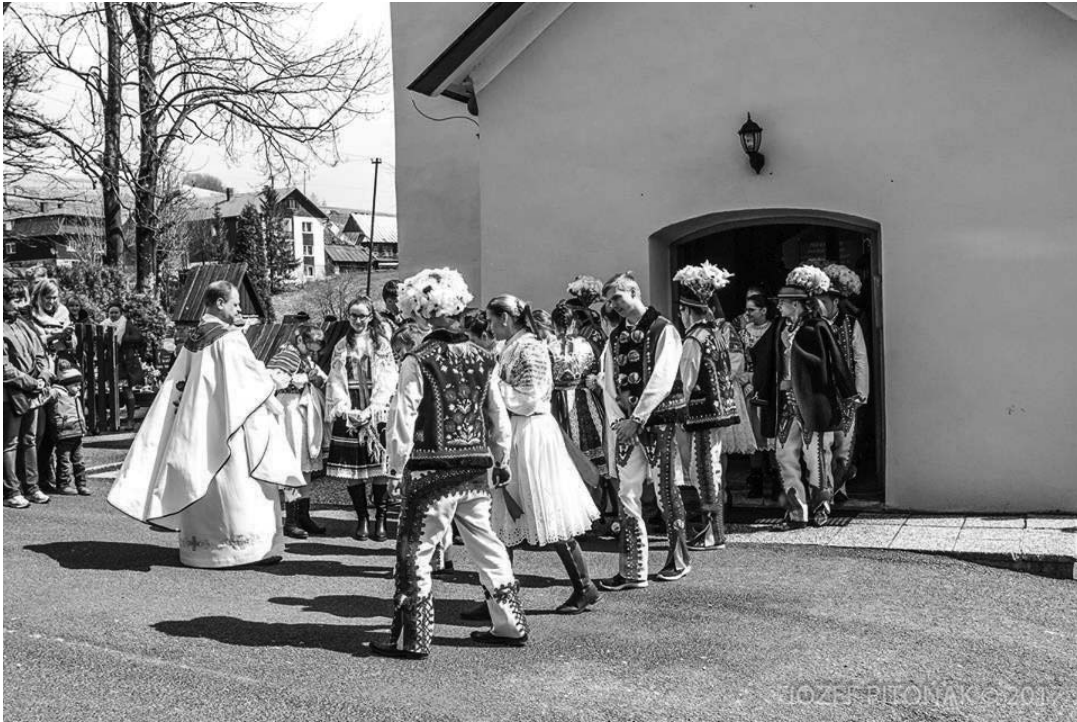
5. ábra. Húsvéti mise utáni látkép