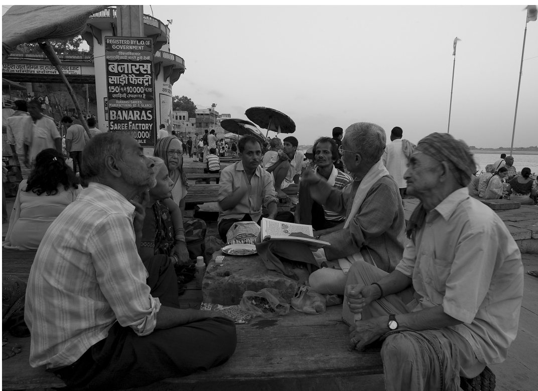
Este a mesélőnél, India, Varanasi, Main Ghat, 2009.

This paper of the author gives a historical overview about the dynamic changes of these two types.