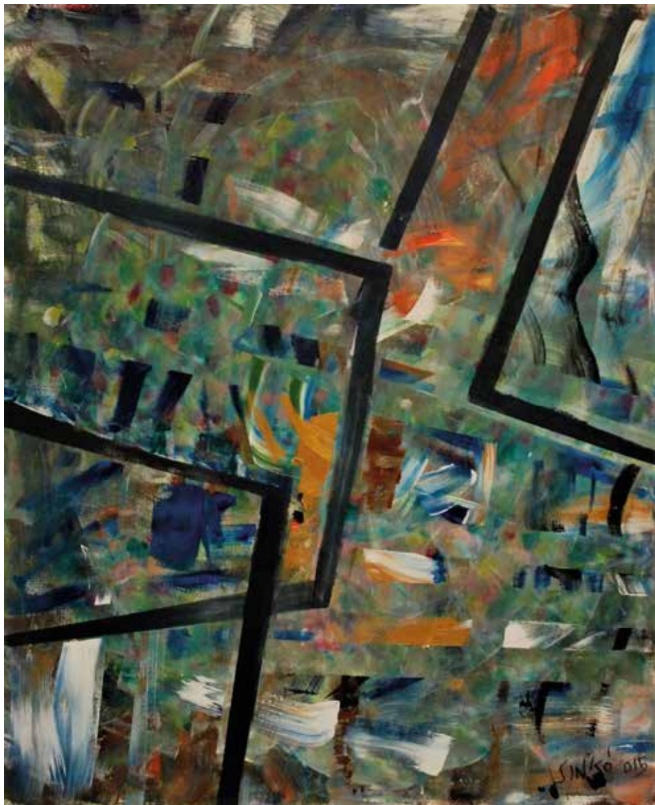
Ősz ablakkerettel, 2015, akril, vászon