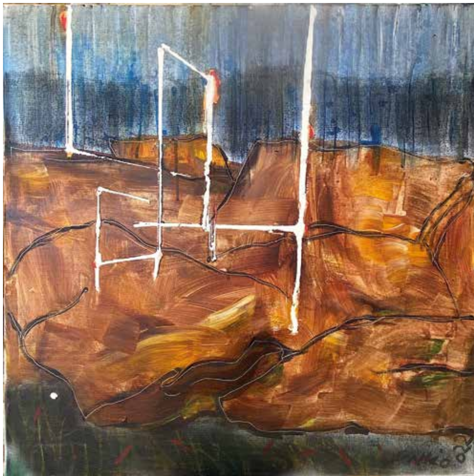
Dombok és szerkezet, 2022, akril, vászon