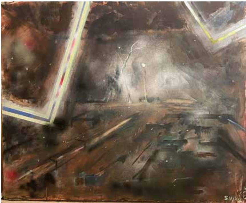
Talált táj, 2022, akril, vászon