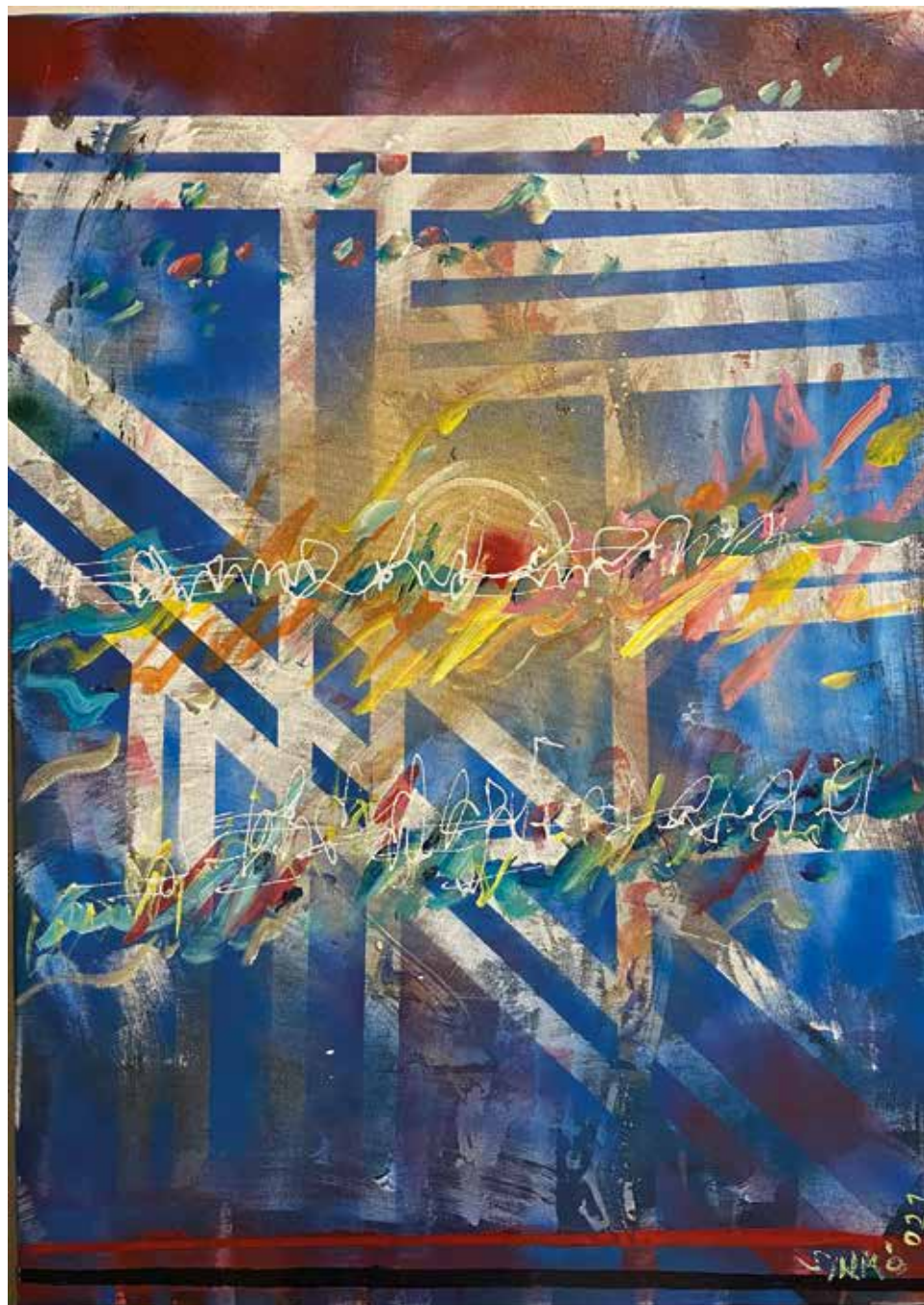
Mozart felé, 2021 akril, vászon