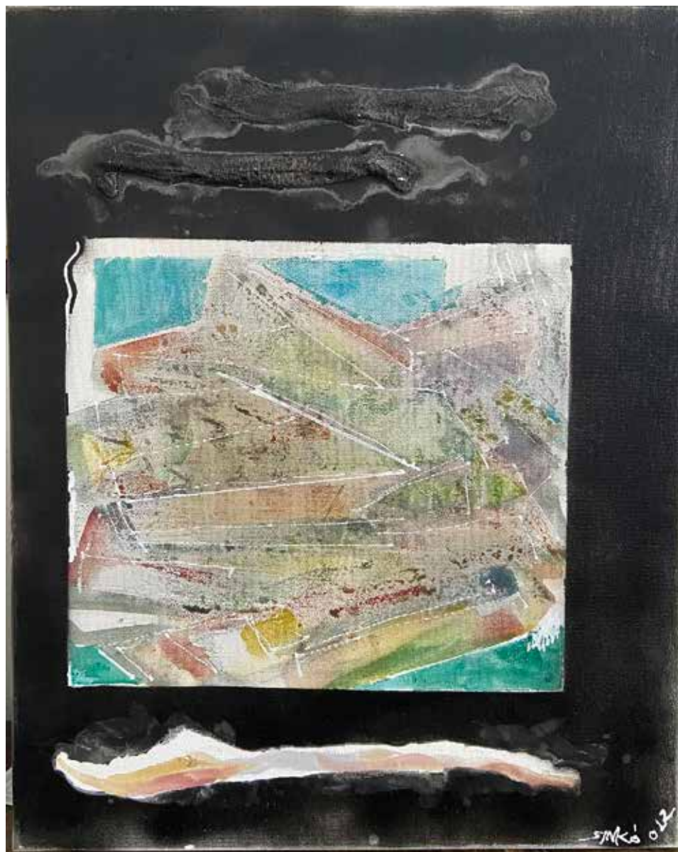
Tektonika, 2022, akril, vászon