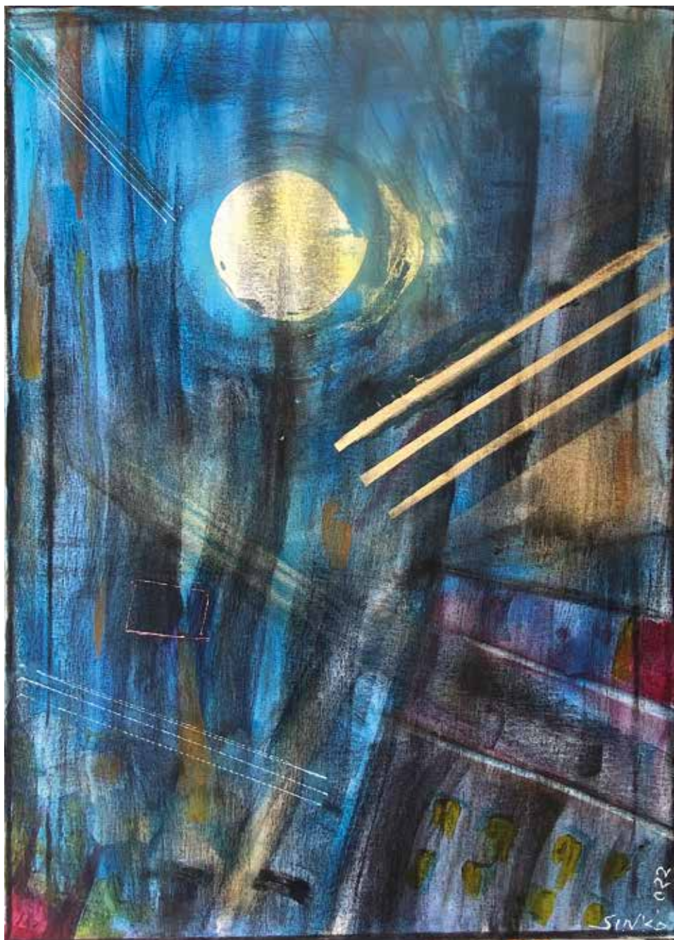
Talán hold, 2022, akril, szén, vászón