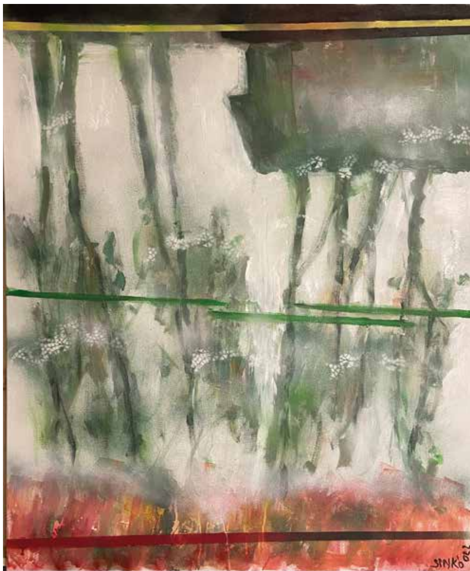
Talán fák, 2022, akril, vászon