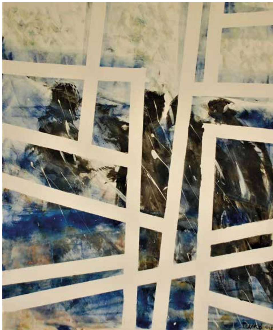
Tél ablakkerettel, 2015, akril, vászon