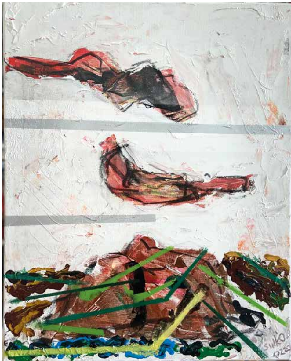
Tájtöredék, 2022, akril, vászon