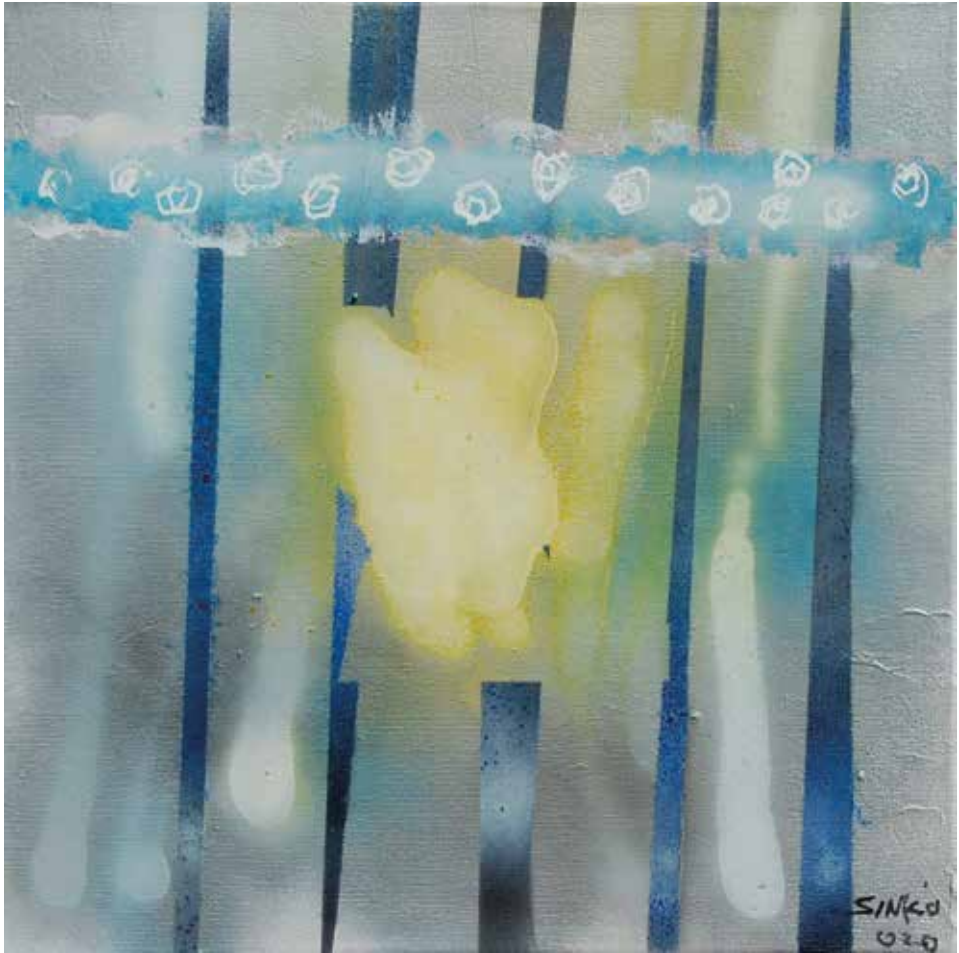
Kis téli kép, 2020, akril, vászon