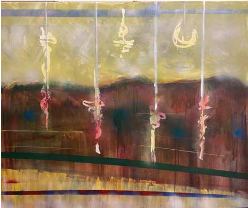
Táj diszekkel, 2022, akril, vászon