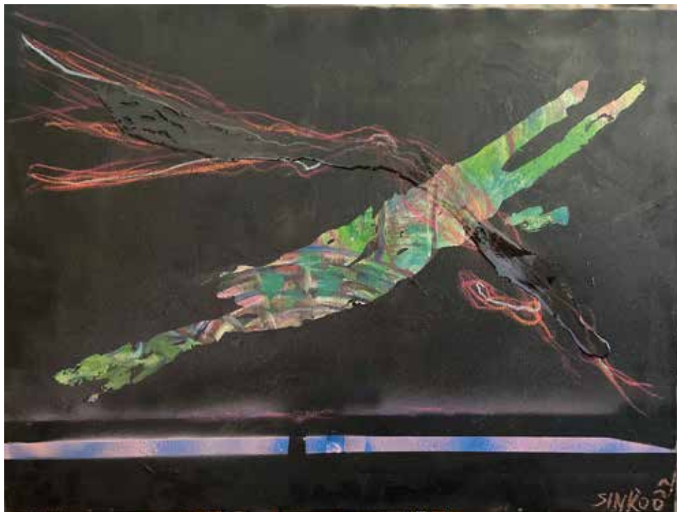
Elfolyó, lebegő tájrészlet, 2022, akril, vízüveg, vászon