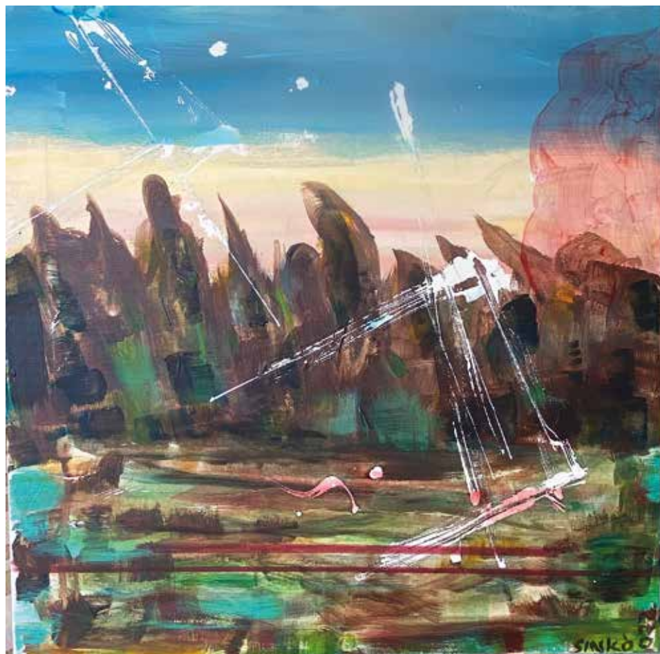
Kis talált táj, 2022, akril, vászon