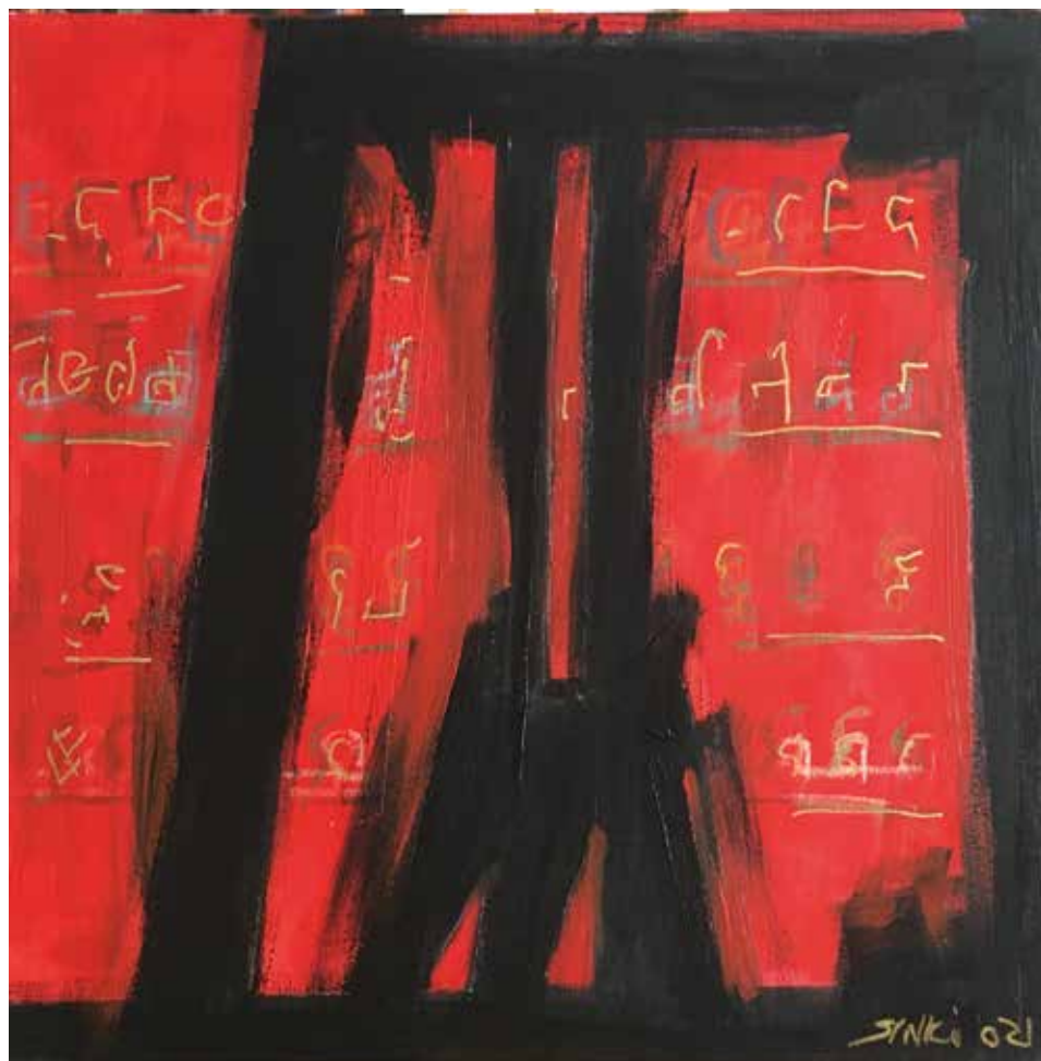
Írás a falon 2., 2021, akril, vászon