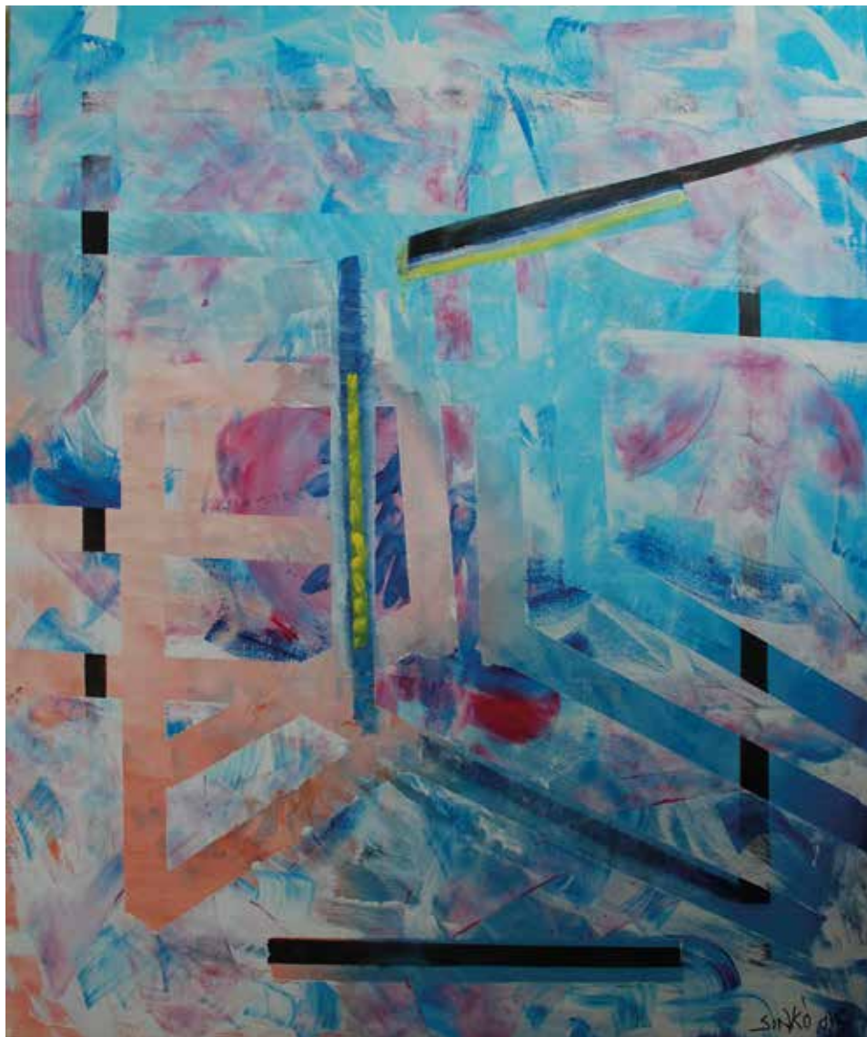
Tavaszi ablakkerettel, 2015, akril, vászon