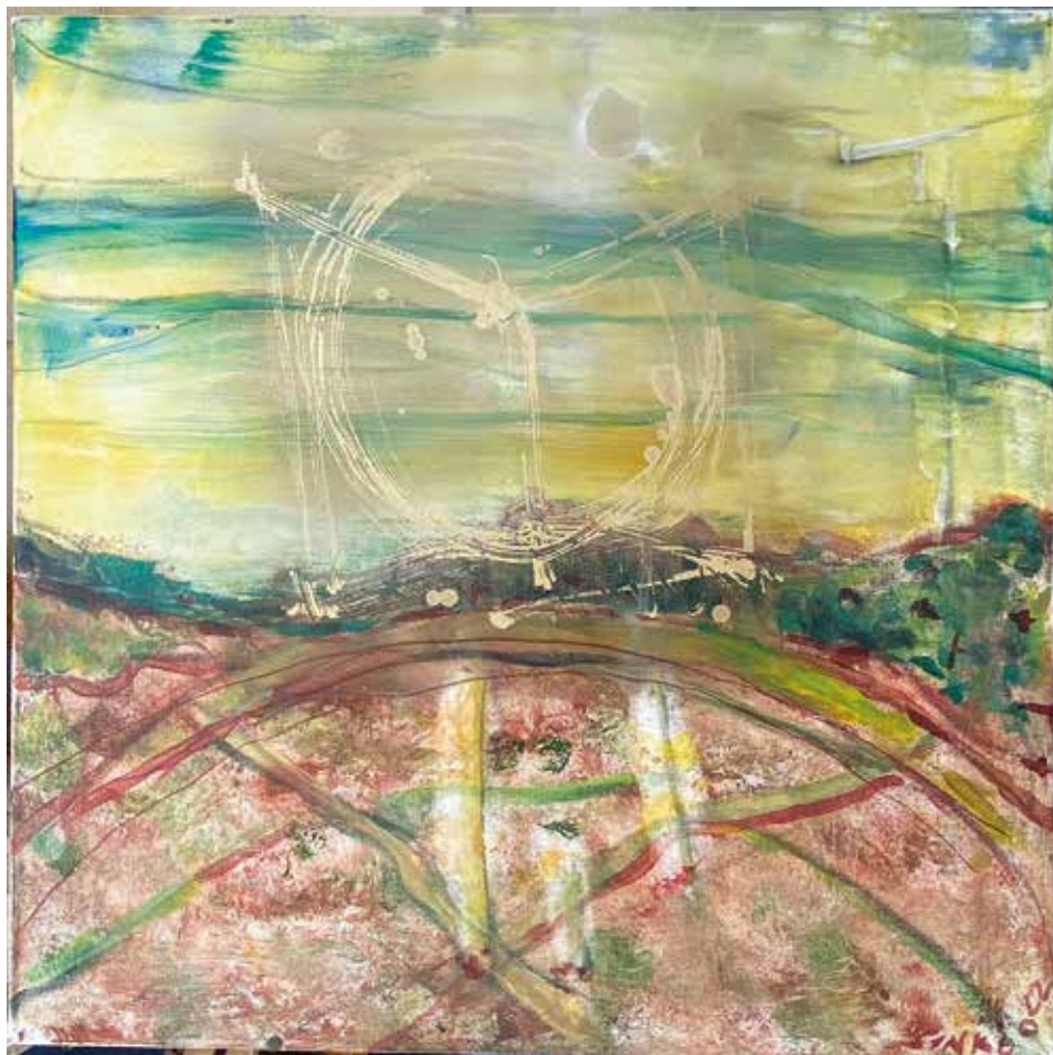
Arany panoráma, 2022, akril, vászon