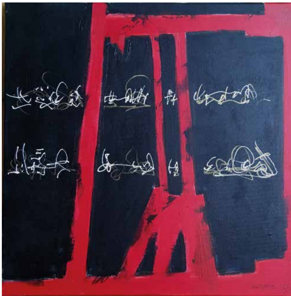
Írás a falon 1., 2021, akril, vászon