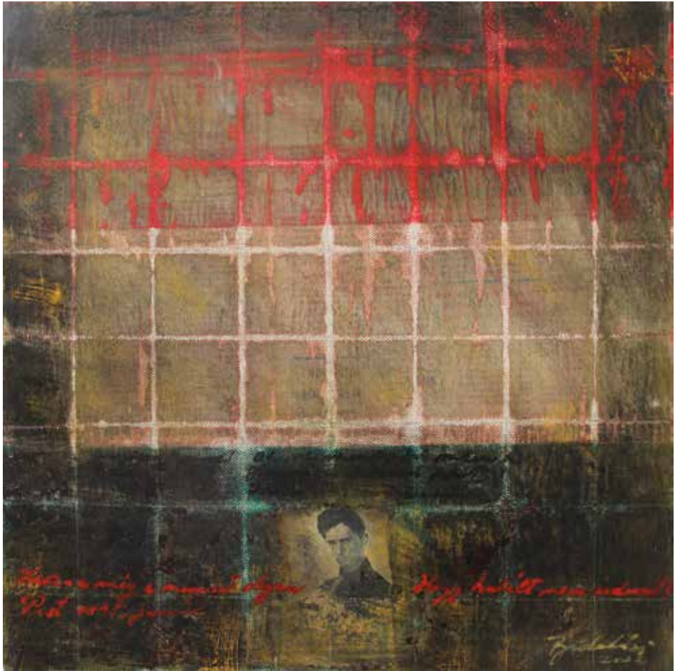
Budaházi Tibor: Petőfi emlékének (2020, akril, vászon, 40×40 cm)