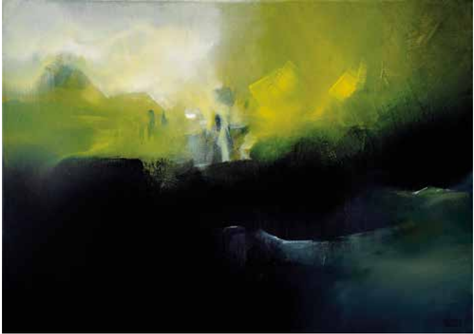
Rósa Márta: Mindenáron (2020, akril, vászon, 70×100 cm)