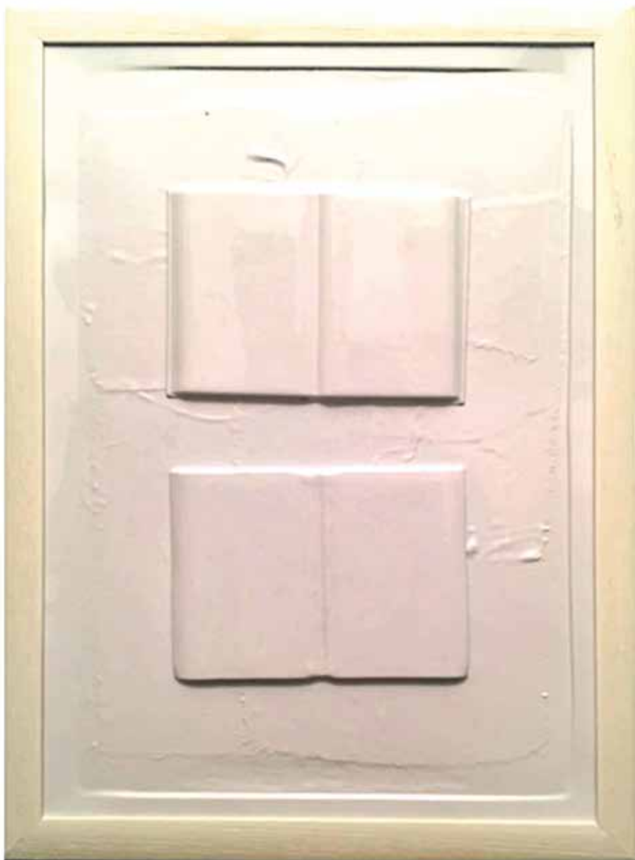
Széchy Beáta: Mögöttem a múlt (Petőfi Sándor összes költeménye) (2020, vegyes technika, 60×80 cm)