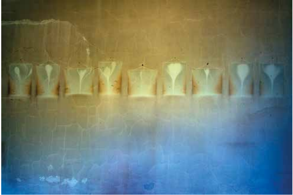
Gáti György: Petőfi-képeskönyv (2022, digitális fotók, változó méret)