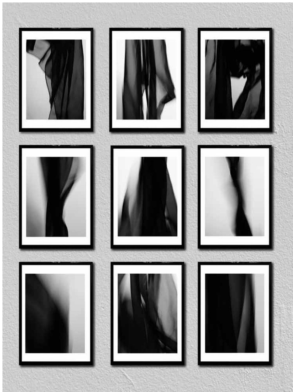
Mikáczó Alexandra: „Ha eldobod egykor...” (sorozat) (2021, fótósorozat, 21×30 cm)