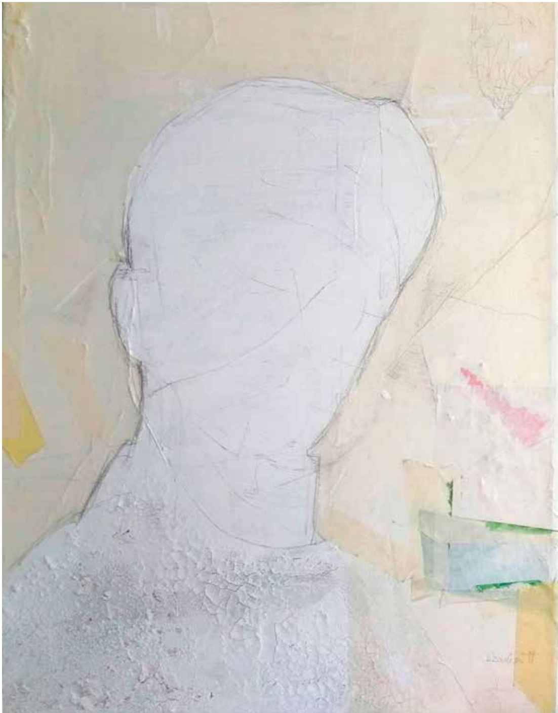
Szarka Hajnalka: Emlékművek (2022, vegyes technika, vászon, 50×80 cm)