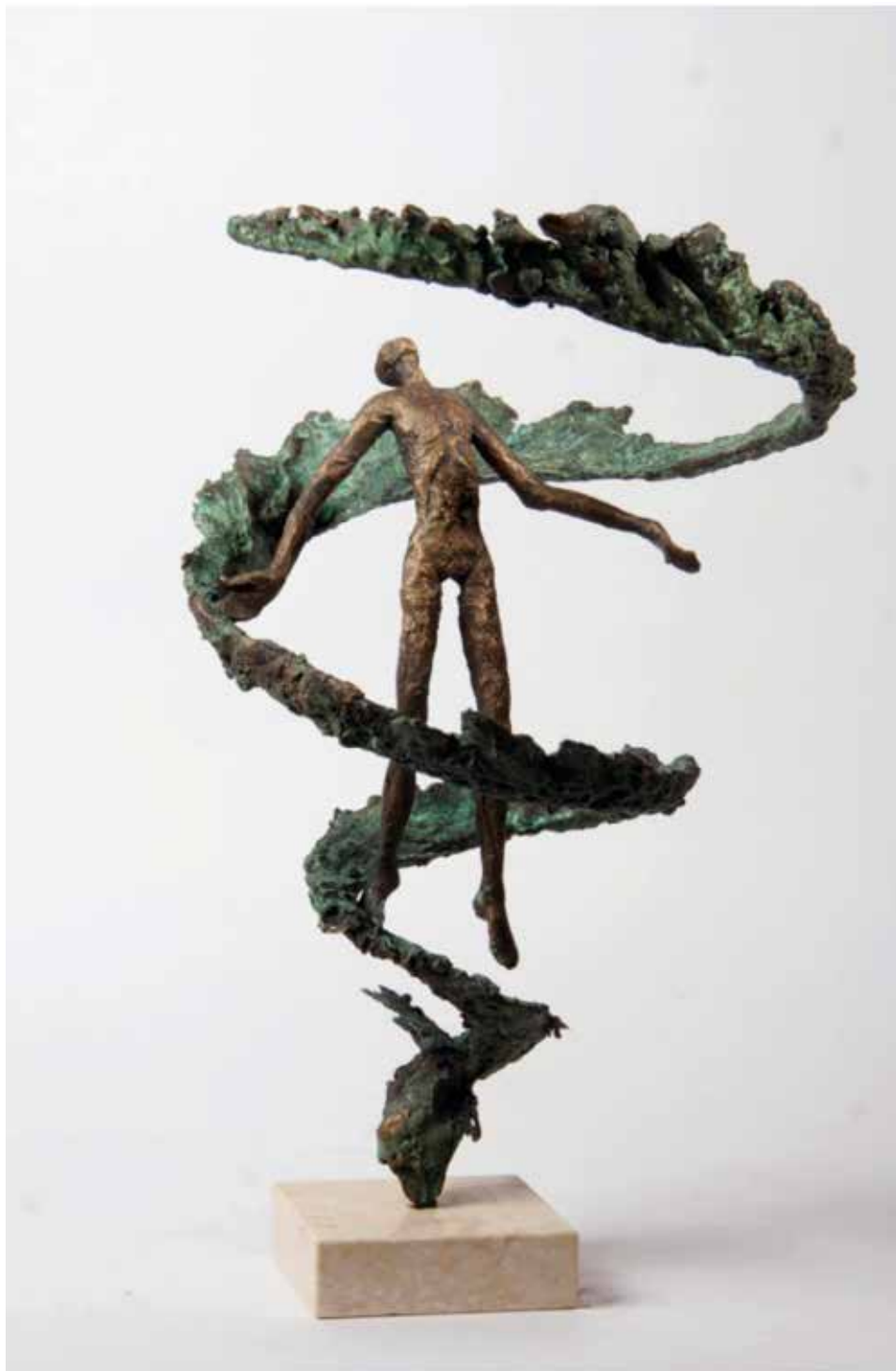
Farkas Krisztina: Fény felé (2013, bronz, mészke, 40×25×25 cm)