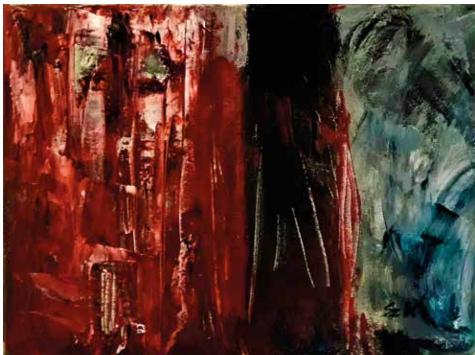
Szabó Katalin: Ítélet (2020, akril, vászon, 30×40 cm)