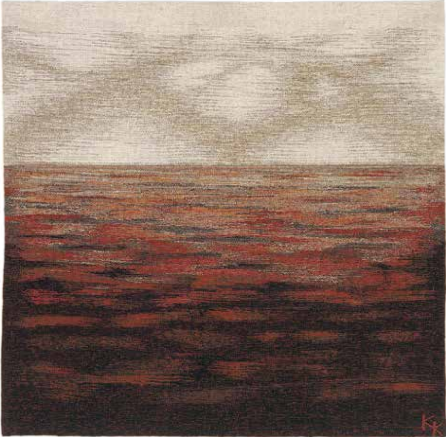
Kiss Katalin: Táj (csata után) (1999, gyapjú, szövött kárpit, francia gobelin technika, 4-es sűrűség, 100×100 cm)