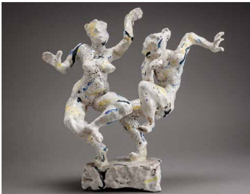
Michael Flynn (GB): Figurák (1998); mintázott kőedény, rakuzott, oxidál és színtesttel dekorált, 1280°C, méretek: 41×42×16 cm