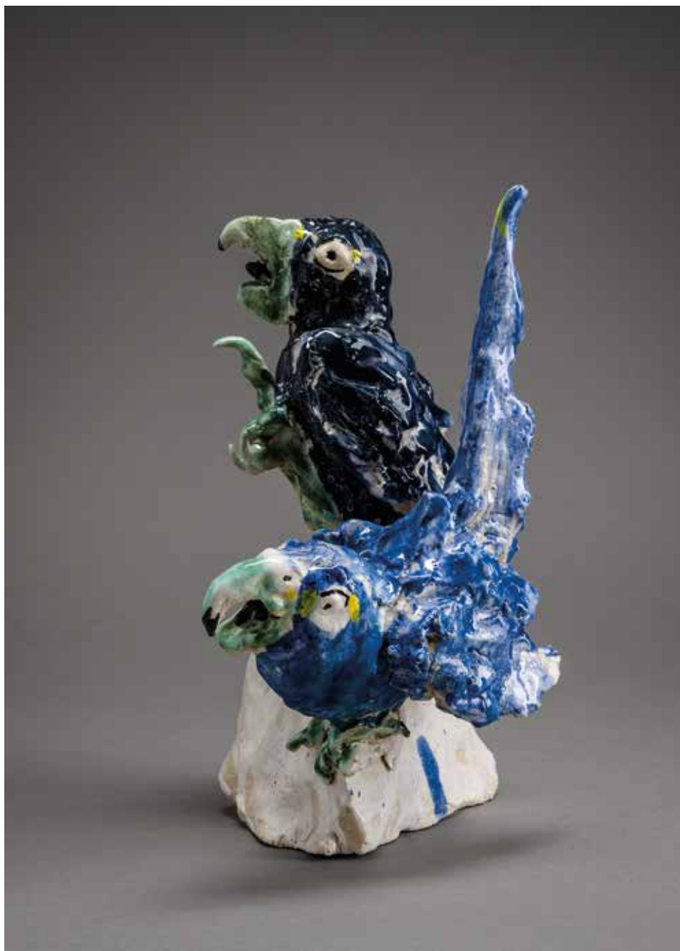
Michael Flynn (GB): Haragos papagáj (2003); mintázott porcelán, színes mázakkal festett, 1280°C, méretek: 26,5×18×15 cm