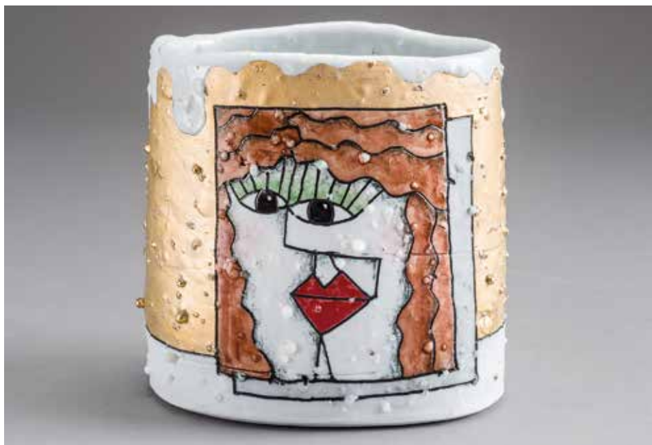
Rimas VisGirda (US): Emlékek (2009); saját, kevert anyagból korongozott, dekorfestékkel festett, 1280°C, méretek: 12×13×9 cm