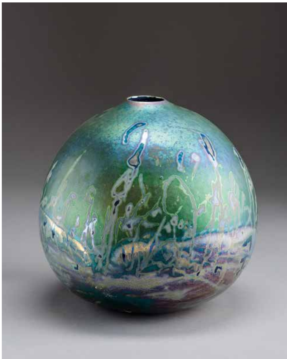
Greg Daly (AU): Egy nap pillanatai (2016; korongozott kőcserép, lüszter, gázkemencében égetve, 1160°C, méret: 17×16 cm)