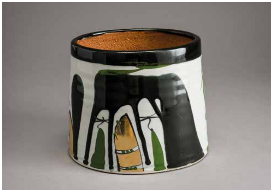
Archie McCall (GB): Váza (2007); korongozott kőcserép, gázredukció, mázzal festett és arannyal dekorált, 1300°C, méretek: 16×17×13 cm