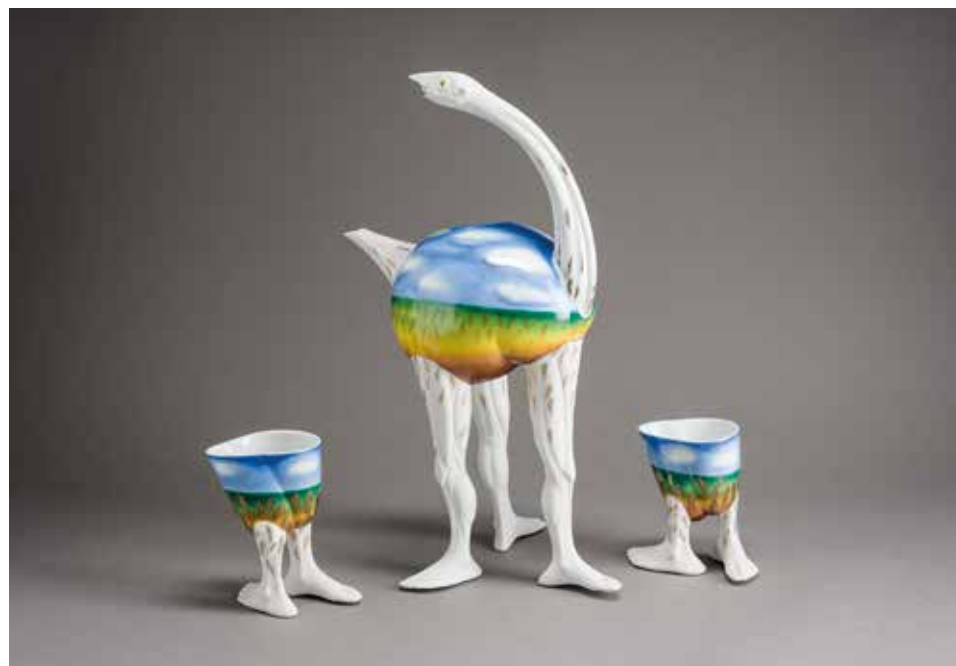
Ilona Romule (LV): Strucc (2003); öntött porcelán, színes- és aranyfesték, 1300°C, méretek: 42×19×25 cm