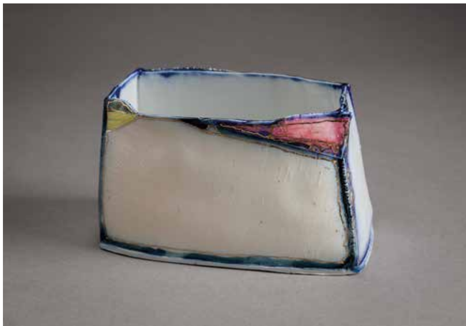
Péteris Martinsons (1931–2013, LV): Kincs (2003) porcelánból öntött, lapokból épített, gázredukció, máz felett színtesttel festett és arannyal dekorált, 1340°C, méretek: 8×10×5,5 cm