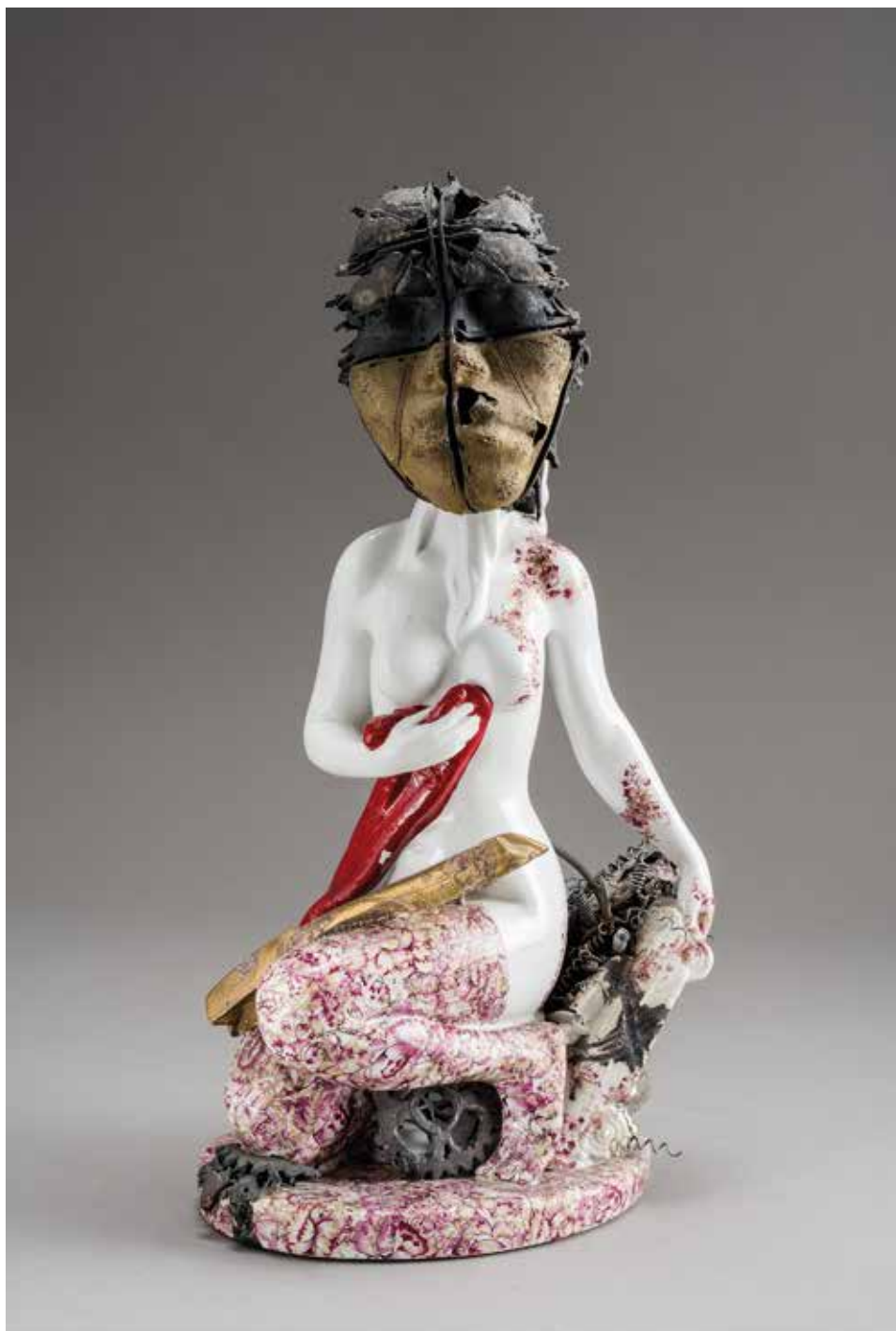
Fekete László (HU): Kisasszony (1994); öntött és mintázott porcelán, színes dekormatrica, 1150°C, méretek: 36×18×13 cm