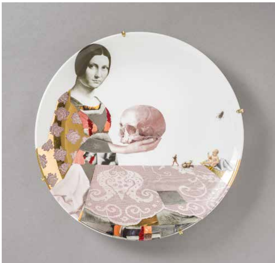
Dalia Lauckaitė-Jakimavicienė (LV): Nő koponyával (2009) öntött porcelán, máz felett színes dekormatricával és aranylüszterrel díszített, 1280°C, méretek: 30×3 cm