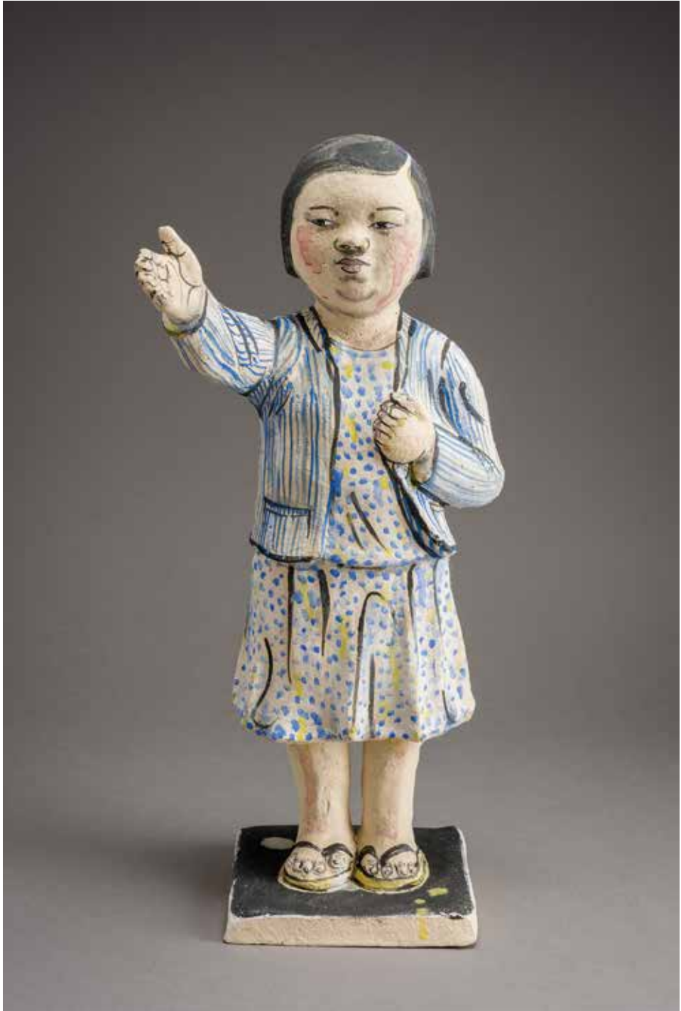
Akio Takamori (1950–2017, JP/US): Álló lány (2007); mintázott kőcerép, oxiddal és színtesttel festett, 1130°C, méretek: 40×18×17 cm