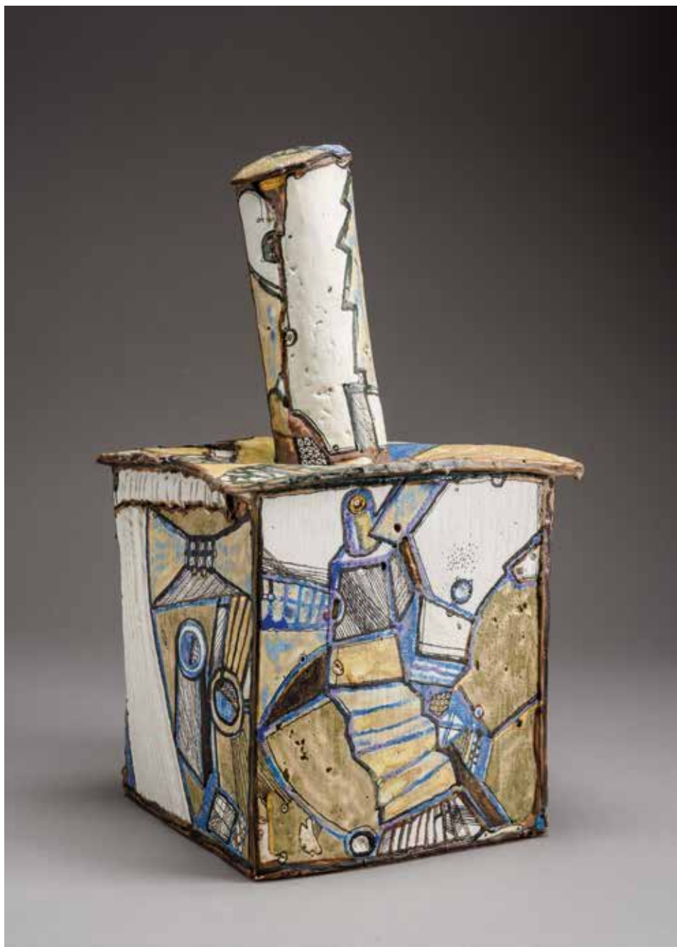
Pēteris Martinsons (1931–2013, LV): Saggar doboz (1993) kézzel épített, porcelán lapokból öntött, színes dekorfestékkel és aranyozással díszített