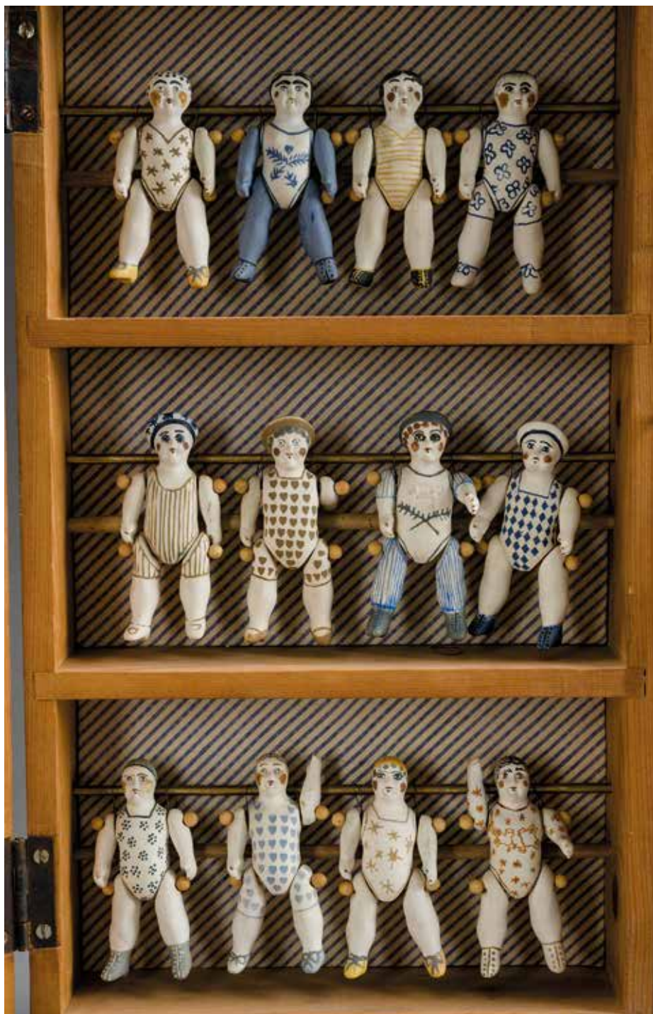
Bán Mariann (1946–2014, HU): Babatároló (1984); mintázott köcserep és fa, oxidál és szintesttel festett, 1280°C, méretek: 45×40×5 cm