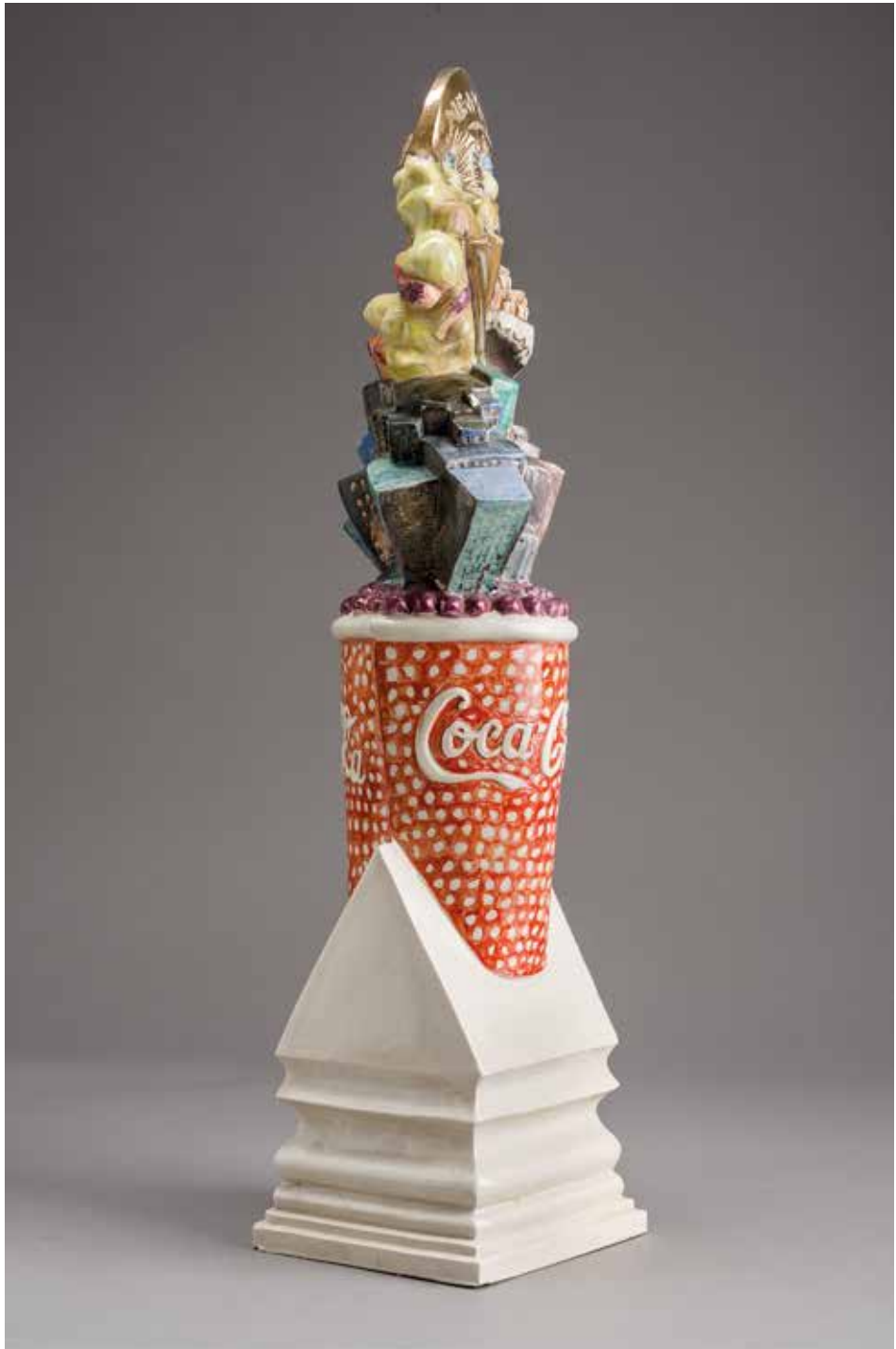
Kungl György (HUI): New York (1998); mintázott kőedény, dekorfestékkel és lüszterrel festett, 1280°C, méretek: 47×12×11 cm