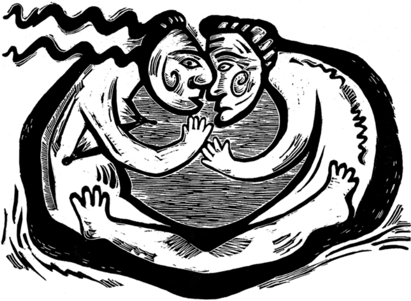
De profundis 8