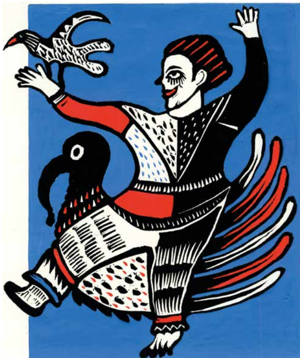
Ki zörög itt? 7