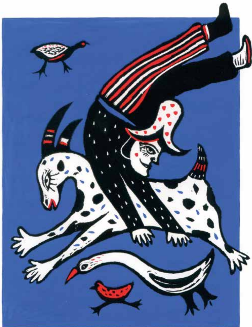
Ki zörög itt? 9