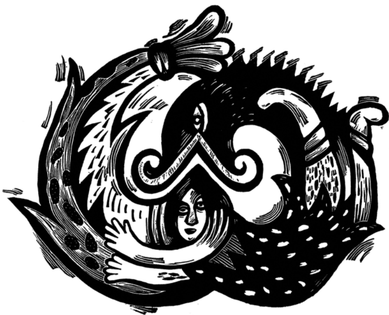
De profundis 2