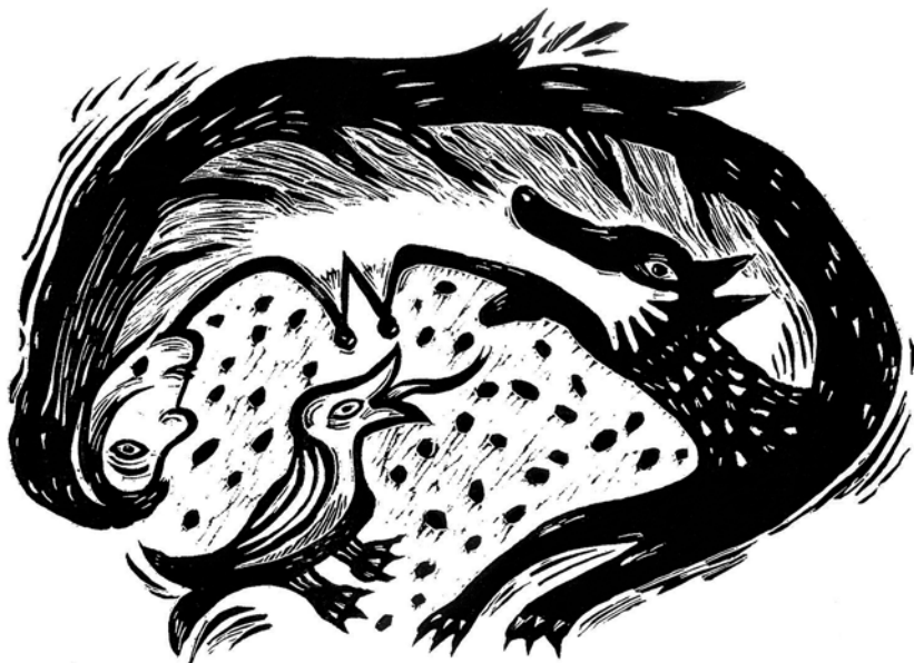
De profundis 4