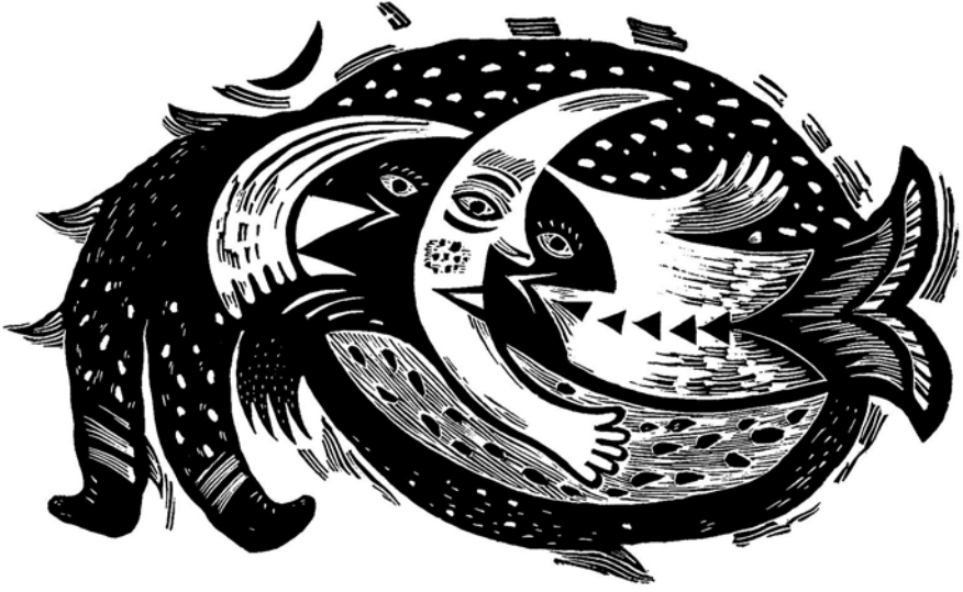
De profundis 7