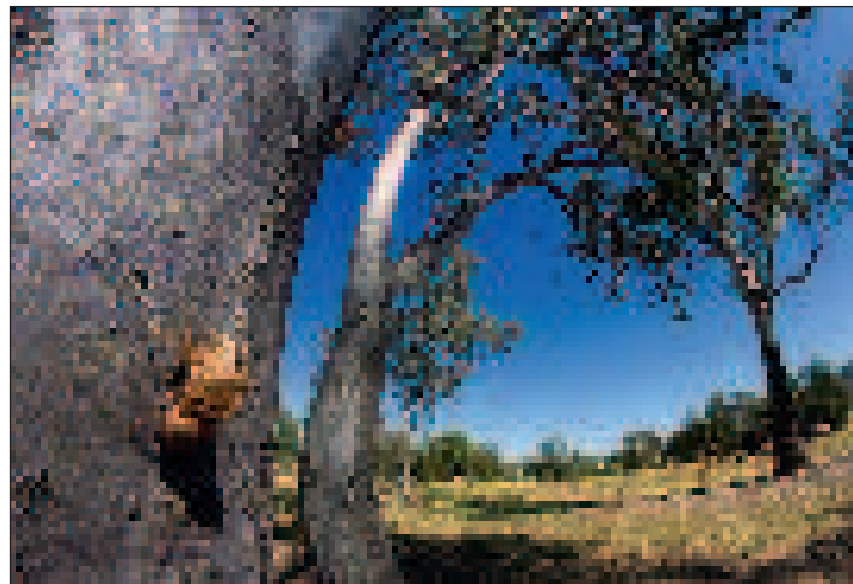
Termetes levedlett kabócabőrök Albury parkjában

gerjesztették. Meglepő módon ugyanis a két szomszédos állam vonatai különböző szintávon közlekedtek, így a határt jelentő Alburyben mindent át kellett pakolni másik vonatra. A természetkedvelők kedvéért említésre méltó a meglepően korán, 1877-ben létrehozott Albury Botanikus Kert, ahol több mint ezer növényfaj tekinthető meg. Ausztrália sok más vidékéhez hasonlóan az itteni kemping területe és a mellette lévő park is rengeteg madárnak nyújt