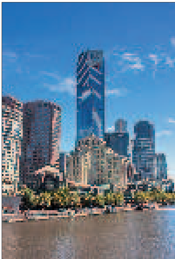
Eureka Torony: a világ legmagasabb lakóépülete Melbourne belvárosában, a Yarra-folyó mellett

je le a 3680 lépcsőfokot. Melbourne legmagasabb épülete 297 méterrel ezüstérmes Ausztráliában, de az egész világon is csak mintegy három tucat magasabb építmény található. A 91 emeletes lakóépület 88. emeletén található a Skydeck nevű kilátó, ahol körbesétálva minden irányban fantasztikus látványban lehet részünk. Innen lehet igazán megtapasztalni a város méreteit. A padlótól a mennyezetig tartó vastag üveg lehetővé teszi a jó kilátást, de a tükröződés nem igazán segíti elő a jó fotók készítését. Még a tériszonyban szenvedők is elismerik azonban, hogy ezért a látványért érdemes leküzdeni a rettegést. Nekik