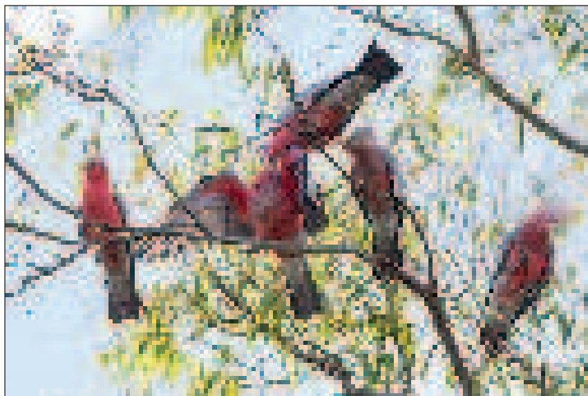
Reggeli etetés a rózsás kakaduknál, Albury park

hogy Ausztrália fővárosa nem Melbourne vagy Sydney. Canberra eléggé speciális helyzetben van, hiszen 360 ezer