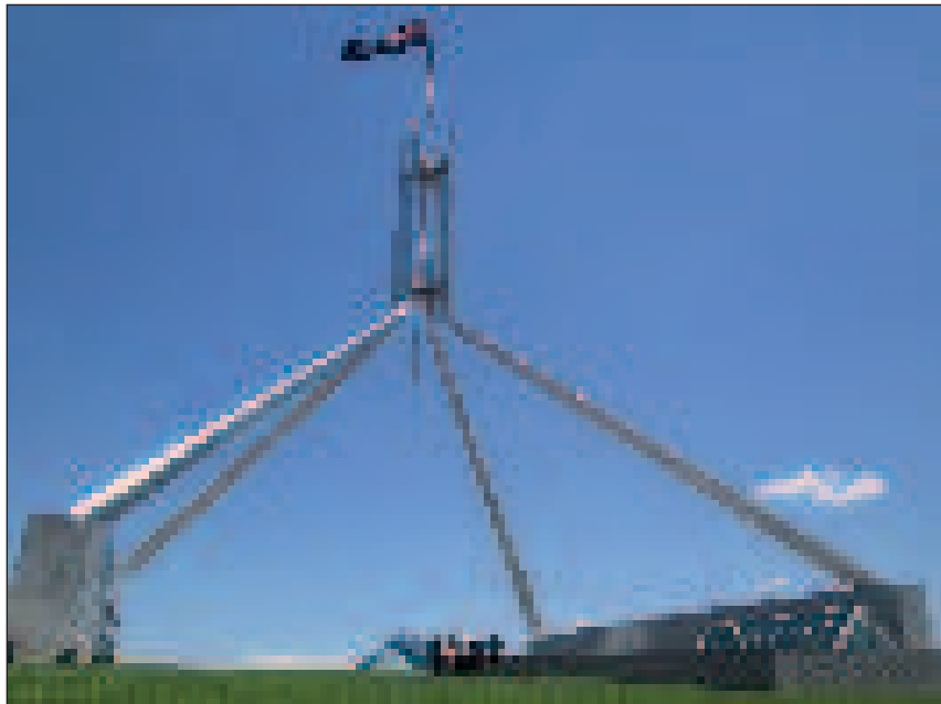
Mindössze ennyi látható kívülről az ausztrál parlament épületéből