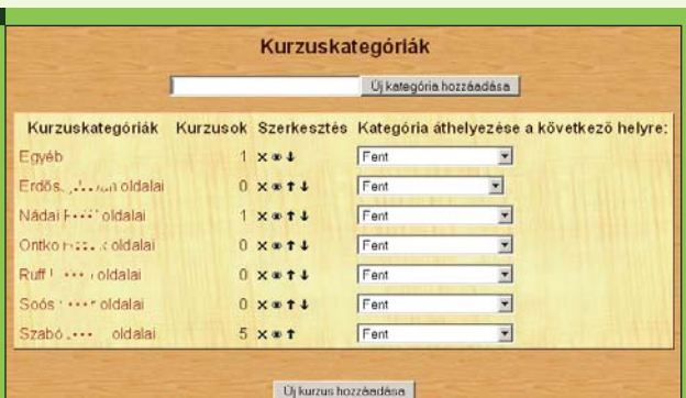
3. ábra Kurzuskategóriák szerkesztés közben