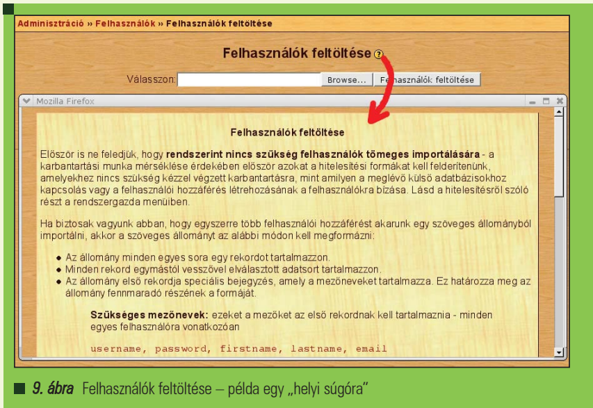
■ 9. ábra Felhasználók feltöltése – példa egy „helyi súgóra”

Számomra a postgres7.sql volt hasznos (a kedves Olvasó számára nagy valószínűséggel a mysql.php ). Itt először még nem tudhatja a jámbor szemlélő, hogy milyen táblát kell keresnie, de rákeresve a username szóra, egyből ráakadunk a prefix_user táblára (valódi adatbázisunkban a prefix szórészlet helyett más áll, pl. mdl ). Itt aztán a teljesség igényével lehetett bogarászni, és kezembe is akadt az „auth” mezőnév, amire szükségem volt. (Azt, hogy ennek a mezőnévnek mit adjak értékül, azt úgy tudtam meg, hogy egy felhasználónál az általam választott pam autentikációs módot adtam meg a regisztrációkor, majd rákerestem az élő adatbázisban, hogy mi áll az auth mezőben. Meglepve láttam, hogy „pam” az értéke. Innen tudtam, hogy nekem is ez kell. Egyébként teljesen logikusak az elnevezések, lehet tudni, hogy IMAP esetén imap stb. Ha fel tudja fogni minden érintett diák, hogy a bejelentkezés után csak rá kell kattintania az általa igényelt kurzus nevére, majd „kurzustagként” kell magát elfogadtatnia, akkor semmi teendőnk nincs a beiratkozás tekintetében. (Ha megadtunk beiratkozási kódot, akkor ezt persze célszerű az érintettekkel tudatni.) Ha a diákok egy része annyira nagy tudású, hogy ez az igenlő kattintás nem várható el tőle (vagy egyszerűen csak kedveskedni akar a tanár nekik azzal, hogy ne kerüljenek ilyen döntéshelyzetbe, hogy meg kelljen válaszolniuk egy „ Kurzustag vagy?! ” kérdést), akkor az adminisztrációs