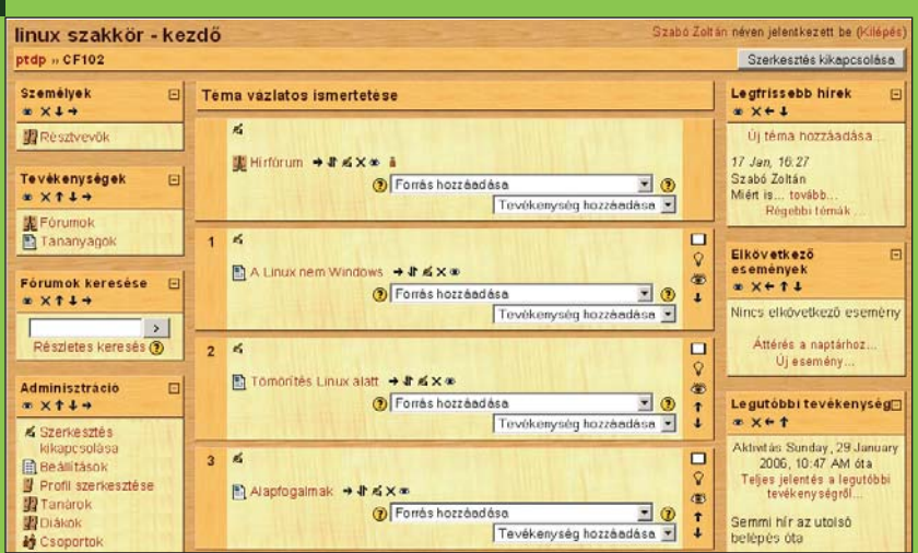
2. ábra Egy „linux szakkör” (mint kurzus) látványa szerkesztés közben

Minden tanár óráin adódhat olyan pillanat, amikor jól jönne, ha tanítványai számára elérhetővé tudna tenni egy-egy szöveget, képet, filmet, hangot, zenét, de ott az órán ez nem megvalósítható valami okból (például nincs nála, vagy nincs kéznél számítógép vagy projektor stb.). Az a szép a Moodle-ban, hogy sok kérdés hatékonyan oldható meg vele ilyen esetekben is.