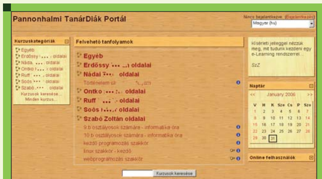
4. ábra Kurzuskategóriák, ahogy a diákok is látják – kurzusokkal együtt