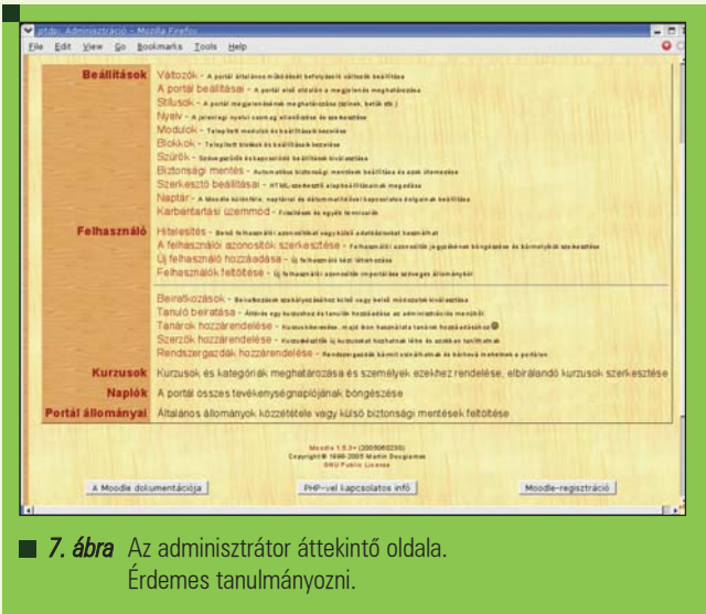
7. ábra Az adminisztrátor áttekintő oldala. Érdemes tanulmányozni.