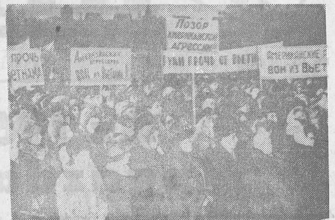
Moszkva nagy forradalmi múltú munkáskerületében — a Baunan, a Dzerzsinszkij, a Lenin kerületből ezrek és ezrek vonultak fel, hogy kinyilvánítsák szolidaritásukat az agresszió ellen küzdő vietnami néppel. „El a kezeket Vietnamtól!” „Testvéreink, veletek vagyunk!” „Az amerikai agresszió — gyátlázat!” feliratú táblák alatt felvonulók. A városközpontban, a Kropotkin téren tartottak nagygyűlést.