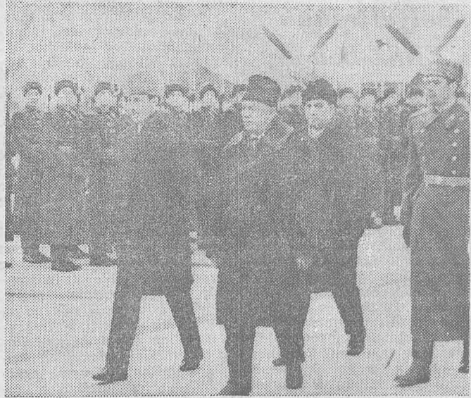
Bumedien algériai miniszterelnök elutazása előtt Podgor-nijjal, a Legfelsőbb Tanács Elnökségének elnökével a vukovói repülőtéren.

A Szovjetunió Legfelsőbb Tanácsának Elnöksége és a szovjet kormány a Kremlben ebédet adott Bumediennek, az Algériai Forradalmi Tanács elnökének, Algéria miniszterelnökének tiszteletére.