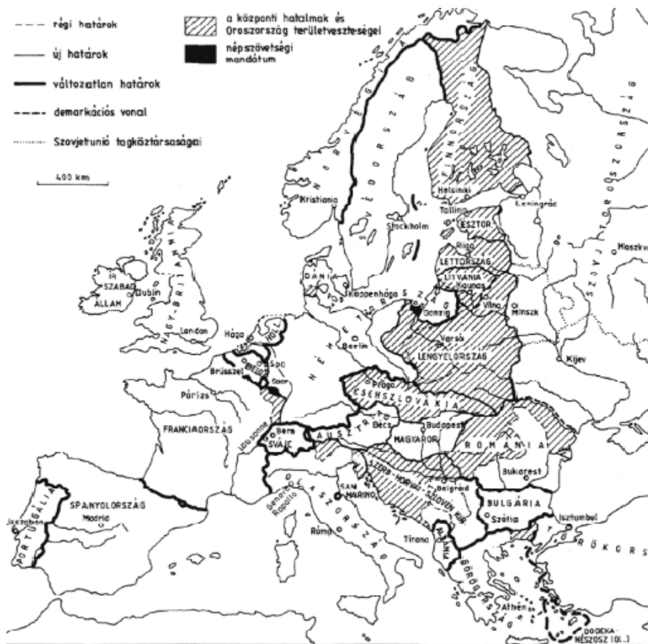
1. számú ábra. Az I. világháború után a Párizs környéki békek által létrehozott Köztes-Európa a Szovjet-Oroszországot elszigetelő kordon-államokkal 44

Államok egész sora jött létre, biztonságpolitikát stabilizáló cézzal. „Az I. világháború után Európa keleti felén kisállamok tűntek fel Németország és Szovjet-Oroszország között, a zsugorodó vagy eltűnő birodalmak helyén. Ennek az ún. Köztes-Európának kellett volna a kontinentális egyensúlyt garantálnia és „ cordon sanitaire ”-ként, »egészségügyi övezetként« elszigetelnie Moszkvát.” 45 A francia és