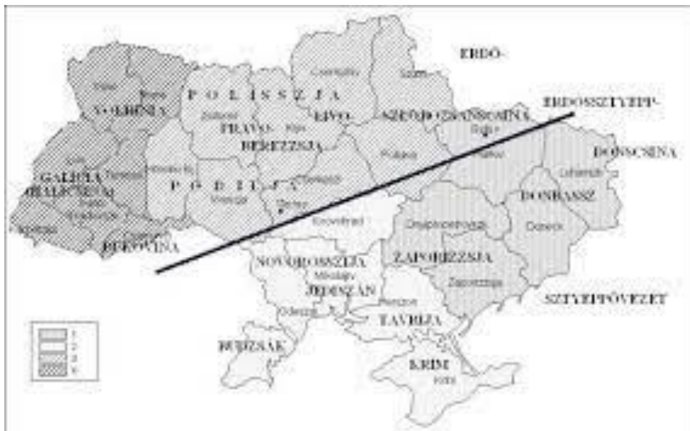
2. számú ábra. Geopolitikai törésvonal Ukrajnában az erdős terület és a sztyepperégió határa mentén 52

A Dnyeper egy olyan kelet-nyugati felosztást ad Ukrajnának, mely történelme során számos esetben játszott szerepet és számos esetben képezte a megszálló hatalmak közötti természetes határt. Hasonlóképpen jelentős szerepet játszott az ország történelmében területének északi és déli régióra osztása: az ország északi része erdősült, dombos (helyenként mocsaras ) terület, míg déli része sztyeppe.