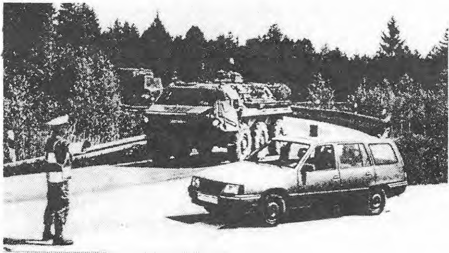
A tábori vadász bevezeti az autópályára a menetoszlopot