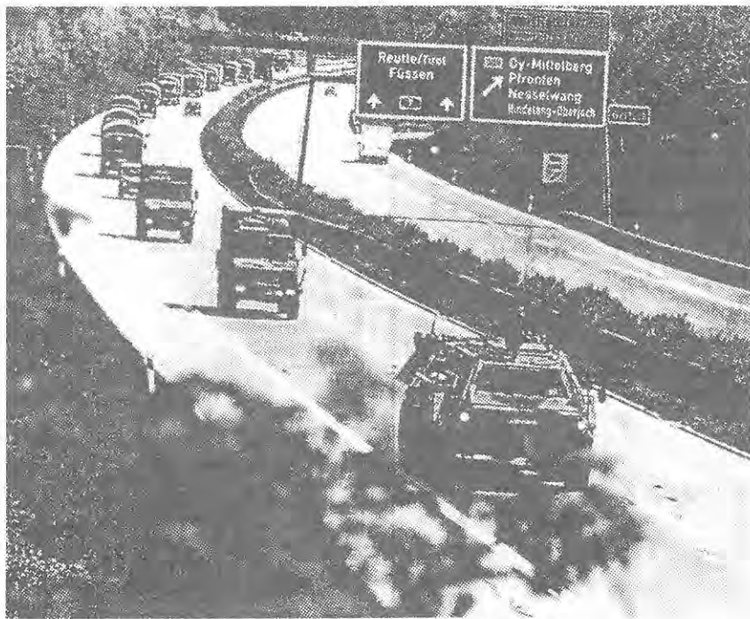
Óvatosan! katonai menetoszlop