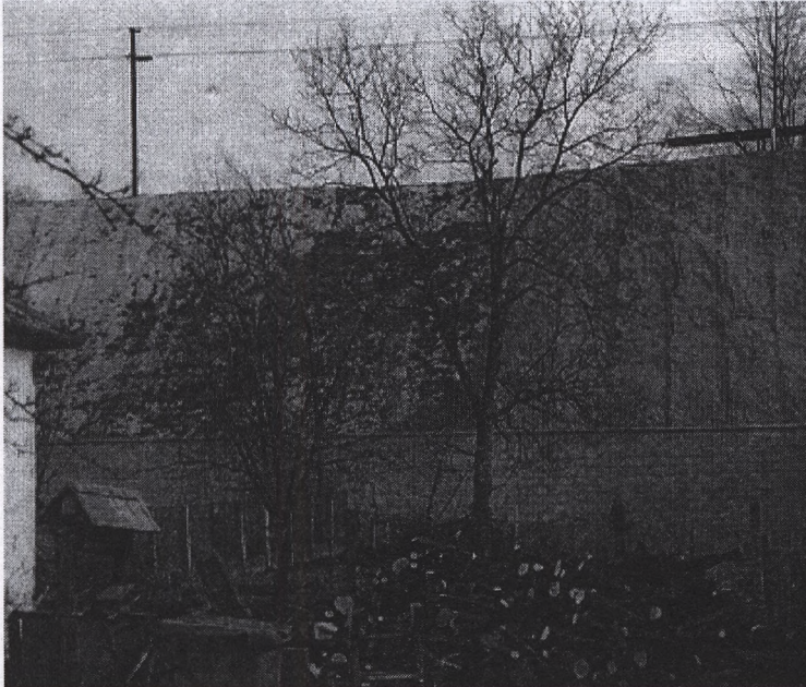
Sülysáp, Dózsa György u. 1998. 02. 11.

újítását már több éve folyamatosan készítjük a Főváros részére is. Egyelőre még kis volumenű ugyan, de számunkra nagyon fontos munkát jelent a Mátrában és a Tokaji hegységben régi tárok, aknák újbóli megnyitása. E munkákat a területre koncessziót nyert külföldi vállalkozók megrendelésére végezzük.