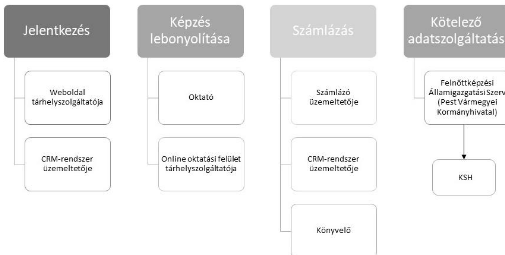
2. ábra: A felnőttképzésben résztvevők személyes adatainak kezelői, feldolgozói a felnőttképzőn túl

A következő ábra foglalja össze, hogy a fenti esetben mely szereplők számára szükséges a tanulók személyes adatainak átadása: