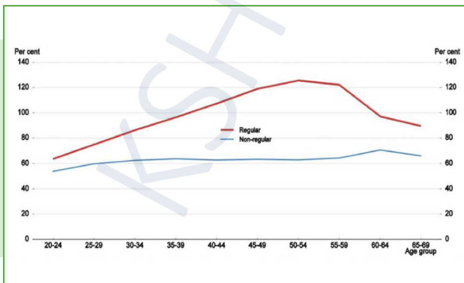
2. ábra: Keresetek az állandó (piros) és nem állandó (kék) foglalkoztatottak átlagkeresetének százalékában, korcsoportonként