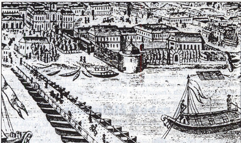
A szegedi vár képe Joó Mátyás rajzából, 1828 körül

irgalmasoktól, valamint a trinitáriusoktól összegyűjtött könyöradományokkal javították a rabok ellátását. A család, a hozzátartozók viszont nem küldhettek otthonról élelmiszercsomagot.