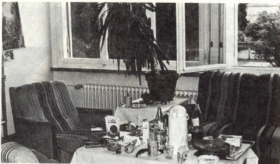
„Fejedelmi” rendtelenség a társalgó asztalán. Az itt élő fiataloknál a vezetők a „belső rend” megteremtését tartják elsődlegesnek