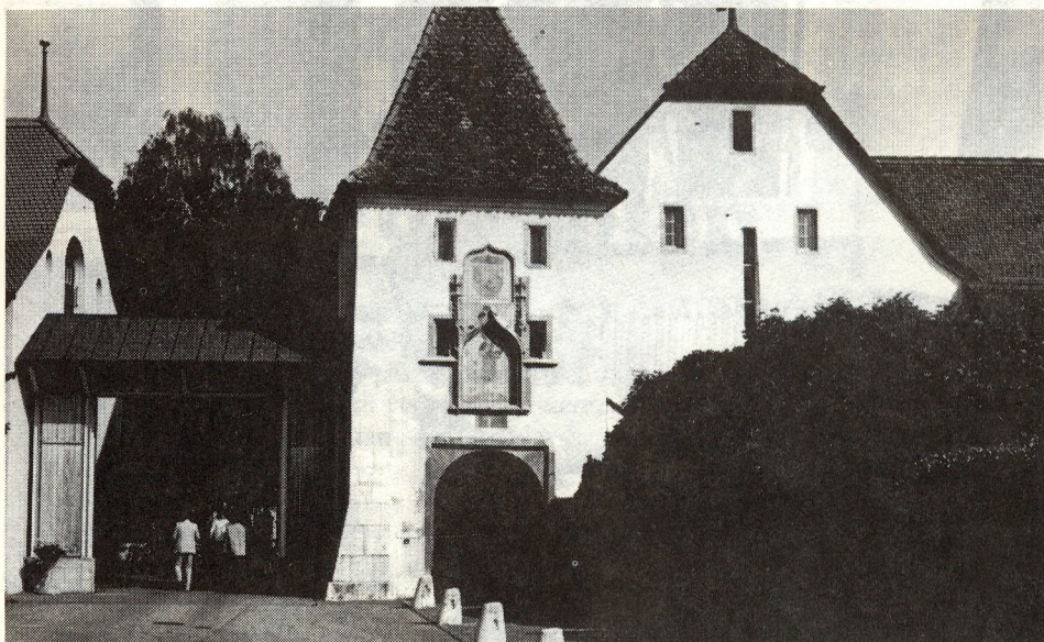
A St. Johannsen-i intézet főkapuja. Történelmi múlt és ultramodern technika harmonikus egységet alkot