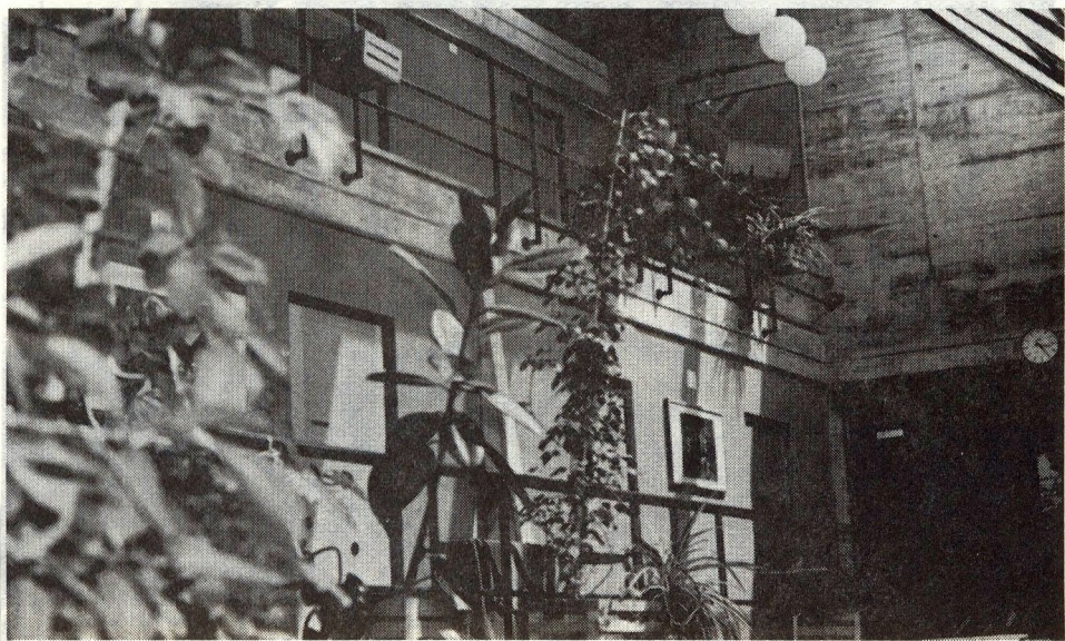
„Üdülői” környezet a witzwili félnyitott intézetben, ahol férfiak élnek. Erre a folyosóra nyílnak az elítéltek zárkaajtól