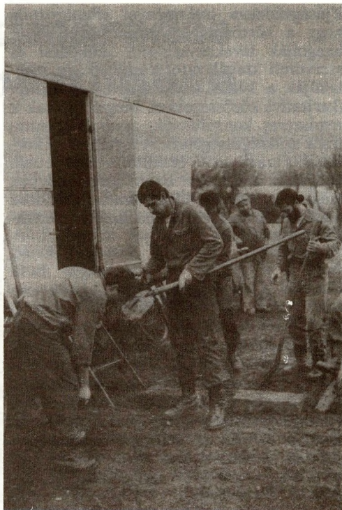
Két brigád közmunkát végez az önkormányzatnak

A tervezet részletesen szabályozza a javasolt gyakorlatot, amely szerint a kimenő fogházban és börtönben jutalomként, a szabadságvesztés-büntetés megkezdését követő három hónap eltelte után engedélyezhető, ha az illetőnek a kifogástalan intézeti magaviselete mellett megfelelő, rendezett külső kapcsolatai vannak. Természetes továbbá, hogy „az elítélt kimenőre (minden hónap második szombatján 8-tól 20 óráig) csak az engedélyen feltüntetett hozzátartozó megjelenése esetén engedhető”. A további szabályok részletes taglalása helyett írjuk be azzal, hogy a kísérlet zöld utat kapott, s Gyulán a hétfégi kimenő rendszere bevált, még akkor is, ha a felügyelők eleinte berzenkedtek, furcsállották a „zsványnak járó különleges jogokat”, hiszen ők — katonakorukban — mikor mehettek haza kéthetente? Ráadásul hazafias kötelességüket teljesítették, s nem követtek el bűncselekményt... Ez bizony igaz, de a családtagok, feleségek, gyerekek mérhetetlen öröme legalább ekkora igazság. Nem beszélve arról, hogy a szabadulás utáni beilleszkedés egyik gátja, a befogadó környezet hiánya, bizonyos esetekben ki-