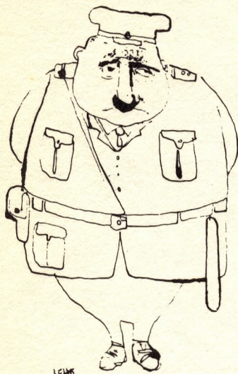
FÉLNI ÉS FÉLNI HAGYNI