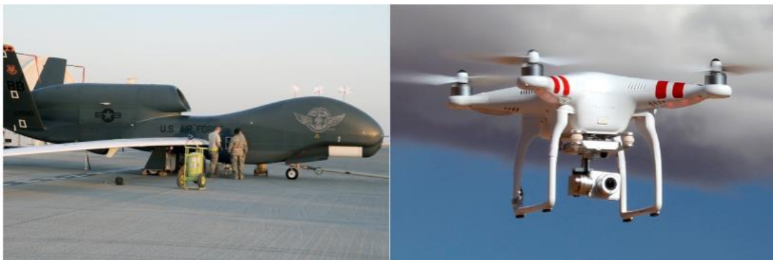
1. ábra Merevszárnyú és forgószárnyas pilóta nélküli repülő eszközök [3][4]

így emelkednek a magasba. Jó manőverező képesek, irányításuk távvezérléssel, vagy automatikával valósul meg. Katonai alkalmazásuk széleskörű, kezdve a megfigyelés-adatszerzésen át a csapásmérésig, ismertebb típusaik pl.: Global Hawk, Predator, Euro Hawk, stb.) [2].