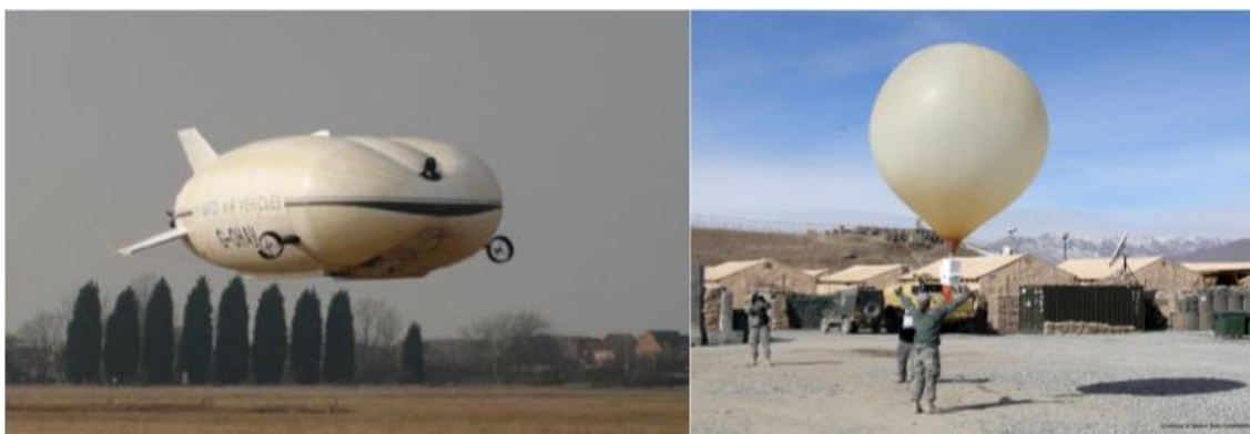
2. ábra A HAV3 típusú léghajó és egy meteorológiai léggömb [6][7]

„A léghajó levegőnél könnyebb, hajtóművel felszerelt légi jármű, kivéve a hőléghajót, mely e rész alkalmazásában a ballon fogalmába tartozik” [5].