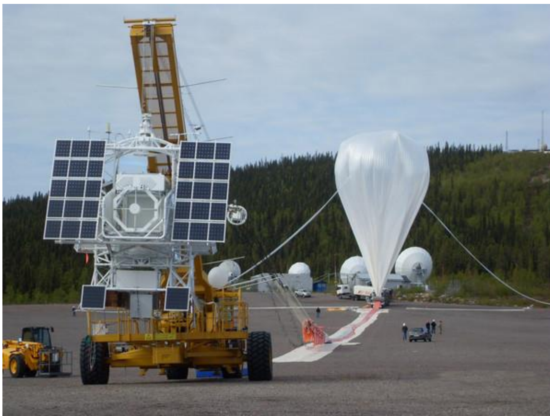
4. ábra A Raeven Aerostar nagy magasságú ballonja kommunikációs átjászó állomással felszerelve [15]

vagy feljebb engedné a ballont, hogy ellentétes irányú légörvénybe kerüljön, amely visszapozícionálná eredeti helyére. Az elképzelés komoly szkepticizmust váltott ki a szakemberekből, de az elnevezés alapján, még a cégen belül is. Mindemellett elmondható, hogy a vállalkozások mögött komoly tőke investíció állt. A Google Loon projektet nemrég átvette az X company, amely egy újabb jel arra nézve, hogy a tech óriás is kihátrál a kezdeményezés mögül. Egy ilyen prototípus a 4. ábrán látható. További érdekesség, hogy a 2014-ben prognosztizált maximum 90 km/h-ás szél-erősség helyett, 162 km/h-ás szélsébséget is mértek a tesztek során [14].