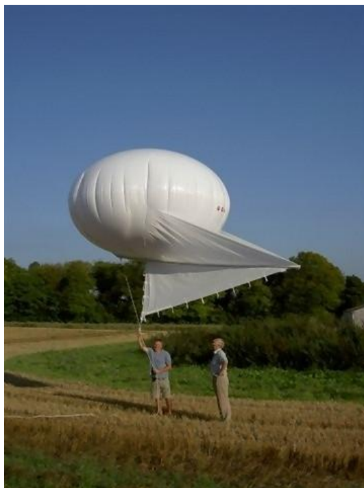
3. ábra A léggömb és „sárkány” test kereszteződése a helikite [8]

vitorlázson, így jobban ellenáll az időjárási viszontagságoknak, mint a hagyományos léggömbök. A következő ábrán egy helikite figyelhető meg: