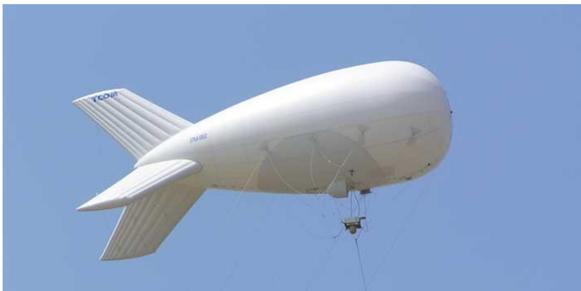
5. ábra TCOM LP 17M harcászati szintű kötött léghajó [22]

QAM voltak. Az elvárásoknak megfelelően megállapítható, hogy az alacsonyabb számú fázisállapottal rendelkező modulációk jobb eredményeket produkáltak hatótávolság tekintetében, azonban 15 km távolságban a 2,6 GHz-es sávban még így is voltak problémák (10 km-ig jól alkalmazható QPSK modulációval a rendszer). A 700 MHz-es sáv egyaránt jól vizsgázott 10 és 15 km-es távolságban. A mérések valós környezeti viszonyok között, közepesen átszegdelt területen történtek. Költségeik lényegesen alacsonyabbak a korábban említett ballonokhoz képest. Az USA szárazföldi hadereje az afganisztáni műveleteihez 50 ezer dollár/ készlet áron vásárolt helikite-okat [26], egyébiránt a hivatalos forgalmazótól átlagosan 6000 dollárért megvásárolható az alap platform [27], amelyre további ISR szenzorok és relék szerelhetők.