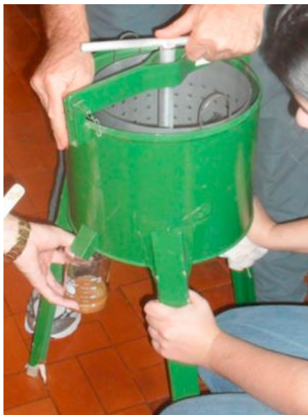
3. ábra Főzött halmaradványok sajtolása. Error! Reference source not found.

A folyékony komponens abban az állapotában nyersolajat és vizet tartalmazott. Az utóbbi összetevőt ki kellett vonni a kapott elegyből, így magát a folyadékot 24 órán keresztül 60 \pm 10 °C-on szárították. Ezt az eljárássort négyszer végezték el. [2]