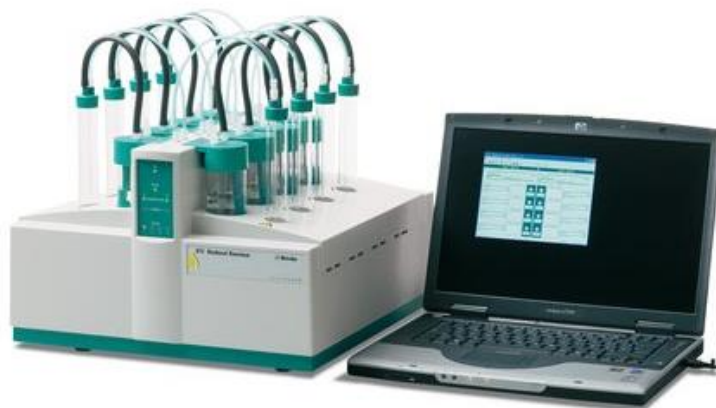
5. ábra Metrohm Rancimat 873 biodízel oxidációs stabilitásának meghatározására szolgáló mérőkészülék Error! Reference source not found.

Fűtőérték (alsó fűtőérték): meghatározására kaloriméter-bombát használtak, 0,5 gramm mennyiségű mintát elemezve szobahőmérsékleten, 30 bar túlnyomásoson. A mérés befejeztével ellenőrizték a kutatók, hogy teljesen lezajlott-e az égés. A kapott érték a felső fűtőérték lett, amelybe beleszámít az égésnél keletkezett vízgőz kondenzációs hője is. Az alsó fűtőérték (ICP) az alábbi egyenlettel számolták ki: