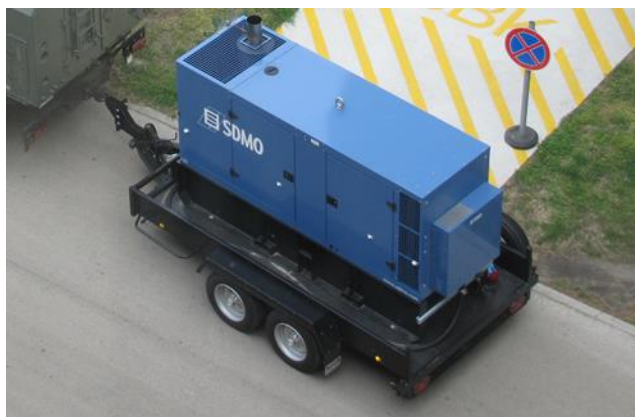
4. ábra Mobil dízelgenerátor

Mobil, utánfutóra szerelt dízelgenerátorok tárolására egy könnyűszerkezetes garázs lett tervezve, amely a mobil dízelgenerátorok telepítésével egy időben épült. A dízelmotorok rendszeres, terheléses indítási próbája a garázsban a parkolóhelyre volt tervezve, hogy ne kelljen feleslegesen mozgatni a mobil egységeket. Annak érdekében, hogy a dízelmotorok füstje ne a garázst terhelje kipufogógáz elvezető rendszer került kialakításra. Ez egy elszívó ventilátorból és egy több méter hosszúságú gégecsőből áll. A tervezett gégecső megengedett maximális hőmérséklete 400 °C volt, míg a dízelmotor teljes terhelése esetén a kipufogógázok hőmérséklete meghaladta az 550 °C-t. ennek következtében a tervvel ellentétben a teljes terheléses járatásokat a garázsban nem lehet elvégezni, csak részterheléses próbákat, a teljes terhelésű próbákhoz a dízelgenerátorokat a garázs elé kell vontatni, ami nagyobb élőmunkát igényel, mint a benti járatás. A tervező nem vette figyelembe a terheléses járatás során kialakuló üzemi paramétereket csak az üresjáratú paraméterekre volt tekintettel.