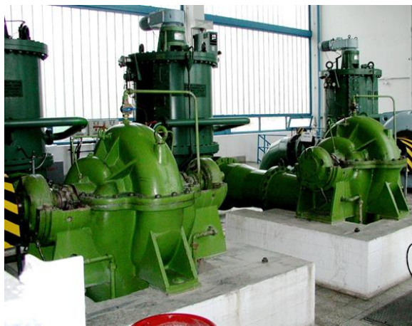
5. ábra Ipari hűtővíz szivattyútelep

tervegyeztetők, hogyan tudják javítani a tervatnézés, tervellenőrzés minőségét. Ennek fontosságát hangsúlyozza, hogy a tervkészítés folyamatában az erőműves szakemberek nem vesznek részt, így a tervkészítés mindennapi nehézségei náluk nem jelentkeznek és, mint külső szemlélők a terv lényegi elemeire tudnak koncentrálni és a nem megfelelősségeket időben észrevenni.