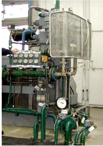
2. ábra Rekonstrukció előtti kompresszor