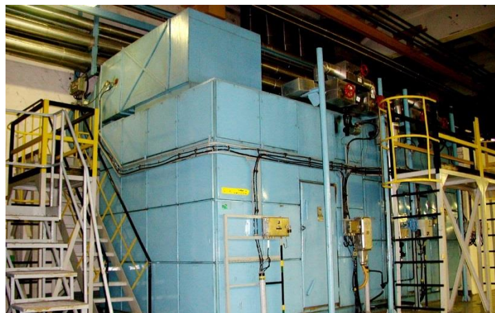
3. ábra Rekonstrukció előtti klímagép

A technológiai terek levegőparamétereit kondicionáló klímagépek műszakilag és erkölcsileg teljesen elavultak ezért teljes cseréjük vált szükségessé. A régi klímagépek a klasszikus szűrőkamra – keverőkamra – előfűtő kalorifer – hűtő kalorifer – mosókamra – utófűtő kalorifer – ventilátor egységekből álltak. A klímagépek felépítése az úgynevezett mosókamrában lévő hármatponti szabályozáson alapult, aminek eredményeképpen bármilyen külső környezeti paraméterek mellett teljesíthető volt a klimatizált helyiségekben elvárt levegő hőmérséklet és páratartalom. A teljesen új, mai kornak megfelelő klímagépek esetén az előbb említett egységeknél a mosókamra helyett gőzlégnedvesítő került beépítésre, míg az utófűtő egységek teljesen el lettek hagyva, mert a tervezői állásfoglalás szerint szükségtelen volt a beépítésük. A gyakorlat ezzel szemben mást eredményezett, mert bizonyos átmeneti környezeti üzemi állapotokban (téli és tavasszal) utófűtés nélkül nem lehetett tartani az elvárt páratartalmat a klimatizált helyiségekben. Utólag kellett minden egyes klímagépbe beépíteni az utófűtőket és a klímagépek szabályozását ennek megfelelően módosítani.